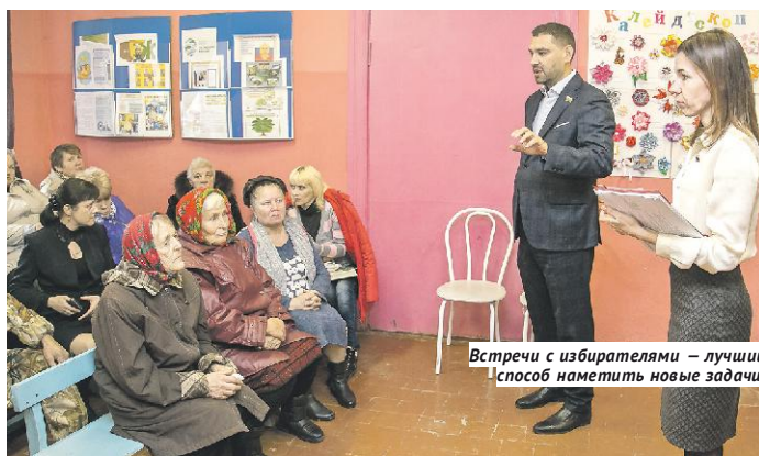
Встречи с избирателями — лучший способ наметить новые задачи.

Но главной гордостью депутатов является строительство школы в посёлке Горный. Она будет открыта в ближайше недели — там завершаются последние приготовления к приёму учеников, идёт оснащение оборудованием. В своё время