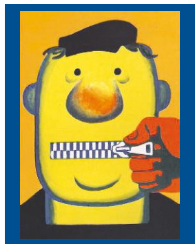
Плакат 1981 года. «Наше условие — долгой сквернословие!» Автор — К. Иванов

13 БЕЗ ЦЕНЗУРЫ В России матерится 70% населения. Вместе с экспертами мы попытались выяснить, как дошли до жизни такой.