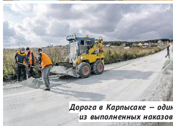
Дорога в Карпыскае — один из выполненных наказов.