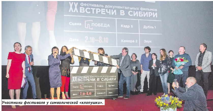
Участники фестиваля у символической «хлопушки».

Международный фестиваль документального кино «Встречи в Сибири» приглашает на просмотры лучших фильмов, мастер-классы и дискуссии.