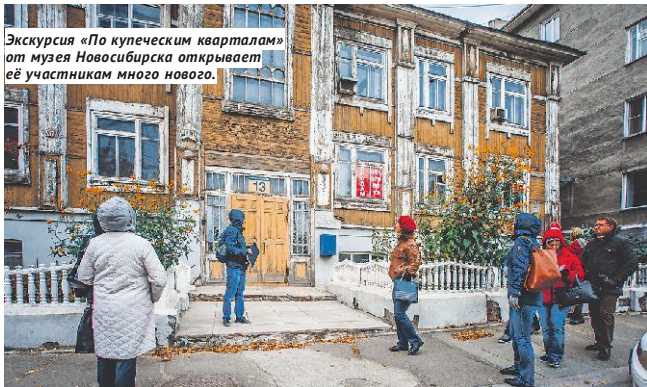
Экскурсия «По купеческим кварталам» от музея Новосибирска открывает её участникам много нового.

У нас хоть и столица Сибири, но не Москва, не Петербург и даже не Казань с её тысячелетней историей. Новосибирск — город молодой, промышленный, культурным наследием, казалось бы, особо не богат. Но это не помешало сотрудникам Музея не просто сочинить полтора десятка экскурсий на самые разные темы, но ещё и проводить их так, что у участников возникает полное ощущение погружения во времена столетней давности. Гуляя «по купеческим кварталам», можно почувствовать себя солидным жителем Новониколаевска, скотлившим приличное состояние и прикупившим ладный особнячок где-нибудь на улице Гондатти. На экскурсии «Михайловская роща, или Дядя, будь проще» всё наоборот: гоп-стайл прогулка по задворкам центра будет небезопасной, зато насыщенной хулиганской романтикой, а перед ней обязательно стоит отретировать хоровое исполнение ранних творений Александра Розенбаума. Авангардно-мистическое путешествие «Бэтмен в Сибирском Чикаго» окунает в атмосферу 20-х годов, когда женщин хотели освободить от кухонного рабства, объявляли бой мещанству, а в архитектуре царил авангард. Прогулка по «саду Альгамбра» расскажет, кому аплодировали новониколаевцы в начале прошлого века и как молодой Новосибирск стал колыбелью космонавтики. Не менее интересны и другие экскурсии — каждая открывает что-то новое в, казалось бы, давно знакомом городе.