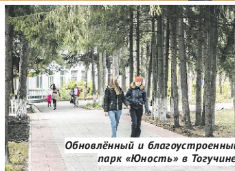
Обновлённый и благоустроенный парк «Юность» в Тогучине.

депутаты сумели удержать минимальное финансирование из бюджета и дождались вхождения в федеральную программу при поддержке области. Следующим значимым объектом — в Тогучине — станет строительство спорткомплекса.