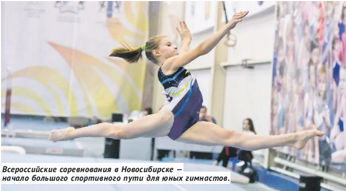
Всероссийские соревнования в Новосибирске — начало большого спортивного пути для юных гимнастов.