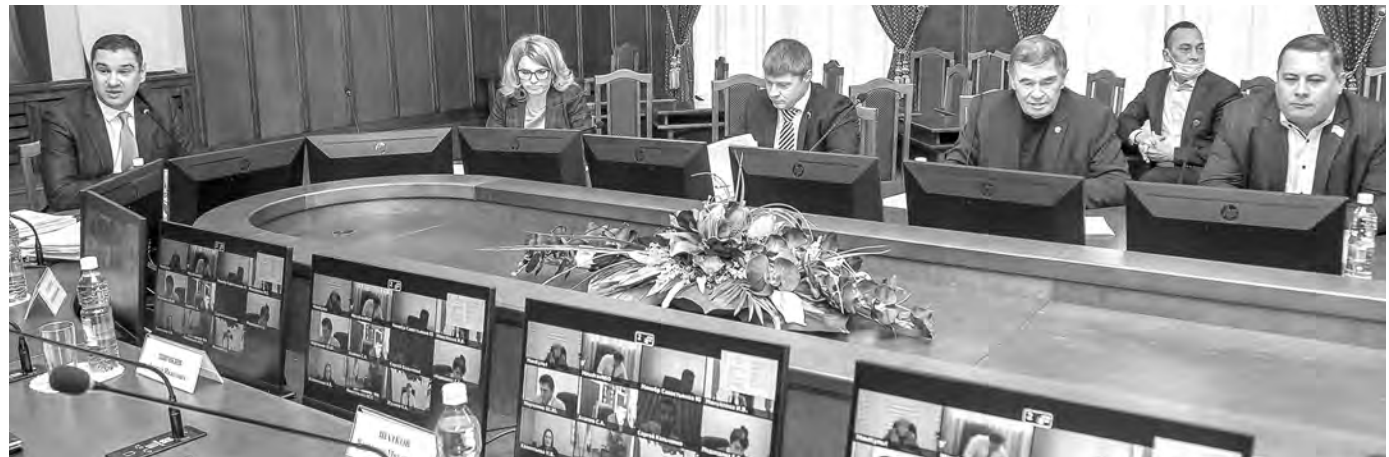
На заседании комитета по бюджетной, финансово-экономической политике и собственности.

Предусмотрено 500 млн рублей на финансирование второго транша капитального гранта для строительства семи по-