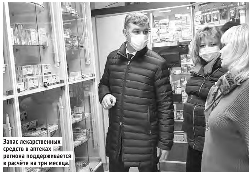
Запас лекарственных средств в аптеках региона поддерживается в расчёте на три месяца.