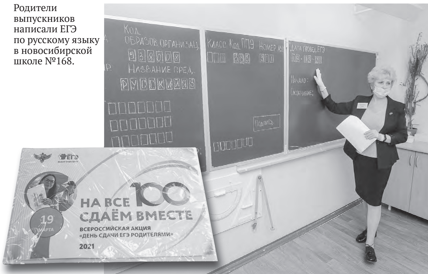
Как и на настоящем экзамене, с заданием сами экзаменаторы не были знакомы до последнего момента.

Родители выпускников написали ЕГЭ по русскому языку в новосибирской школе №168.