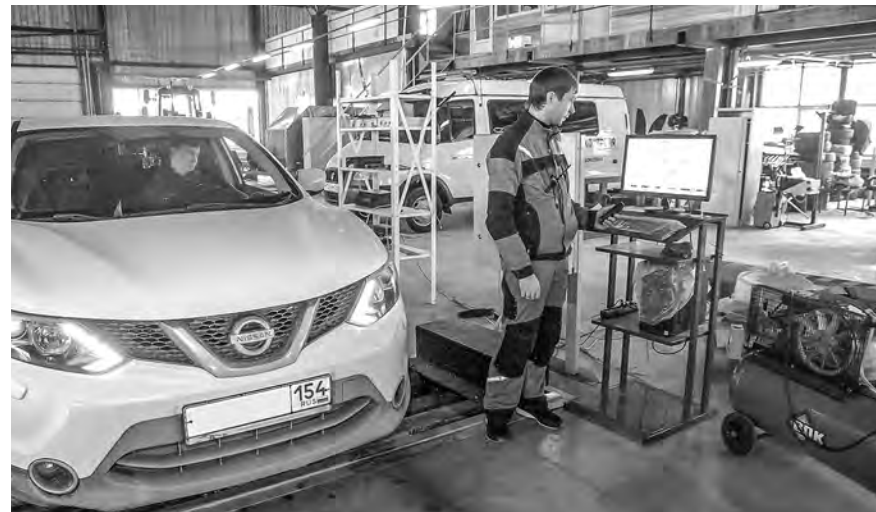
С 1 по 15 марта технический осмотр прошли 3 911 транспортных средств.

ля в момент съёмки обязаны совпадать с координатами пункта техосмотра из реестра аккредитованных операторов. Так проверяющая сторона сможет удостовериться, что машина действительно проходила техосмотр в указанном сервисе в указанное время. Все сделанные фотографии должны быть подписаны усиленной квалифицированной электронной подписью.