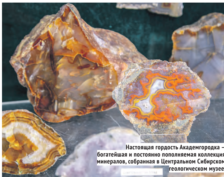
Настоящая гордость Академгородка — богатейшая и постоянно пополняемая коллекция минералов, собранная в Центральном Сибирском геологическом музее.