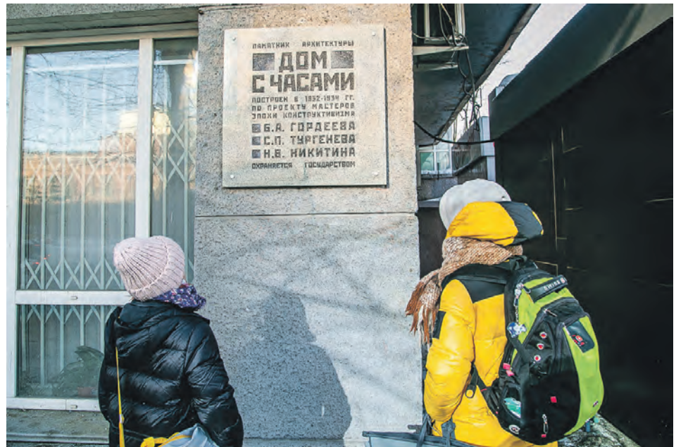
Дом с часами — один из символов Новосибирска и памятник архитектуры регионального значения.