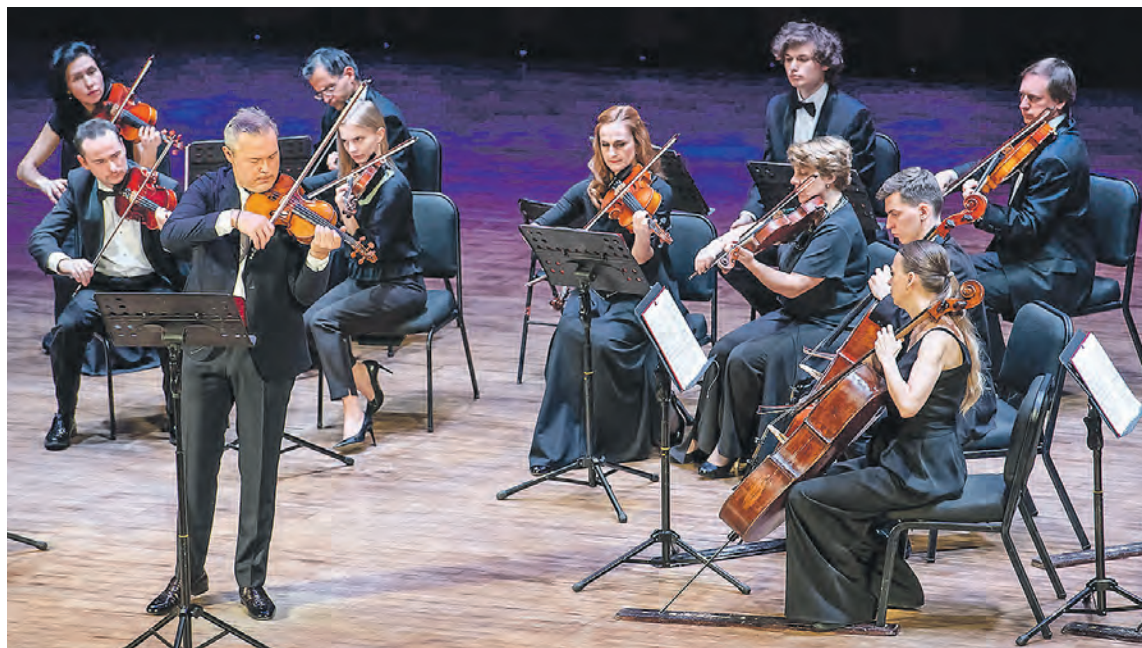
Цены билетов на концерты фестиваля в среднем от 500 до 2 000 рублей.

Восьмой Транссибирский арт-фестиваль стартует 25 марта и продлится месяц.