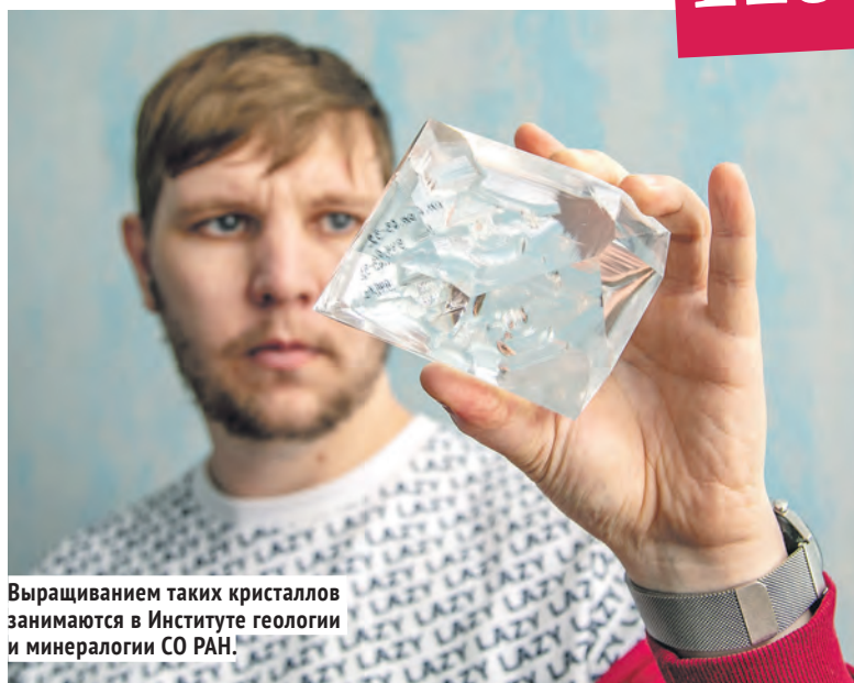
Выращиванием таких кристаллов занимаются в Институте геологии и минералогии СО РАН.

Откуда в недрах Земли берётся нефть и как предугадать наступление экологической катастрофы?