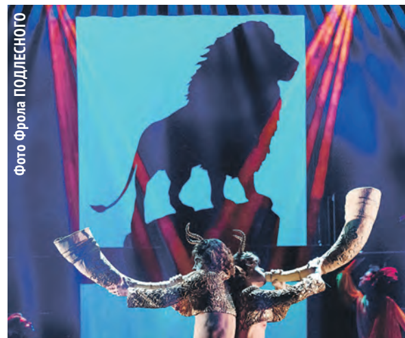
Спектакль «Хроники Нарнии. Племянник чародея» Красноярского ТЮЗа.

В фестивальной афише три новосибирских спектакля: «Дети солнца» театра «Красный факел», режиссёр Тимофей Кулябин ; «Идиот» театра «Старый дом», режиссёр Андрей Прикотенко ; «Русский роман» театра «Глобус», режиссёр Марат Гацалов .