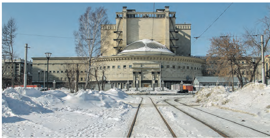
В этом году планируется завершить работы в сквере за оперным театром.

охарактеризовал свою «подведомственную» территорию: