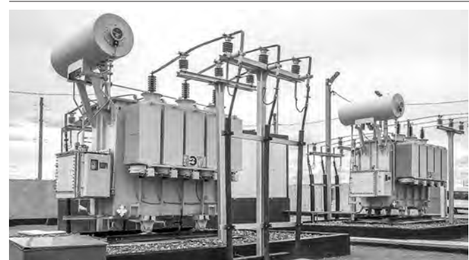
Вложения в инфраструктуру помогут региону рассчитывать по кредитам.

Страницу подготовила Татьяна МАЛКОВА