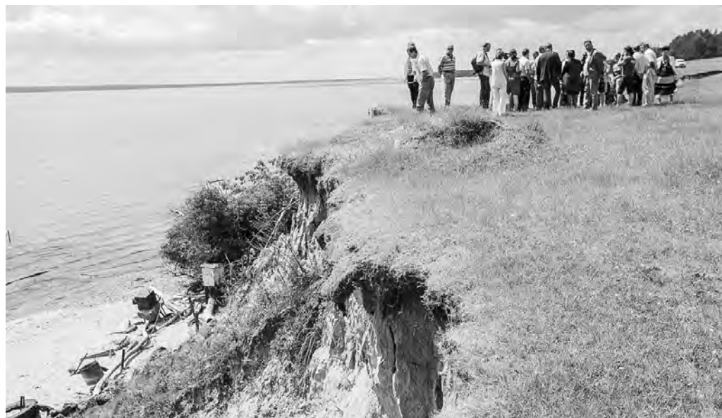
При успешном проведении защитных мероприятий Красному Яру удастся предотвратить ущерб в 245 млн рублей.

Название посёлка Красный Яр, что в Ордынском районе Новосибирской области, уже превратилось в своеобразный символ «мести» природы человеку: после создания Новосибирского водохранилища Красный Яр оказался на самом его берегу, и теперь медленно, но верно вода отвоёвывает у жителей посёлка их жизненное пространство. Тревогу областные власти и депутаты забили ещё несколько лет назад, но до сих пор активных защитных мероприятий по укреплению берега возле Красного Яра не проводилось. Дело не в нежелании региональных властей: всё, что требуется от них — в виде проекта дамбы, — уже сделано. Осталось лишь «малое» — обратить на свою проблему внимание федерального правительства. Достучаться до Дмитрия Медведева в его бытность премьером в 2016 году не удалось. Теперь надежда — на вице-премьера Викторию Абрамченко . Именно она курирует федеральную целевую программу развития водохозяйственного комплекса страны. И именно к ней заксобрание НСО обратится с просьбой о выделении средств для укрепления берегов водохра-