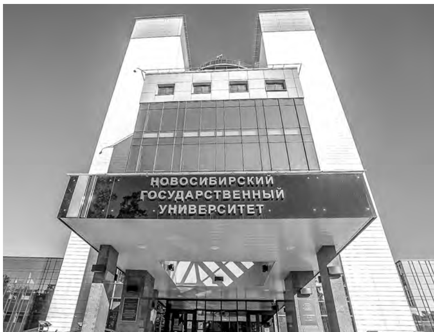
Сейчас четверо из каждых пяти сотрудников НГУ одновременно являются сотрудниками институтов СО РАН.

Одновременно с СО РАН был основан Новосибирский государственный университет — вуз нового типа, который предназначался для подготовки кадров фундаментальной науки. И сейчас четверо из каждых пяти сотрудников НГУ одновременно являются сотрудниками институтов СО РАН, а студенты — начиная с третьего курса — присоединяются к ним, получая возможность работать в академических лабораториях. С недавнего времени СО РАН подключилось к программе по созданию в научных институтах молодёжных лабораторий («Ведомости» рассказывали о том, какие исследования ведутся в таких лабораториях Института катализа в материале «Катализатор прогресса»). Также СО РАН активно работает по включению в академические учёные советы специалистов из университетов — в частности, Новосибирского государ-