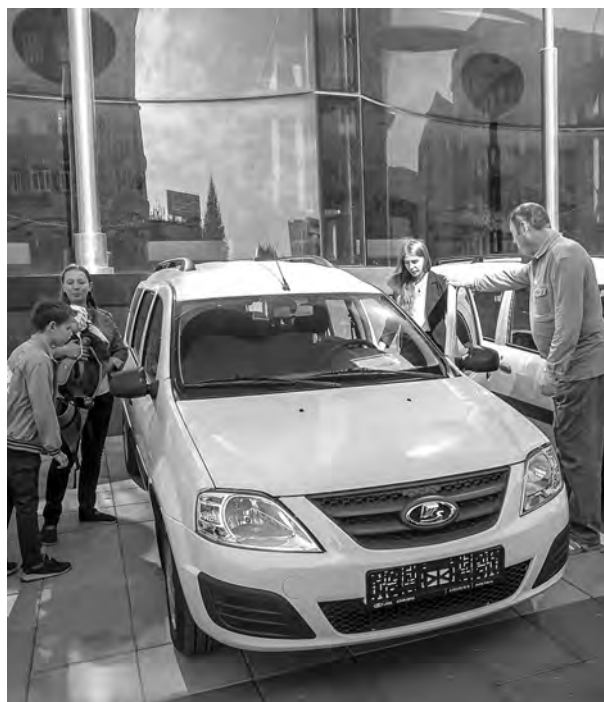
С 2012 года около 39 тысяч многодетных семей получили сертификат на областной семейный капитал.

Подробная информация о выплатах и пособиях размещена на сайте министерства труда и социального развития Новосибирской области http://mtrnso.ru . Получить консультацию специалиста можно по телефону горячей линии 8-800-100-00-82.