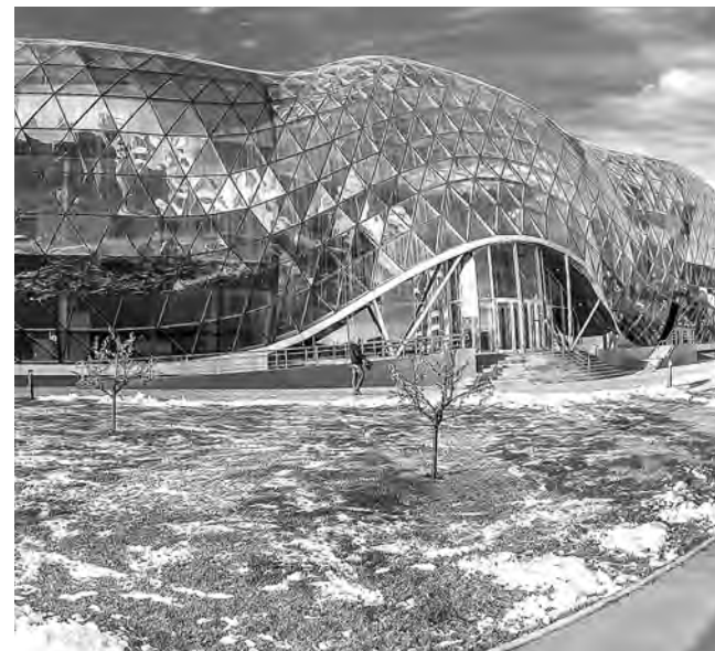
Планируется строительство второй очереди Биотехнопарка.

Перспективные проекты на территории ПЛП: строительство центра обработки данных (2 млрд рублей инвестиций), создание производства пищевой продукции, медоборудования и упаковки (более 1 млрд рублей). Прорабатываются варианты реализации крупных инвестпроектов и на других площадках Новосибирской области.