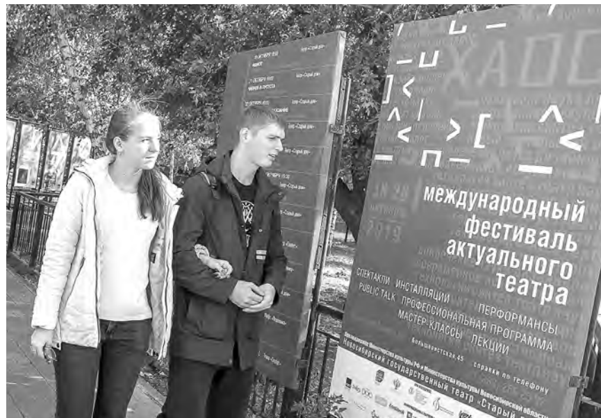
В 2021 году пройдёт Международный фестиваль актуального театра «ХАОС» театра «Старый дом», ставший настоящим событием 2019-го.