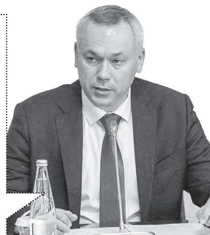
Андрей ТРАВНИКОВ, губернатор Новосибирской области

Снег во дворах начинает проседать, создавая неудобства для пешеходов и автомобилистов. Эту сырую кашу месить ногами и колёсами не приятно никому. Просьба усилить работу по очистке дворов и вывозу снега из внутриквартальных территорий.