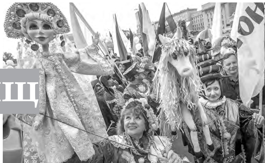
В этом году вновь состоится Международный фестиваль «Перекрёсток», который проводит Новосибирский областной театр кукол.

помощью автоклуба. Они очень помогают в период уборочной и посевной кампаний, могут работать на фестивальной поляне, на берегу реки, где нет электричества. Вы же знаете, что к 2030 году по указу президента России мы должны в три раза увеличить охват людей разного рода интересными мероприятиями, праздниками и фестивалями. И для этого мы должны использовать разного рода площадки — не только клубы, театры или музеи. Мы будем создавать филиал нашего единственного государственного театра на территории области — карасукского театра «На окраине» — в Купино. Наши театры, государственные и частные, будут ездить в районы, для этого в