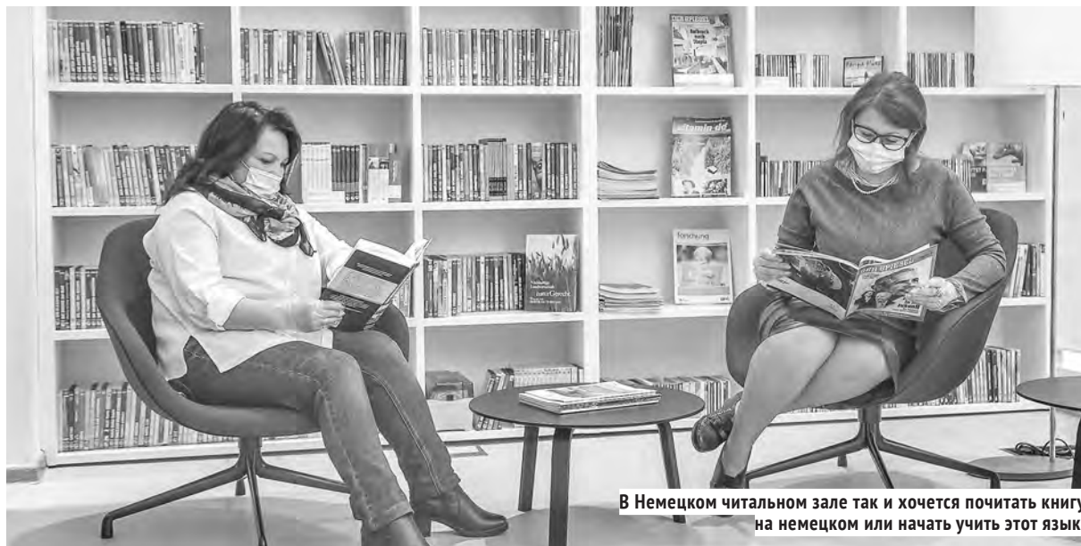
В Немецком читальном зале так и хочется почитать книгу на немецком или начать учить этот язык.

Вместо возвышающихся в центре книжных стеллажей — современное трансформируемое пространство: стеллажи по периметру, большой экран для видео, уютные кресла, пространство для общения, кофейная зона. Всё функционально, продумано и заманчиво, нам самим захотелось осваивать немецкий язык и знакомиться с культурой Германии в этом новом зале.