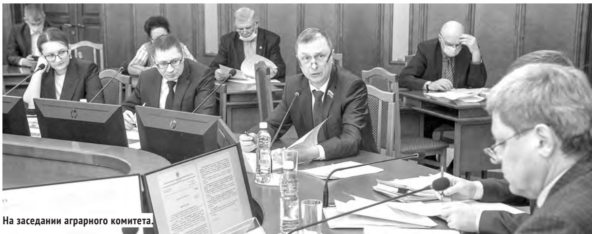
На заседании аграрного комитета.

Любая полеводческая кампания — будь-то посевная, заготовка кормов или уборка зерновых — всегда ограничена технологическими сроками. Завершить работы нужно как можно быстрее, и любой фактор ускорения процесса крайне важен, особенно — мобильность сельскохозяйственной техники. В таких условиях серьёзной проблемой является переезд комбайнов и тракторов с одного поля на другое в плане пересечения