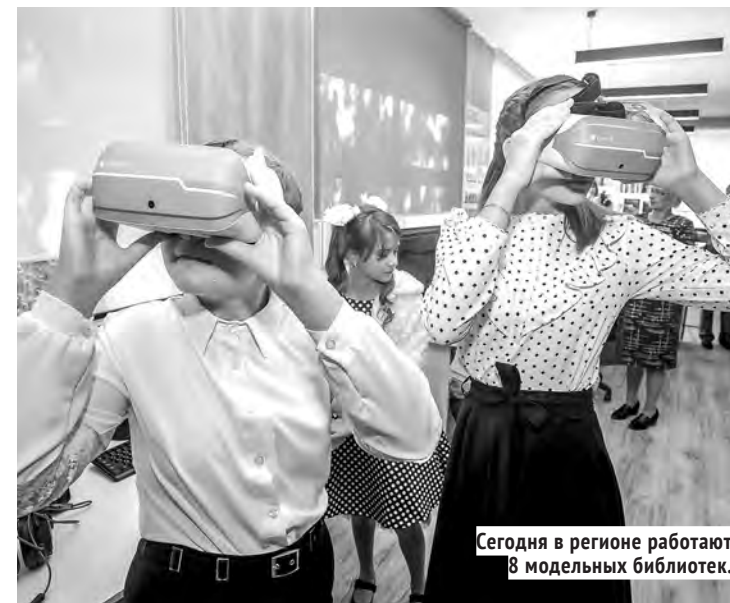
Сегодня в регионе работают 8 модельных библиотек.

Недавно в Венгеровской детской модельной библиотеке начал работу кружок английского языка «Английский для малышей» для детей в возрасте от 6 до 9 лет. Также в числе проектов — проект Кочковской детской модельной библиотеки по работе с детьми и подростками с ограниченными возможностями здоровья «Все краски жизни через книги», проект Криводановской модельной сельской библиотеки им. А. Кухно «Вечер-беседа «Чем памятен нам будет этот год: творческий отчёт о работе за 2021 год»». Мошковская центральная модельная библиотека реализует проект «Здесь возможно всё!» для незрячих и слабовидящих читателей.