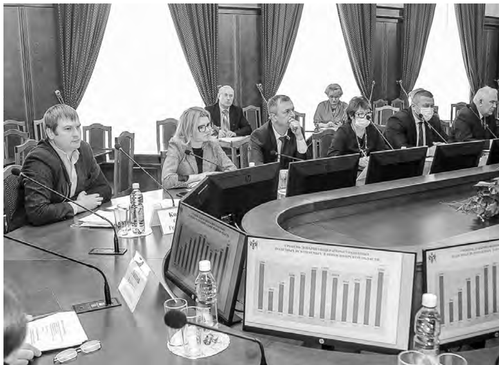
На заседании комиссии заксобрания по экологии.

К 1 марта в регионе накопилось в среднем от 100 до 127 сантиметров снеготолщины, в бассейнах рек Иня и Чулым эта цифра составляет 138–142 сантиметра. Лёд на водоёмах немного тоньше нормы: на реках он в пределах 38–69 сантиметров, на водохранилище — 62–82 сантиметра. Вскрытие рек предполагается во второй декаде апреля — на 2–5 дней раньше обычного срока. На реках Бердь, Иня, Карасук во время вскрытия возможны заторы льда и, как следствие, резкий подъём воды и подтопление низин. Половодье на Берди и Ине