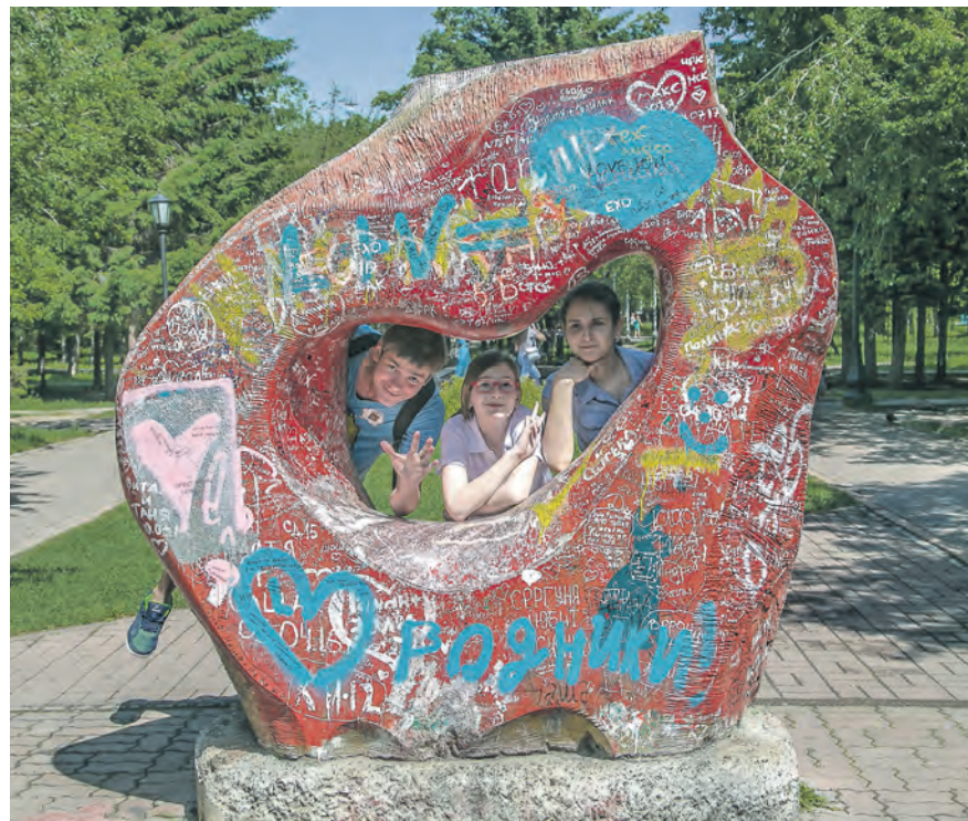
Популярное у горожан «сердечко», согласно проекту, перенесут в другое место.