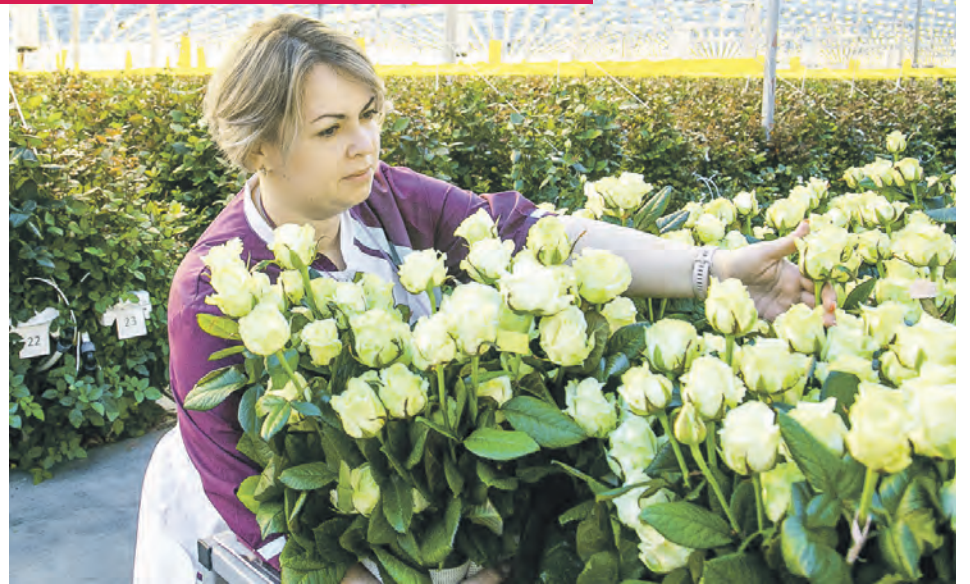
В день в теплице срезают и отправляют в магазины 25–27 тысяч роз.

Пока всё ограничивается пятью сортами роз, которые были высажены на стыке сентября и октября прошлого года. В Голландии закупили более 170 тысяч розовых ку-