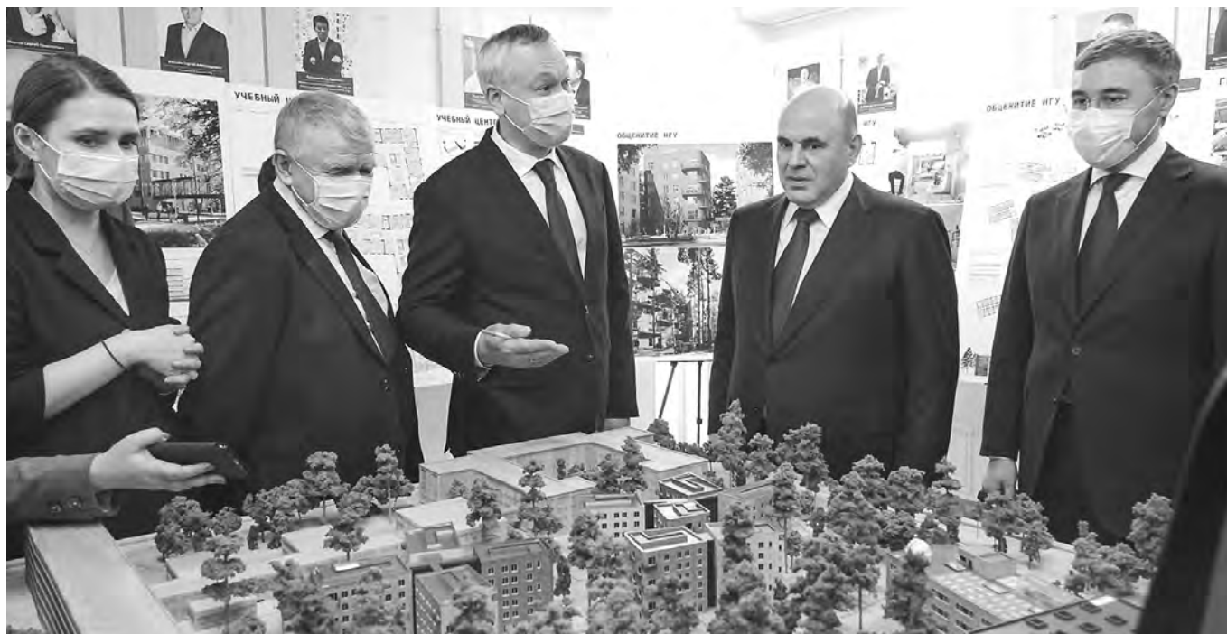
Михаил Мишустин находился в Новосибирске с рабочим визитом 4 и 5 марта.

Участниками обсуждения также стали заместитель председателя Правительства РФ Дмитрий Чернышенко , первый заместитель председателя Госдумы РФ Александр Жуков , министр финансов РФ Антон Силуанов , министр науки и высшего образования РФ Валерий Фальков , полномочный представитель Президента РФ в СФО Сергей Меняйло .