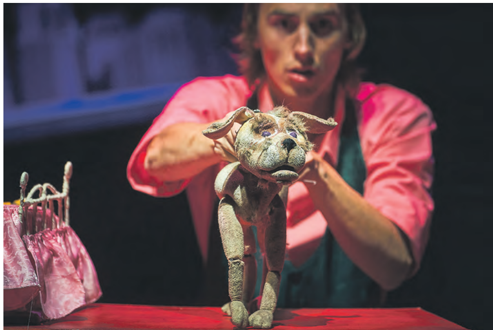
Спектакль театра кукол «Собаки» никого не оставит равнодушным.

Премьеры в новосибирских театрах одна другой ярче, но зритель пока идёт осторожно — в залах есть пустые места.