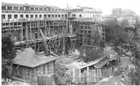
Тридцатые годы прошлого века. Строительство Дома артистов. Кстати, обратите внимание: верхний этаж намного «ниже», чем все остальные. Это была задумка архитекторов — добавить изюминку в строгую геометрию здания.