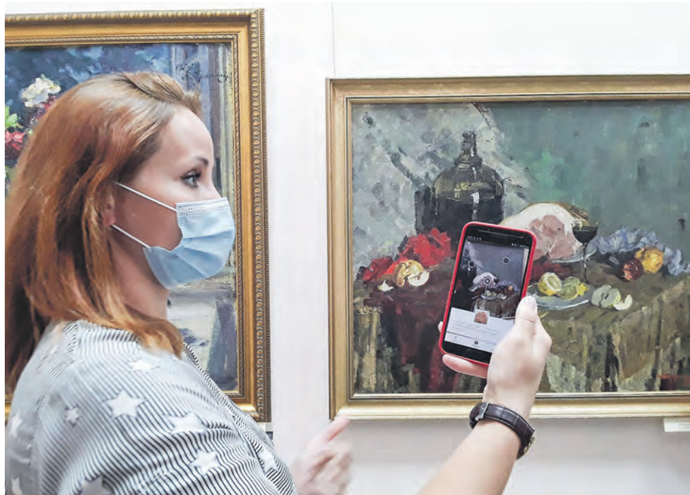
Государственный художественный музей Алтайского края в Барнауле рассказывает, как смотреть их выставки в приложении «Артефакт».

Не поездка — мечта, однако и поработать пришлось. Участникам выдали на руки «Рабочие