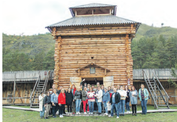
Участники семинара в музее «Форт Куюм», Чемальский район Республики Алтай.