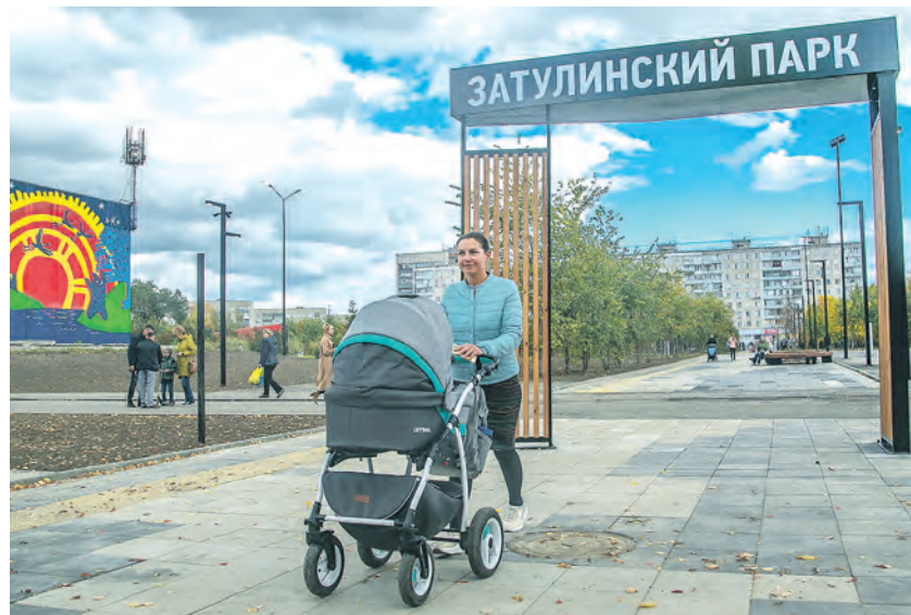
Проект дисперсного парка является одним из самых масштабных в регионе — как по размерам, так и по финансированию.

Слово «дисперсный» обозначает раздробленность, рассеянность. В этом и заключается суть проекта: взять близко, но отдельно стоящие общественные пространства — скверы, парки, детские и спортивные площадки — и объединить их в единое целое. Территория на Затулинке, за кинотеатром «Рассвет», подходила для этого как нельзя лучше. Жилмассив этот зелёный, уютный, но одного места отдыха, парка, здесь никогда не было. Были «Сквер Кировчан», городок аттракционов, бульвар на улице Петухова, какие-то отдельные площадки во дворах. Связать всё это воедино велодорожками и пешеходными маршрутами, попутно обла-