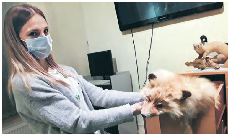
Лиса лежит в одном из ящичков, который можно открыть. Национальный музей им. А. В. Анохина в Горно-Алтайске.