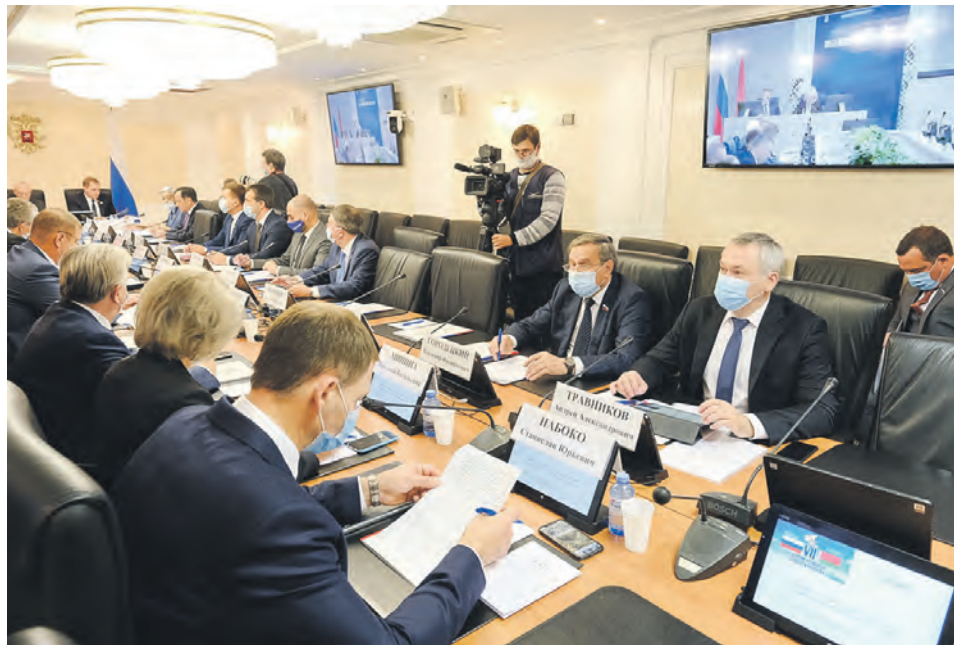
Делегация Новосибирской области традиционно, с 2014 года, принимает участие в работе Форумов России и Беларуси.

Белорусская промышленность использует материалы и комплектующие российских партнёров. Россия является крупным потребителем белорусской пассажирской, сельскохозяйственной и дорожной техники. Республика Беларусь активно создаёт в регионах РФ центры по продаже и сервисному обслуживанию этой техники.