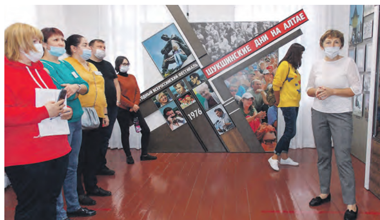
Всероссийский мемориальный музей-заповедник В. М. Шукшина в Сростках.

В Смотрите фоторепортаж «Алтай как космос» на сайте ведомостинсо.рф