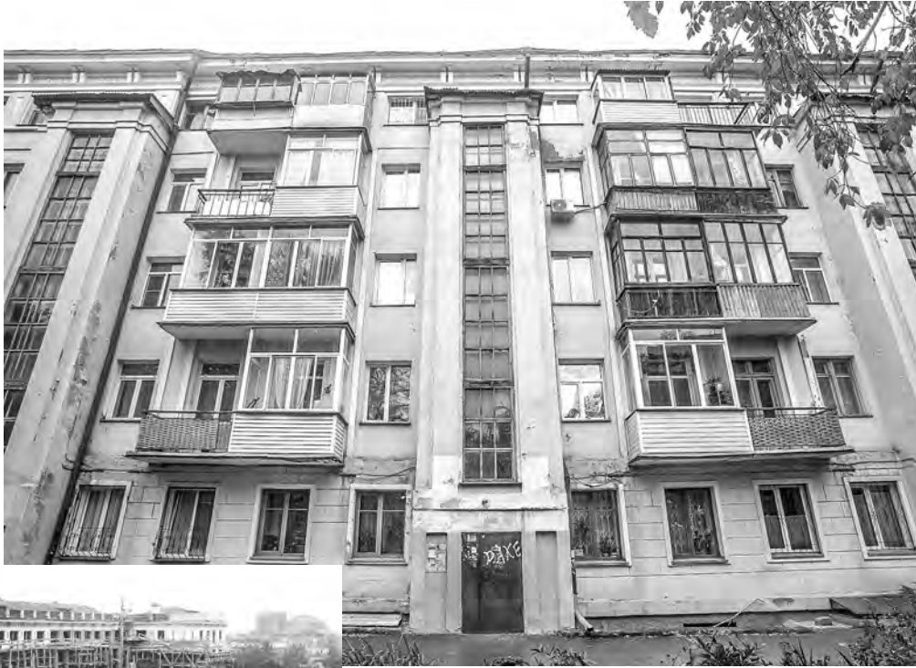
Совершить путешествие во времени вам поможет Дом артистов на улице Романова. Достаточно заглянуть в его аутентичные окна, чтобы услышать гул эпохи.