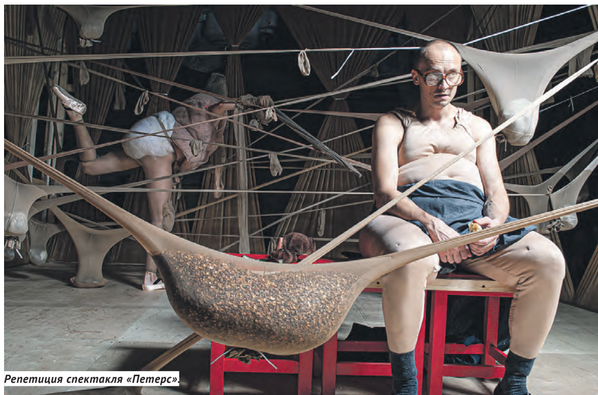
Репетиция спектакля «Петерс»

Следующая премьера состоится 4, 5, 6 декабря — му-