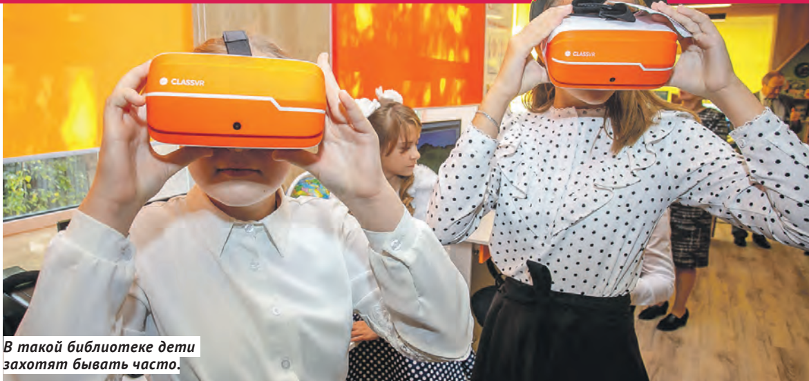
В такой библиотеке дети захотят бывать часто.

Дизайн библиотеки разработали профессиональные архитекторы и дизайнеры. Абонемент «Книжный мир» трансформируется в открытый зал с игровыми зонами, «Интеллект-зал» вместит основное хранение книг, а в «Ландже» с бесплатным Wi-Fi появ-