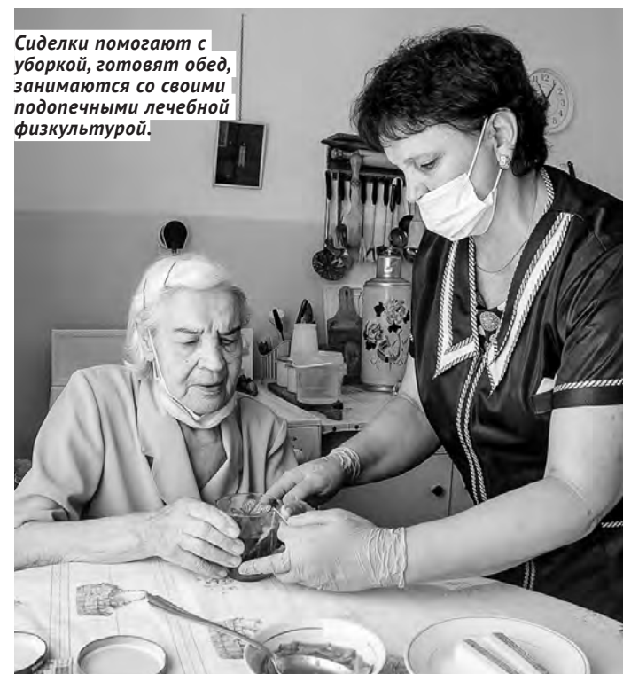
Сиделки помогают с уборкой, готовят обед, занимаются со своими подопечными лечебной физкультурой.

В 2020 году для эффективной работы службы сиделок обучены более 500 помощников по уходу, услугами которых уже воспользовались около 1 000 человек. На базе комплексных центров социального обслуживания населения функционируют отделения дневного пребывания, где квалифицированные специалисты осуществляют временный присмотр за пожилыми людьми и инвалидами. Организована работа школ ухода и патронажных служб, в которых члены семей, где проживают нуждающиеся в помощи пожилые люди, осваивают методы и формы ухода в домашних условиях. Продолжается работа по комплектации районов области специализированными автомобилями для перевозки маломобильных граждан. До конца года все мобильные бригады муниципальных районов и городских округов пополнят свои автопарки новыми транспортными средствами, позволяющими доставить жителей отдалённых районов в медицинские учреждения: в ноябре закупят 41 автомобиль на сумму 85 млн рублей. Расширяется сеть пунктов проката технических средств реабилитации: около 600 человек с начала года воспользовались этой услугой.