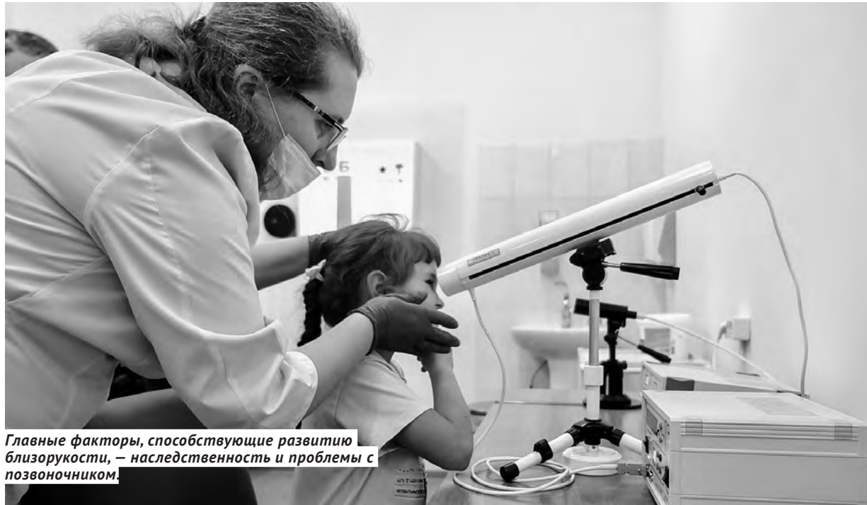
Главные факторы, способствующие развитию близорукости, — наследственность и проблемы с позвоночником.

Технический прогресс, ускоряющийся темп жизни, новые технологии — это не только плюсы для жизни, но и минусы. Платим мы, в том числе, и здоровьем, причём, как говорится, с младых ногтей. Если 25–30 лет назад в средне-статистическом школьном классе было максимум 2–3 очкарика, то сегодня уже к концу начальной школы там может быть до трети ребятшек с проблемами зрения.