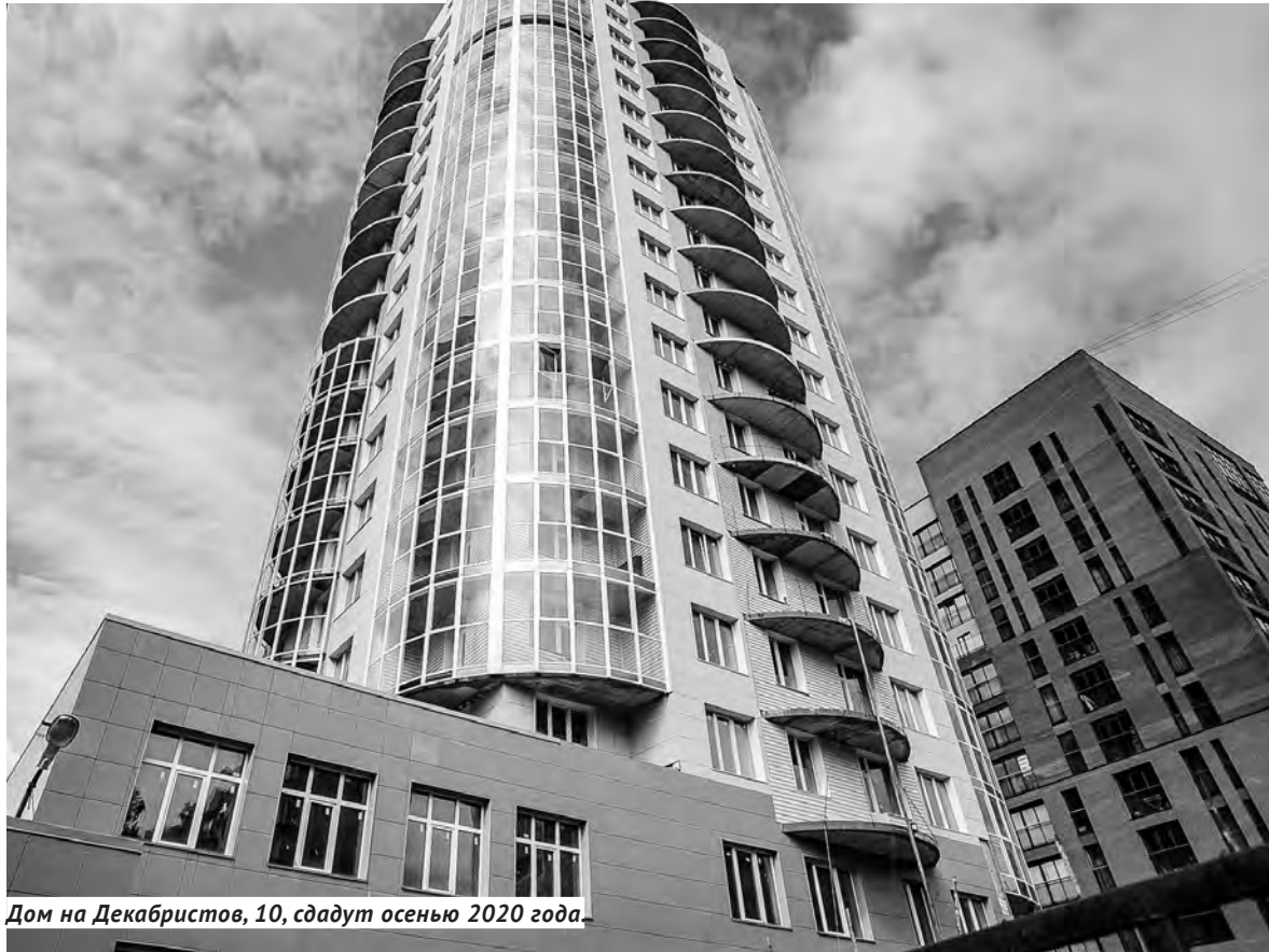
Дом на Декабристов, 10, сдадут осенью 2020 года.

Ранее средства на достройку дома собрали и жильцы — по 7 тысяч рублей с квадратного метра, это обязательное условие для получения господдержки, отметил замминистра.