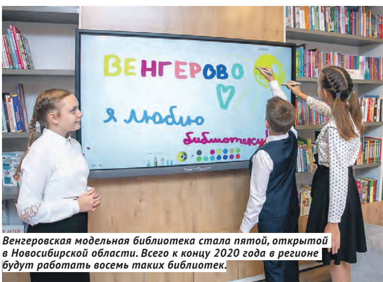
Венгеровская модельная библиотека стала пятой, открытой в Новосибирской области. Всего к концу 2020 года в регионе будут работать восемь таких библиотек.