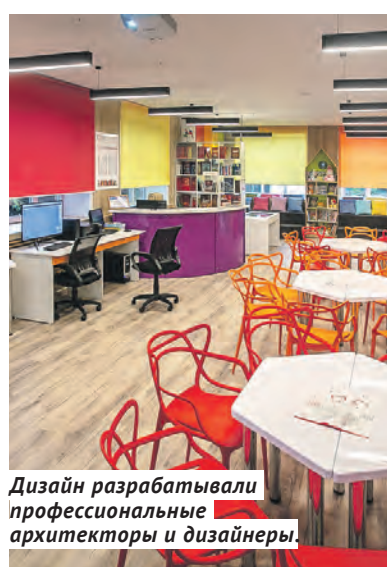
Дизайн разрабатывали профессиональные архитекторы и дизайнеры.