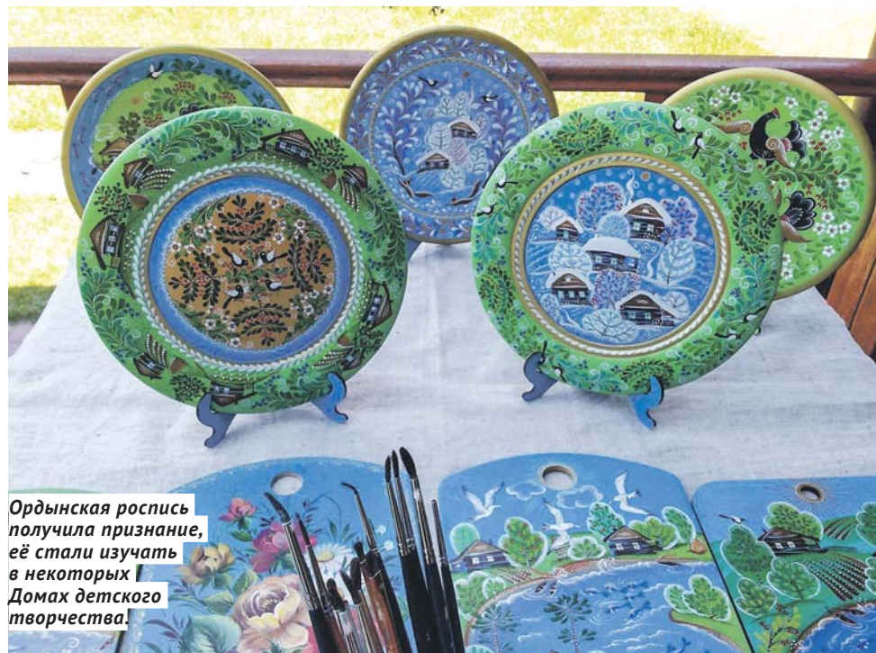
Ордынская роспись получила признание, её стали изучать в некоторых Домах детского творчества!

В солидной московской комиссии роспись проверяли три месяца на заимствование элементов, ничего похожего не выявили и выдали в 2002 году авторское свидетельство