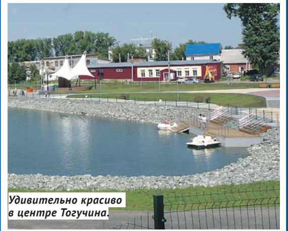
Удивительно красиво в центре Тогучина.

В планах администраций Тогучинского района и города Тогучина — отремонтировать и расширить мост, который соединит набережную, железнодорожный вокзал и остановку автобусов, чтобы объект был полностью закончен.