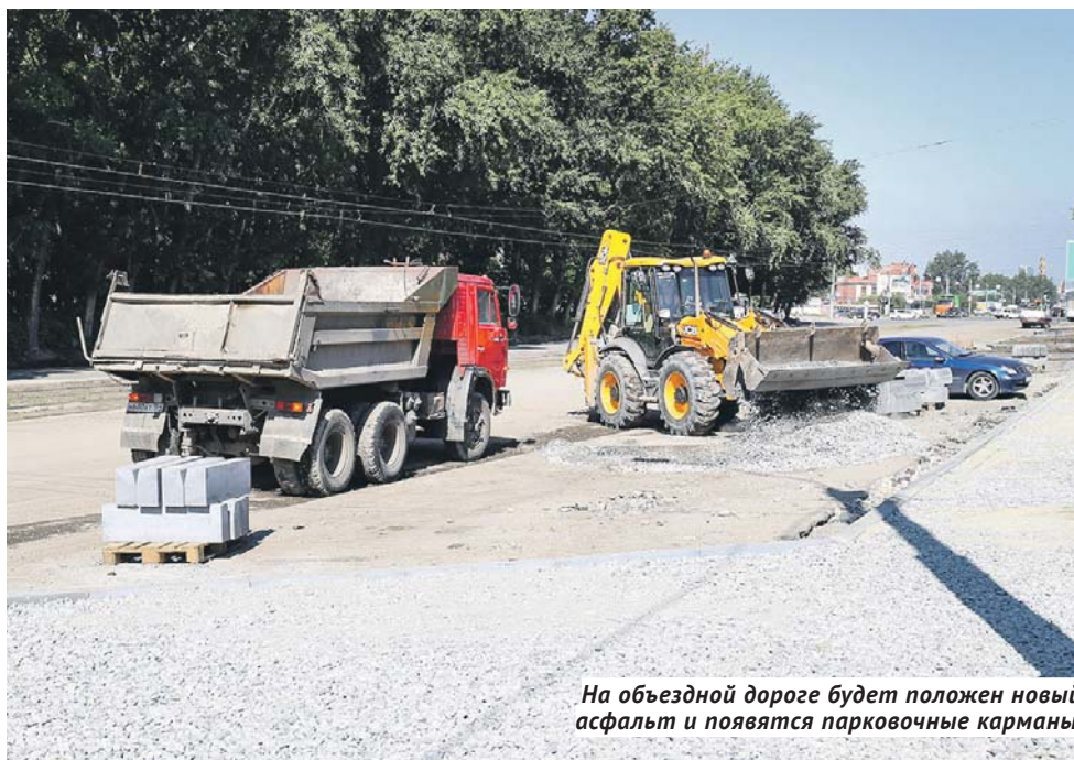
На объездной дороге будет положен новый асфальт и появятся парковочные карманы.

Уже к сентябрю этого года здесь будет новый асфальт, по две полосы движения в каждую сторону, парковочные карманы, разворотные полукольца, пешеходные тротуары, ливневая канализация — всё по самым высоким современным стандартам дорожного строительства.