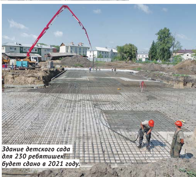
Здание детского сада для 230 ребятишек будет сдано в 2021 году.