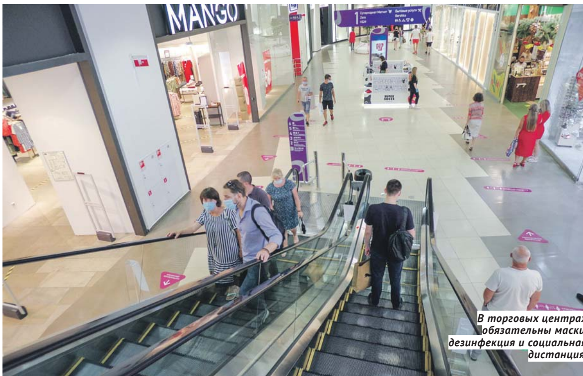
В торговых центрах обязательны маски, дезинфекция и социальная дистанция.

Позатпное снятие ограничений в условиях распространения коронавирусной инфекции на территории региона проводится в соответствии с методическими рекомендациями Роспотребнадзора и с учётом региональной эпидемиологической обстановки.