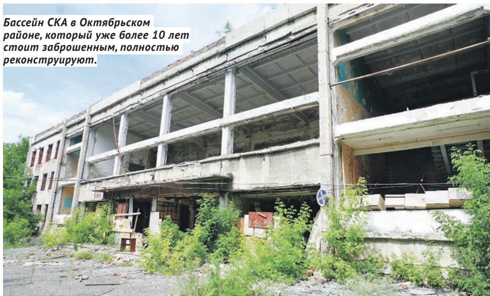
Бассейн СКА в Октябрьском районе, который уже более 10 лет стоит заброшенным, полностью реконструируют.

В 2022-м в Новосибирске должен открыться и второй в городе полноразмерный 50-метровый бассейн. Это будет не новое строительство, а глубокая реконструкция бассейна СКА в Октябрьском районе, который уже более 10 лет стоит заброшенным. Сейчас завершается подготовка проектно-сметной документации, а к концу этого года должен начаться этап строительных работ.