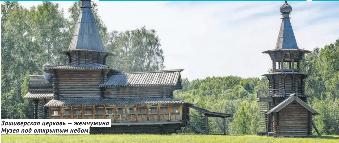
Зашиверская церковь — жемчужина Музея под открытым небом.