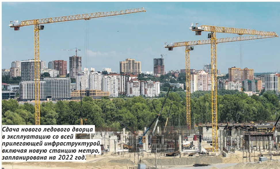
Сдача нового ледового дворца в эксплуатацию со всей прилегающей инфраструктурой, включая новую станцию метро, запланирована на 2022 год.

— Эта арена станет второй по вместимости после ЛДС «Сибирь», но самой современной и технологичной, своеобразным трансформером, — отметил министр. — Уверен, что многие федерации захотят проводить здесь свои соревнования, и мы сделаем всё возможное, чтобы региональный центр волейбола был задействован по максимуму — как по тренировкам, так и соревнованиям.