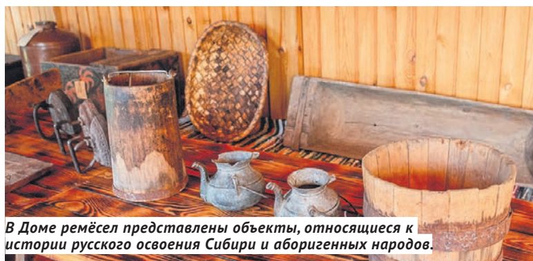
В Доме ремёсел представлены объекты, относящиеся к истории русского освоения Сибири и аборигенных народов.

В 2014 году провели деликатную, незначительную выборочную реставрацию чешуйчатого покрытия главок — лемехов, а также работы по огне- и биозащите. Зашиверская экспедиция обнаружила и три колокола, возможно принадлежавших Спасской церкви. Два из них находятся в экспозиции Музея истории и культуры народов Сибири и Дальнего Востока ИАЭТ СО РАН. В ближайших планах института — оживление пространства музея звуком. После снятия ограничений, связанных