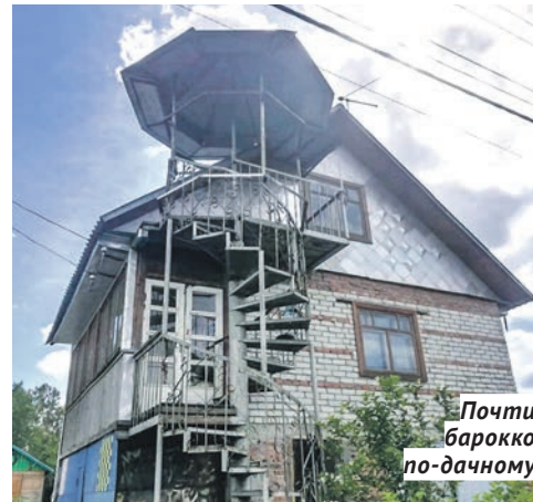
Почти барокко по-дачному

можно было так затеряться — никто из взрослых не найдёт, пусть хоть заукуются. Мой дедушка купил эту дачу, когда мне было два года. Я на ней, можно сказать, выросла. И да, это была дача только для отдыха, потому что под соснами принципиально ничего не росло и не зрело. Парочка круглых клумб с анютиными глазками и маргаритками, одна крошечная грядка, на которой кое-как пробивался чахлый укроп, и ещё две, где дичала посаженная прежними хозяевами клубника. И это всё. Никто ничего не полон, никто ничего не окучивал, никто не сажал и не собирал урожай. Здесь просто жили. Зато какие весёлые гости приезжали по выходным, как долго сидели за накрытым столом на улице по вечерам, как было уютно в этом маленьком круге света, когда становилось темно и вокруг лампочки собиралась мелкая ночная живность. А как по утрам заливались птицы... Это было лучшее место на Земле».