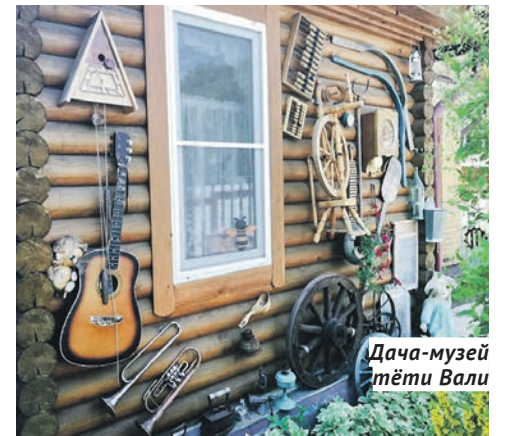
Дача-музей тёти Вали

— С возрастом начинаешь ценить вещи, с которыми у тебя связаны воспоминания, — уверена дачница. — Я очень бережно к ним отношусь.