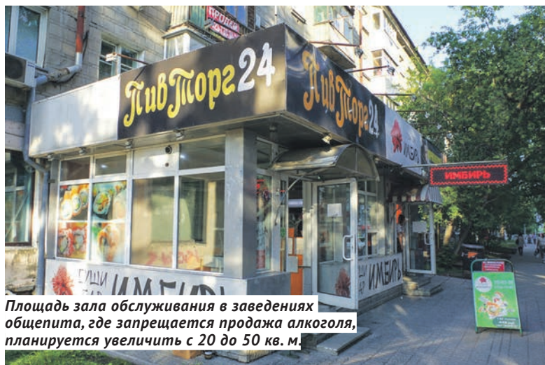
Площадь зала обслуживания в заведениях общепита, где запрещается продажа алкоголя, планируется увеличить с 20 до 50 кв. м.

Н ебольшой участок улицы на Акатуйском жилмассиве в Кировском районе Новосибирска местные жители прозвали пивным проспектом: на 23 многоэтажных дома здесь расположено 26 магазинчиков, торгующих «пенным». В среднем больше одной точки на дом, а в 17-этажке на улице Виктора Уса, вмещающей в себя 1 135 маленьких квартир и студий, сразу 4 разливные и ещё несколько