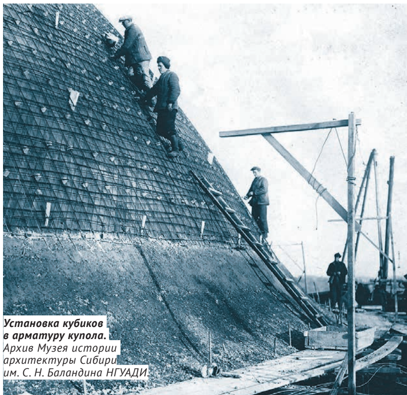
Установка кубиков в арматуру купола.

Более 230 документов, собранных в электронной библиотеке, рассказывают об истории строительства здания и творческом пути коллектива театра. В коллекцию включены фотографии, эскизы, архивные материалы, книги, фильмы и интервью, а также статьи из периодических изданий, в том числе и об открытии театра в газетах «Советская Сибирь» и «Советское искусство». «В электронной коллекции собраны документы из самых разных мест хранения. Они предоставляют воз-