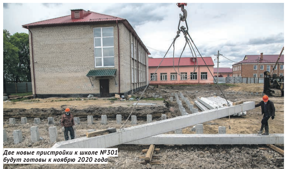
Две новые пристройки к школе №301 будут готовы к ноябрю 2020 года.

Если шайдуровцам до исполнения их мечты придётся подождать примерно полтора года, то в Сузунской средней школе №301 имени Героя Советского Союза Василия Левина процесс обновления уже