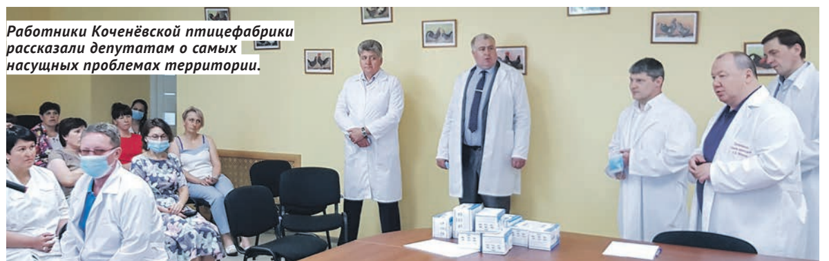
Работники Коченёвской птицефабрики рассказали депутатам о самых насущных проблемах территории.