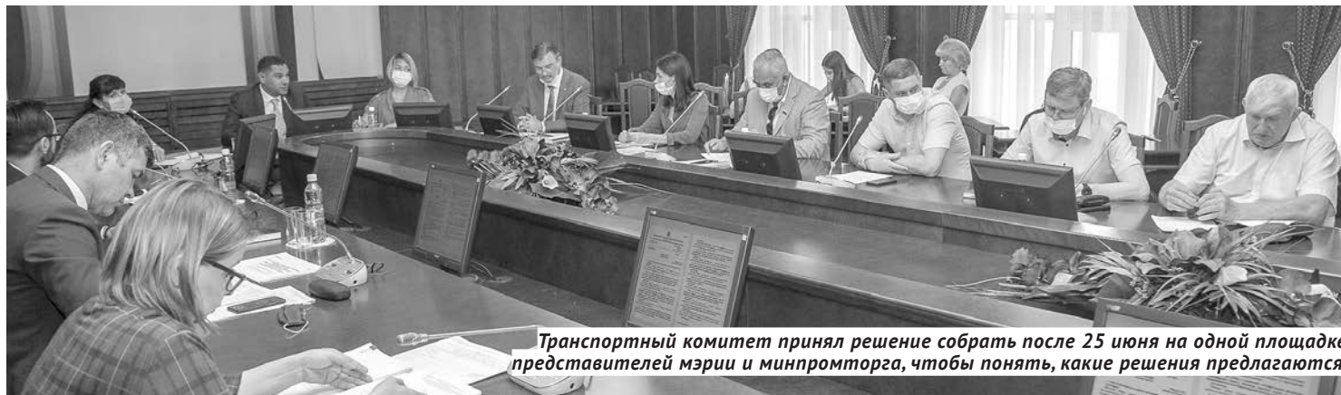
Транспортный комитет принял решение собрать после 25 июня на одной площадке представителей мэрии и минпромторга, чтобы понять, какие решения предлагаются.

Крупные спортивные соревнования мирового масштаба — не только события, ценные сами по себе, но и большой плюс для городов, в которых они проходят. Яркие примеры тому — олимпийский Сочи, а также города, в которых проходили игры чемпионата мира по футболу 2018 года. Новые дороги, парки, обновлённые здания — на красивую «обёртку» у нас в стране привыкли тратить не меньше, чем на самую «конфету» в виде спортивного события. Увы, когда начинаются большие кампании, то всегда неизбежны перегибы на местах. В Москве, например, в том числе и под шумок подготовки к ЧМ-2018, полностью избавились от уличных ларьков, и уже несколько лет в столице невозможно купить какой-нибудь фастфуд, водичку и прочую мелочь, гуляя по улице. Нечто подобное, в рамках подготовки к молодёжному чемпионату мира по хоккею 2023 года, задумали и власти Новосибирска. Убрать все объекты малоформатной торговли с остановок общественного транспорта, так как там должны появиться «умные» остановки — с системой видеонаблюдения, бесплатным