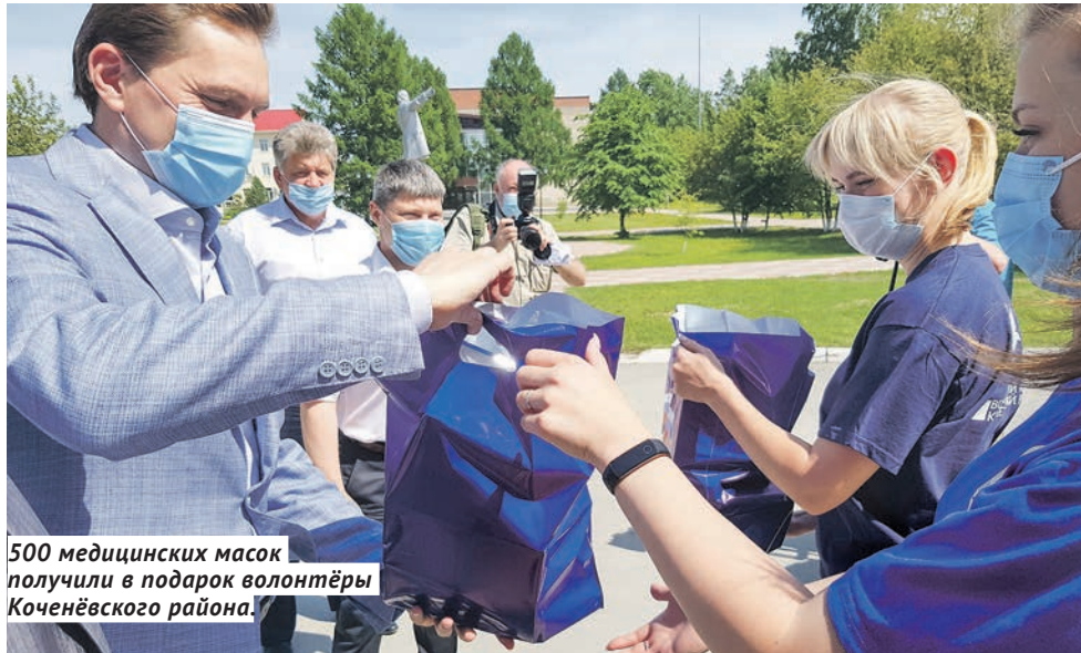
500 медицинских масок получили в подарок волонтеры Коченёвского района.

— Решили 500 штук отдать волонтерам Коченёвского района — и для них са-