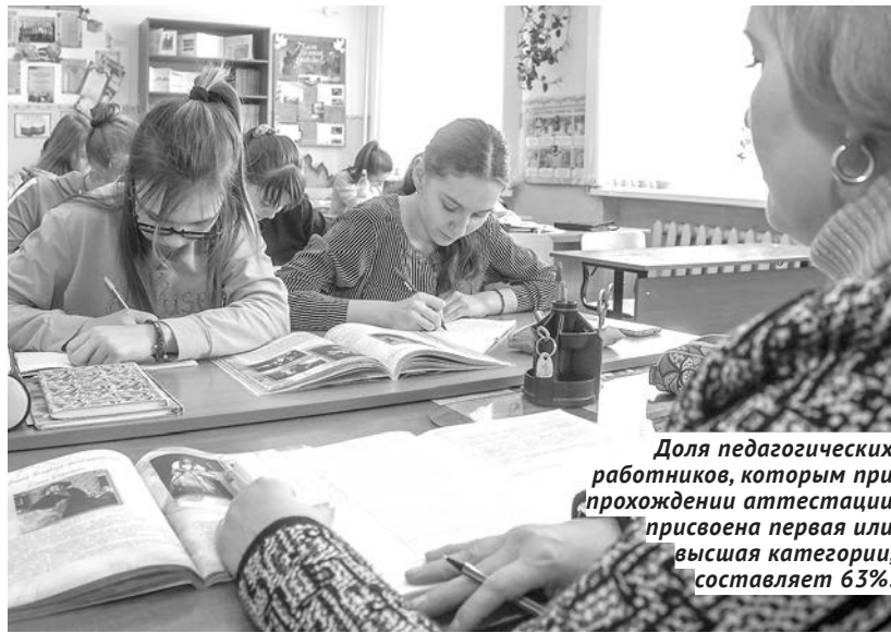
Доля педагогических работников, которым при прохождении аттестации присвоена первая или высшая категории, составляет 63%.