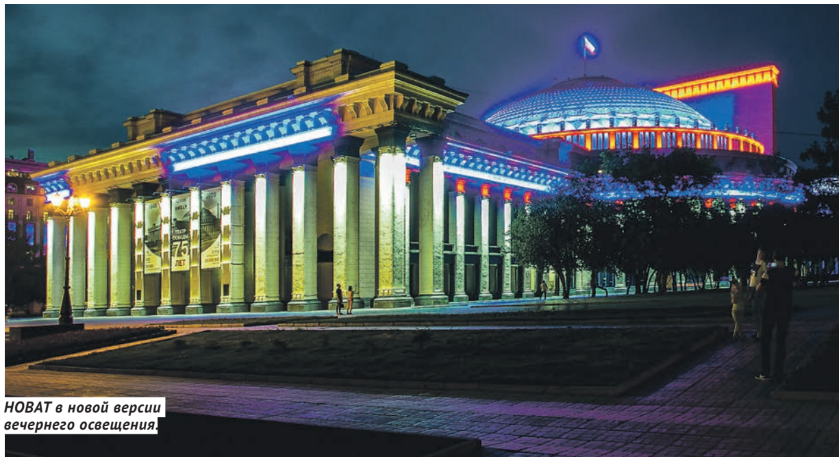
НОВАТ в новой версии вечернего освещения.

НАСЛЕДИЕ Уникальные фотографии, документы и видео по истории НОВАТа собраны в электронной коллекции.