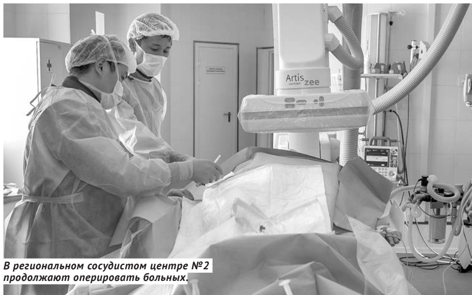
В региональном сосудистом центре №2 продолжают оперировать больных.

— Мы встроили маршрутизацию по оказанию помощи пациентам с учётом