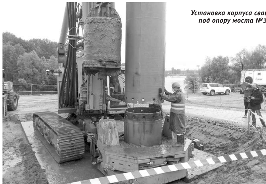
Установка корпуса сваи под опору моста №3.