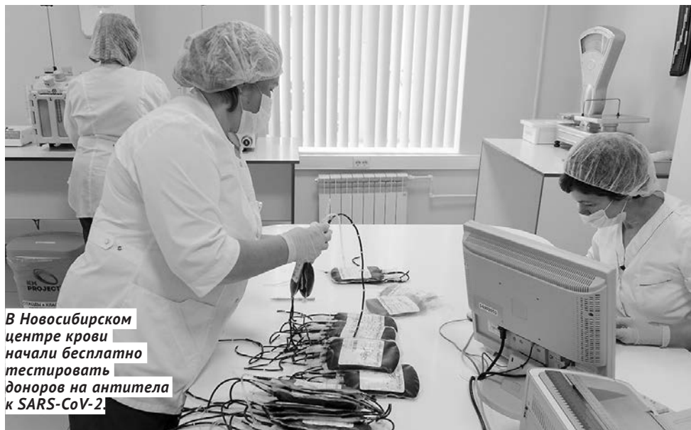
В Новосибирском центре крови начали бесплатно тестировать доноров на антитела к SARS-CoV-2.