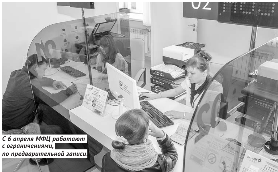
С 6 апреля МФЦ работают с ограничениями, по предварительной записи.

Спору нет, портал госуслуг — штука удобная. Около 650 различных услуг практически в любой сфере жизни, в том числе 250 региональных и около 80 муниципальных. Даже штрафы и различные пошли-