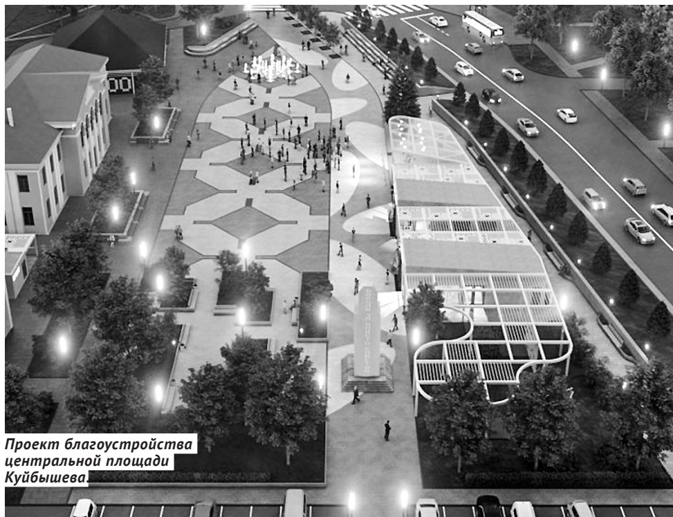
Проект благоустройства центральной площади Куйбышева.