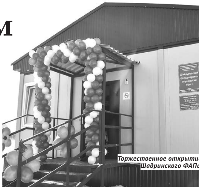
Торжественное открытие Шадринского ФАПа.

Кроме того, в 2020 году начнётся строительство фельдшерско-акушерских пунктов в с. Чулым, п. Степной, д. Китерня, с. Куликовское, п. Майский, ауле Кошуль, с. Таган, с. Золотая Грива, с. Береговое, д. Мальково. Ввод в эксплуатацию этих ФАПов запланирован в следующем году.