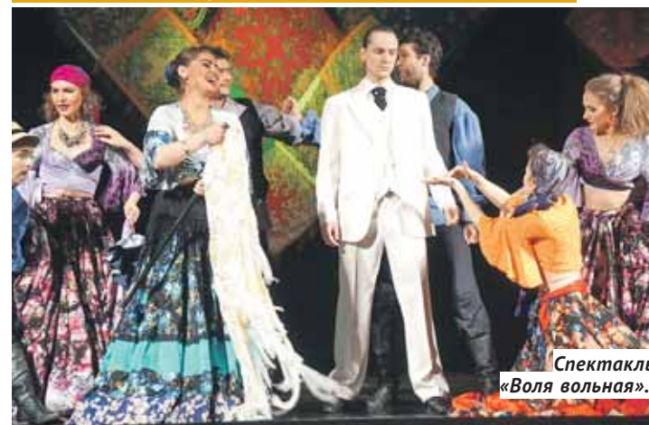
Спектакль «Воля вольная».

ГАСТРОЛИ 9–11 марта на сцене «Красного факела» состоится показы спектаклей московского Театра неслышащих актёров «Недослов», вход свободный.