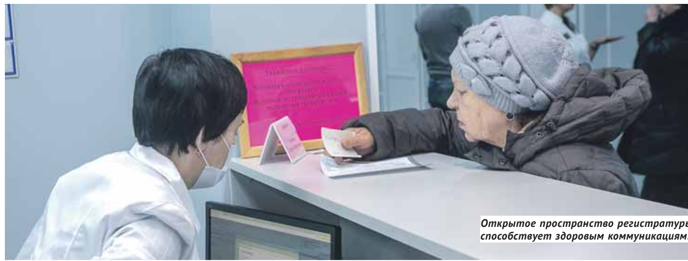
Открытое пространство регистратуры способствует здоровым коммуникациям.

В регионе успешно реализуется проект «Бережливая поликлиника».