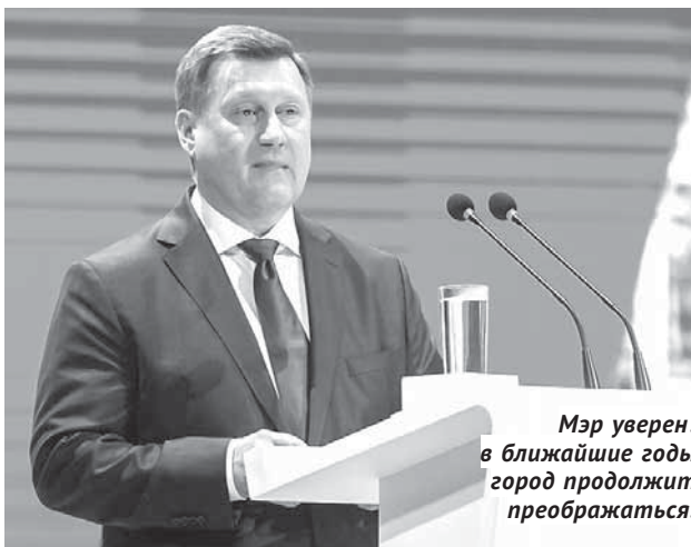
Мэр уверен: в ближайшие годы город продолжит преобразовываться.