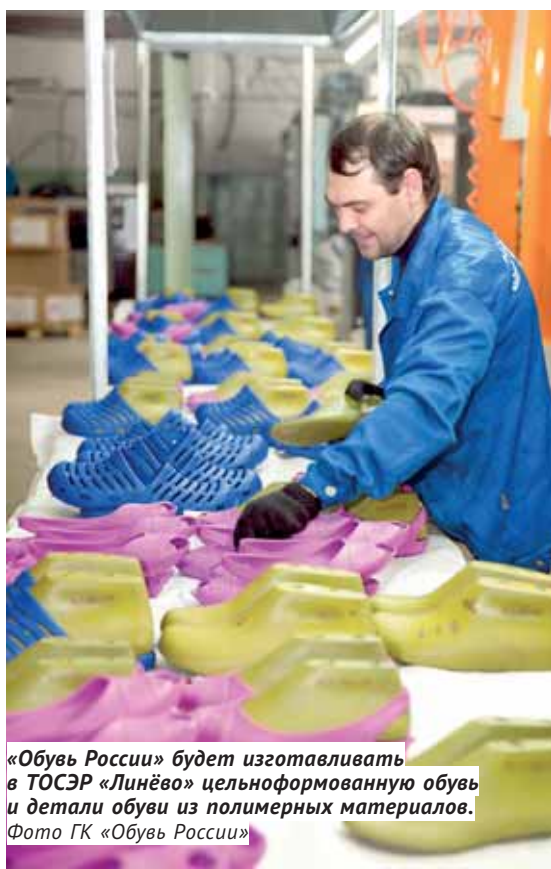
«Обувь России» будет изготавливать в ТОСЭР «Линёво» цельноформованную обувь и детали обуви из полимерных материалов.