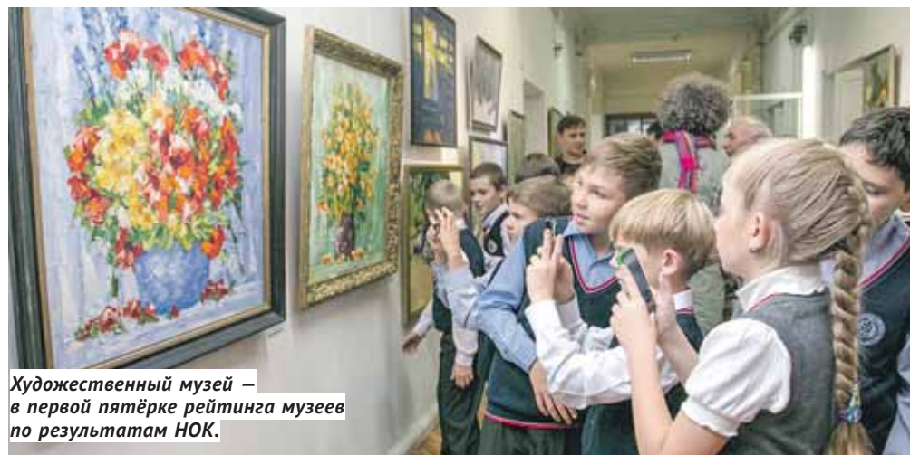
Художественный музей – в первой пятёрке рейтинга музеев по результатам НОК.

Самый высокий уровень по интегральным значениям занимают критерии доброжелательность, вежливость, компетентность работников организации культуры, и удовлетворённость условиями оказания услуг. Оно и понятно, эти критерии не требуют больших