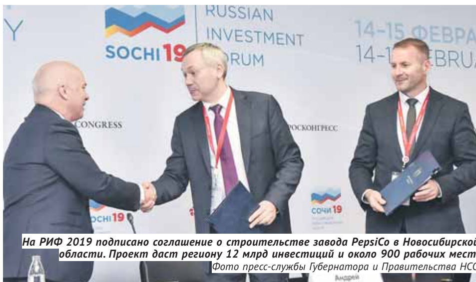
На РИФ 2019 подписано соглашение о строительстве завода PepsiCo в Новосибирской области. Проект даст региону 12 млрд инвестиций и около 900 рабочих мест.

«Мы изучали возможности трёх сибирских регионов. Но подход управляю-