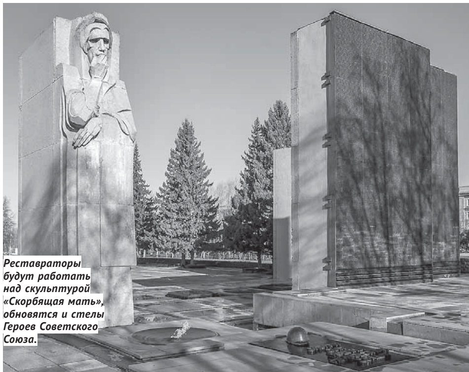
Реставраторы будут работать над скульптурой «Скорбящая мать», обновят и стелы Героев Советского Союза.

Самым главным объектом масштабной реставрации станет в этом году Мемориал Славы — комплекс в честь подвига сибиряков в годы Великой Отечественной войны. Бригады реставраторов будут работать над самой скульптурой «Скорбящая мать», очистят пилоны, подлатают мозаичные и