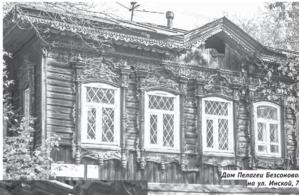
Дом Пелагеи Безонойной на ул. Инской, 7.

По замыслу создателей проекта, «Новониколаевские кварталы» на улице Инской соединятся с набережной двумя надземными переходами-мостами и станут логичным продолжением парка «Городское начало», дополняя его недостающей инфраструктурой. Предпосылки для организации исторического квартала уже есть: в границах улицы Инской сосредоточены четыре памятника истории и архитектуры начала XX века, к 125-летию Новосибирска завершится реставрация конторы инженера Г. М. Будагова на Большевикской, 7, рядом восстанавливается дом