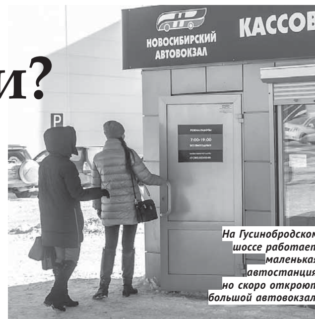
На Гусинобродском шоссе работает маленькая автостанция, но скоро откроют большой автовокзал.

Сейчас неподалёку от Гусинобродской автостанции уже возведён и скоро будет запущен в эксплуатацию большой автовокзал: два этажа, 1 600 «квадратов» площади, суточный объём пассажирских перевозок до 6 000 человек. Это частные инвестиции автовокзала, в сотрудничестве с мэрией Новосибирска. Главная цель — не только создать транспортно-пересадочные узлы на периферии города, активизировав развитие в этих районах транспортной сети, но и со временем окончательно вывести автовокзал из центра города. «Построить несколько автовокзалов на въездах в Новосибирск с разных сторон и в конечном итоге перестать эксплуатировать транспортный узел на Красном проспекте. Нет смысла ехать туда крупным автобусам, а потом выбираться оттуда по пробкам», — эти слова принадлежат градоначальнику Анатолию Локтю . Но если первая задача вполне логична и решаемая, то полностью избавиться от автовокзала в центре вряд ли удастся. По словам Сергея Ермакова, в европейских городах, на чей опыт мы так часто ссылаемся, есть пересадочные станции на выездах, но главный автовокзал всё равно находится в центре. Да и вряд ли сотня-полторы автобусов, приезжающих и уезжающих в те-