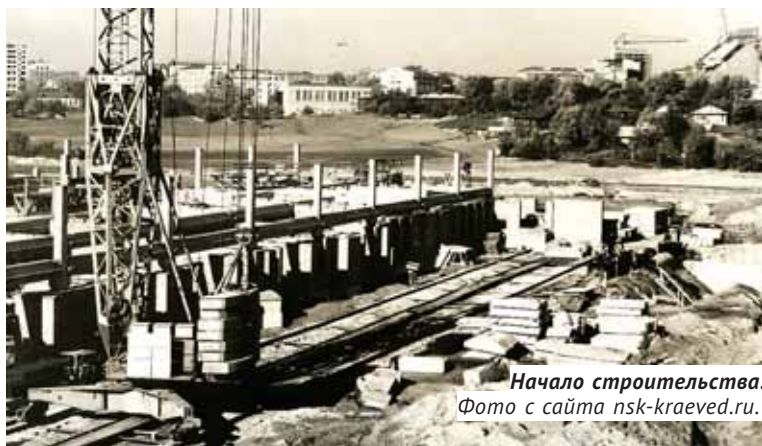
Начало строительства.

Проектированием комплекса зданий с гаражом под автохозяйство занимался Сибирский зональный научно-исследовательский и проектный институт (СИБЗНИИЭП), тогда ведущий проектный институт Сибири и структурное подразделение Госстроя России. По проекту этого же института на другой стороне Каменки с боль-