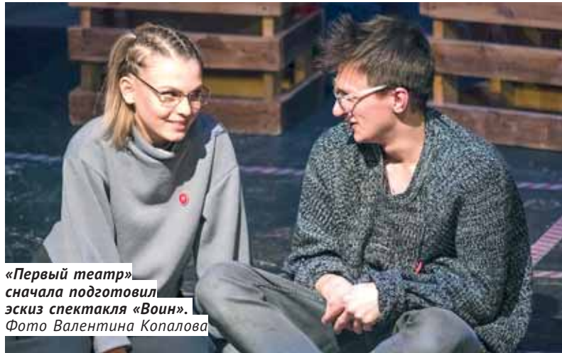
«Первый театр» сначала подготовил эскиз спектакля «Воин».