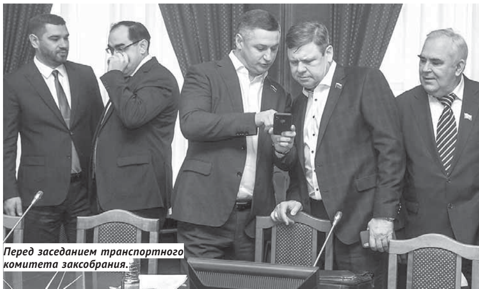
Перед заседанием транспортного комитета заксобрания.

П роjekt организации единого платного парковочного пространства будет реализовываться в три этапа. Территория правобережья Новосибирска будет поделена на семь зон, на которых к концу 2019 года будет размещено около 10 тысяч платных мест. Такой радужной виделась городским властям перспектива платных парковок всего полтора-два года назад. По факту мы сегодня имеем две платные плоскостные парковки напротив главного ж/д вокзала (152 машиноместа), парковку на 136 мест возле Центрального рынка, небольшой платный паркинг на ул. Орджоникидзе, 186, и к марту откроются ещё две небольшие парковки: на Красном проспекте, 59 (пересечение с ул. Крылова), на 43 места и возле ДК «Прогресс» на 32 места.