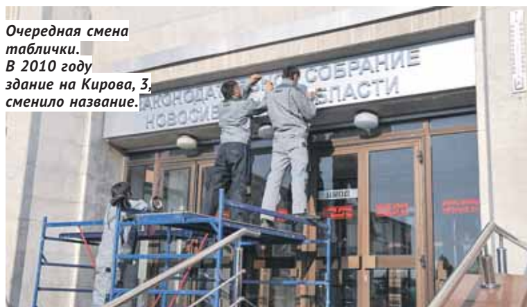
Очередная смена таблички. В 2010 году здание на Кирова, 3, сменило название.

пользовались самые современные материалы, благодаря чему здание и сейчас практически не требует ремонта, за исключением фасадов. Константин Боков, ныне президент СРО Ассоциации «Новосибирские строители», пришёл на это строительство мастером в 1977 году, уже шёл монтаж здания, подняли три этажа.