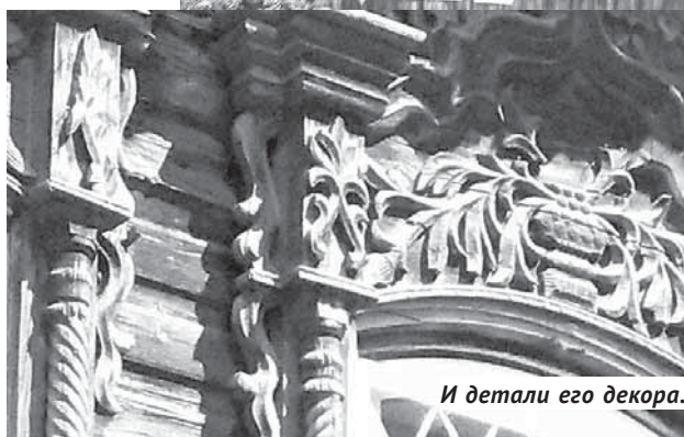
И детали его декора.