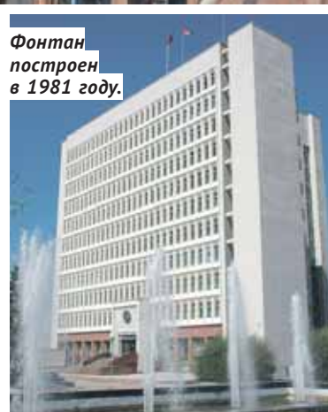
Фонтан построен в 1981 году.

Марина ШАБАНОВА