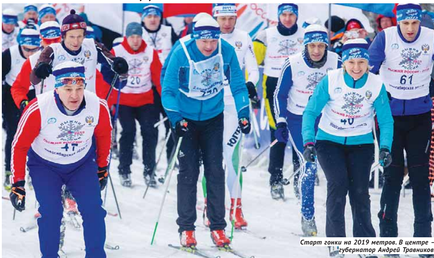
Старт гонки на 2019 метров. В центре — губернатор Андрей Травников.

«Лыжня России-2019» в Новосибирской области отмечена рекордом по количеству участников.