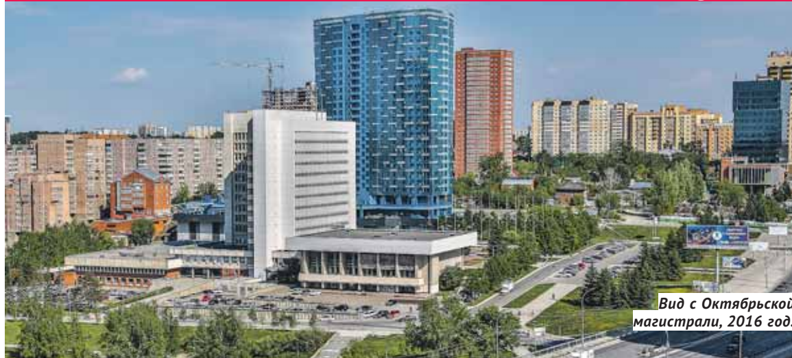
Вид с Октябрьской магистрали, 2016 год.

Существует миф, согласно которому не было бы станции метро «Октябрьская», если бы ни эта стройка. Дескать, подземка протянулась бы к самому началу Красного проспекта и прошла через автовокзал, принимавший народные толпы с баулами и чемоданами. На самом деле планы по продолжению центра города в Октябрьском районе вынашивались ещё в 1930-е годы. Однако продвинуться в этом направлении смогли только в 1960-е, когда было принято решение о строительстве нового здания для Новосибирского обкома КПСС, располагавшегося тогда на Красном проспекте, 5, сегодня здесь хранится региональное собрание картин — Художественный музей. Место выбрали на высоком берегу бывшей речки Каменки, где раскинулся частный сектор, в непосредственной близости от Чёртова городища, старинного поселения татар.