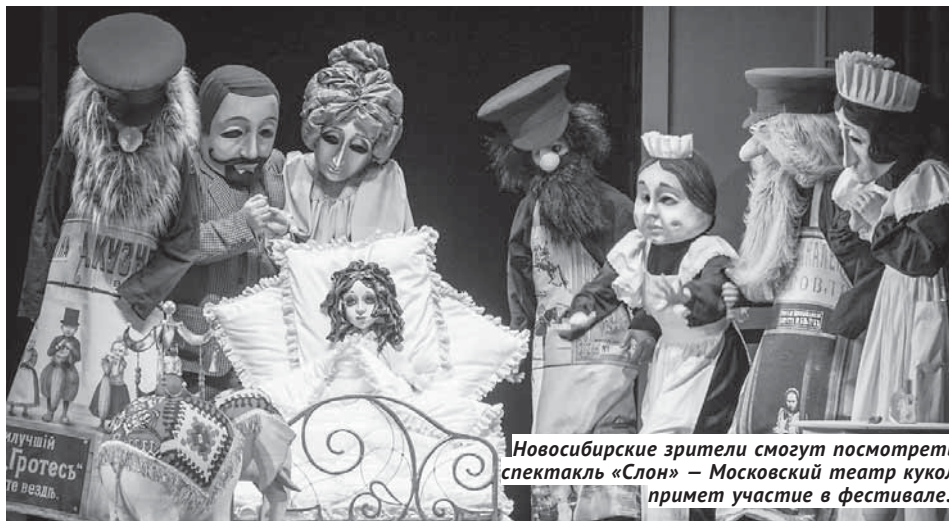
Новосибирские зрители смогут посмотреть спектакль «Слон» — Московский театр кукол примет участие в фестивале.