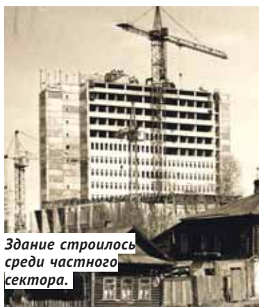
Здание строилось среди частного сектора.