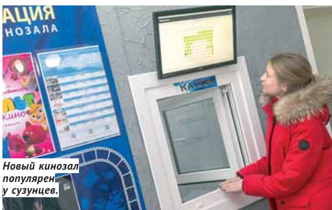
Новый кинозал популярен у сузунцев.