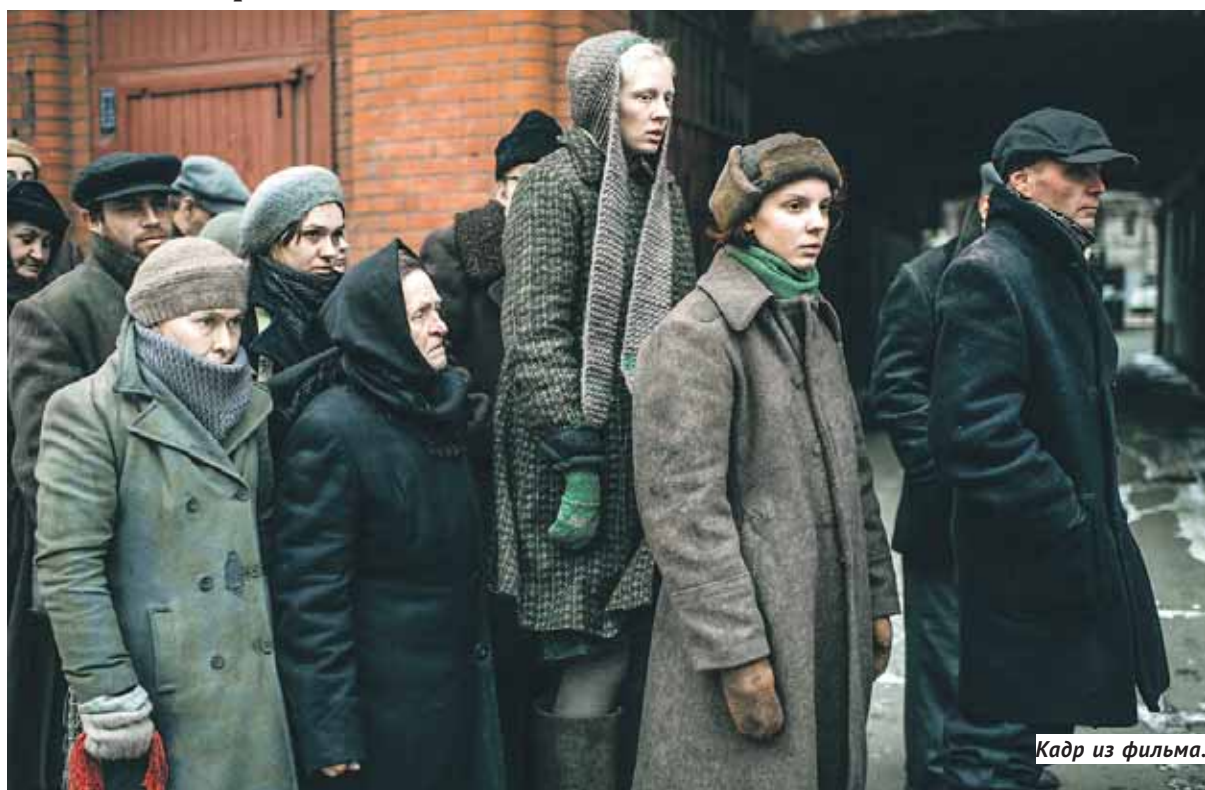
Кадр из фильма.

Триумфатор «Канн» Кантемир Балагов представил в «Победе» свой новый фильм.