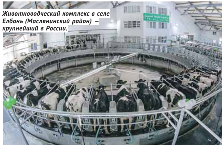
Животноводческий комплекс в селе Елбань (Маслянинский район) — крупнейший в России.

Андрей Травников напомнил, что в марте 2019 года была утверждена новая Стратегия социально-экономического развития Новосибирской области до 2030 года, которая, в том числе, включает в себя «инвестиционный портфель» из 51 проекта на 137 миллиардов, а также инфраструктурный план, состоящий из 74 проектов суммарно на 371 миллиард рублей. Их реализация будет являться одним из ключевых показателей эффективности Стратегии. Травников подчеркнул, что привлечение инвестиций остаётся ключевым направлением работы губернатора и Правительства Новосибирской области, однако — это не самоцель.