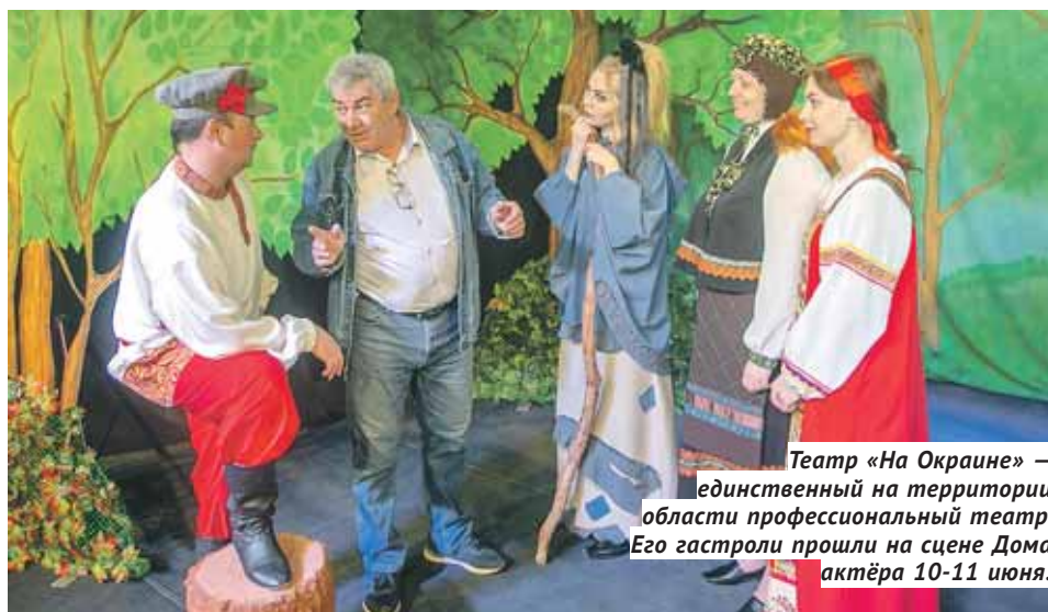
Театр «На Окраине» — единственный на территории области профессиональный театр. Его гастроли прошли на сцене Дома актёра 10-11 июня.