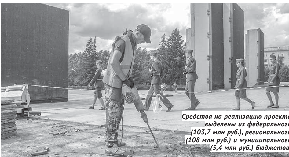
Средства на реализацию проекта выделены из федерального (103,7 млн руб.), регионального (108 млн руб.) и муниципального (5,4 млн руб.) бюджетов.

ной поездкой посетили губернатор Новосибирской области Андрей Травников , председатель Законодательного собрания Андрей Шимкив и первый заместитель председателя областного парламента Андрей Панфёров , мэр Новосибирска Анатолий Локоть и секретарь генерального совета партии «Единая Россия» Андрей Турчак . Последний отметил, что у него нет сомнений, что все работы будут выполнены