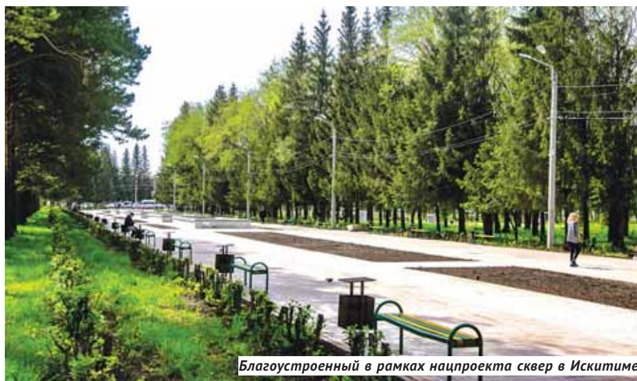
Благоустроенный в рамках нацпроекта сквер в Искитиме

Такие проверки объектов благоустройства стартовали ещё в мае этого