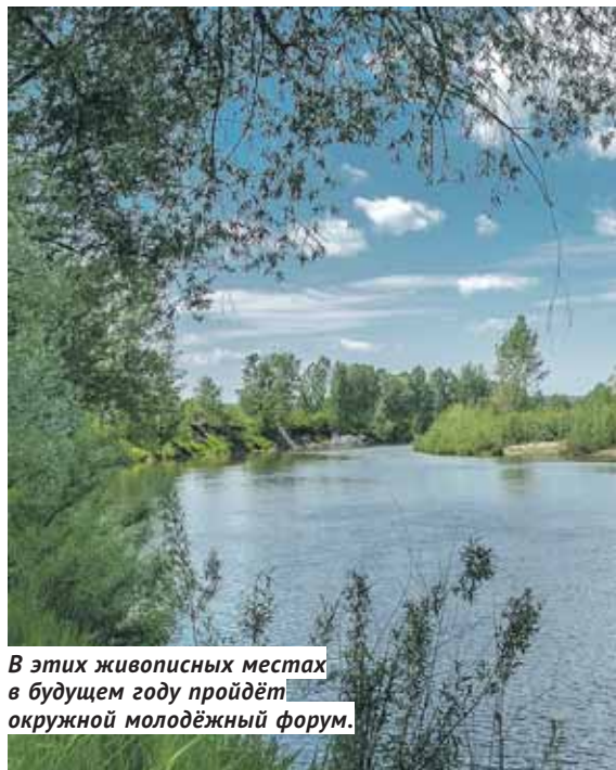
В этих живописных местах в будущем году пройдёт окружной молодёжный форум.

Очевидное конкурентное преимущество Маслянинского района — огромный природный и туристический потенциал. На одной из красивейших территорий области можно найти возможности для разнообразного активного отдыха: горные лыжи и сноуборд, пешие походы по предгорьям Салаира и сплавы по Берди. Очередной точкой роста на туристической карте района станет эко-парк «Хомутина», где летом 2020 года состоится окружной молодёжный форум «Сибирь здесь».