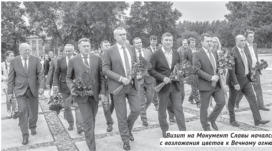
Визит на Монумент Славы начался с возложения цветов к Вечному огню.

Практически сразу после начала реконструкции памятник и сквер с инспекцион-