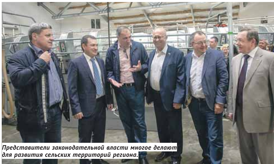
Представители законодательной власти многое делают для развития сельских территорий региона.

За несколько километров до въезда в районный центр растёт и ширится масштабное строительство. И хотя общий объём работ выполнен примерно на 10%, уже очевидно, что возводится один из крупнейших промышленных объектов в истории Новосибирской области. Это молочный завод ООО «Сибирская академия молочных наук» с проектной мощностью переработки до 1 150 тонн сутки. Площадь предприятия составит 18 гектаров, будет создано около 400 новых рабочих мест. Открытие планируется в третьем квартале 2020 года.