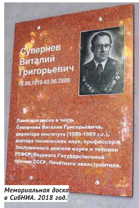
Мемориальная доска в СибНИА. 2018 год.

Авторы: Барсук В. Е. и Серьёзов А. Н. Фотографии из архива СибНИА им. С. А. Чаплыгина.*