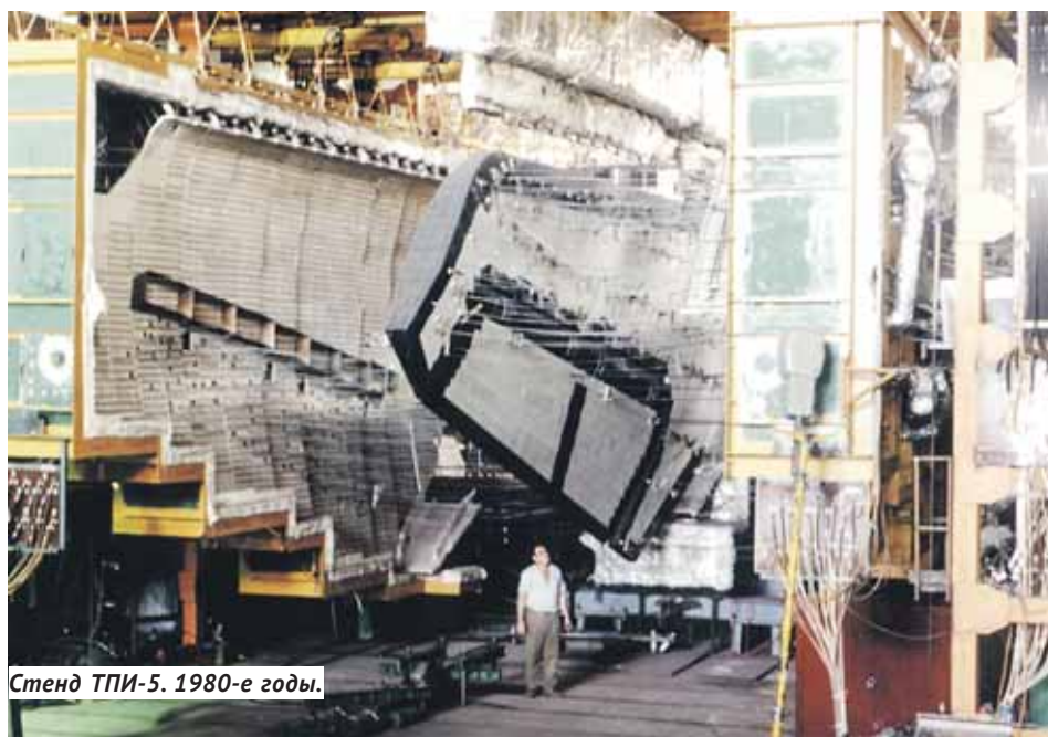
Стенд ТПИ-5. 1980-е годы.