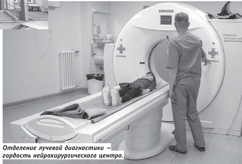
Отделение лучевой диагностики — гордость нейрохирургического центра.

— Особенная нагрузка — у отделения лучевой диагностики, — главный врач ведёт «экскурсантов» в отделение, где стоит гул от охлаждающей томографы системы. — В год мы проводим около 8 тысяч процедур магнитно-резонансной томографии. Не буду врать, что томографы у нас