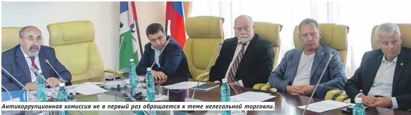
Антикоррупционная комиссия не в первый раз обращается к теме нелегальной торговли.

Ещё одна новация, которая могла бы помочь очистить город от нелегальных