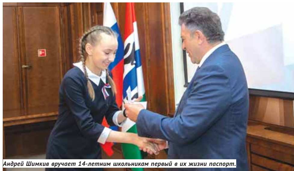
Андрей Шимкив вручает 14-летним школьникам первый в их жизни паспорт.

Спортсмены, музыканты, художники, конструкторы, школьные активисты — каждый из ребят, получивших паспорта, уже сейчас занимает активную жизненную позицию, развивается в выбранном