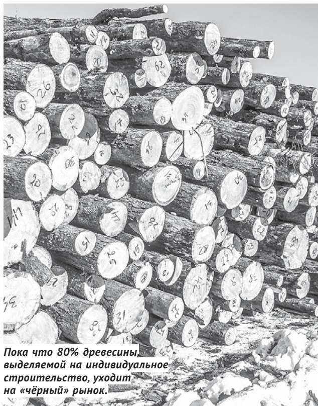
Пока что 80% древесины, выделяемой на индивидуальное строительство, уходит на «чёрный» рынок.

Одним из ключевых положений Закона Новосибирской области о порядке и нормативах заготовки гражданами древесины для собственных нужд до сих пор является возможность для граждан получать раз в 10 лет определённое количество древесины для строительства или ремонта индивидуального жилья и хозяйственных построек по доступной цене — порядка 150 рублей за кубометр. Однако анализ, проведённый министерством природных ресурсов и экологии Новосибирской области, показал, что до 80% древесины, которая должна отпускаться на эти цели, в итоге уходит на чёрный рынок и служит лишь средством обогащения узкой группы лиц. Министр Андрей Даниленко отметил, что контролировать целевое использование этой древесины практически невозможно, поэтому обратился к депутатам аграрного комитета заксобрания с предложением... отменить эту норму вовсе. Получив в ответ вполне ожидаемую реакцию.