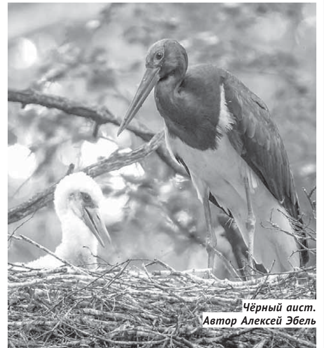
Чёрный аист. Автор Алексей Эбель