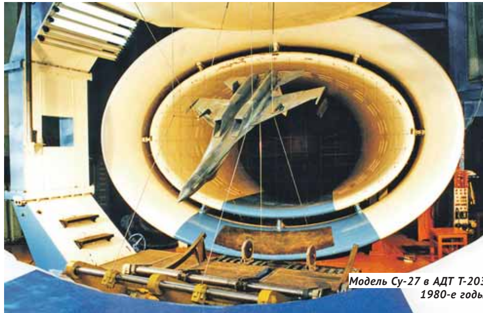
Модель Су-27 в АДТ Т-203. 1980-е годы.

Спортсмены института участвовали в соревнованиях союзного и международного уровней, особенно большое внимание уделялось «родным» видам спорта: авиамодельному, планерному, дельта- и мотодельтапланерному. Авиамоделисты под руководством тренера сборной команды Министерства авиационной промышленности и СибНИА