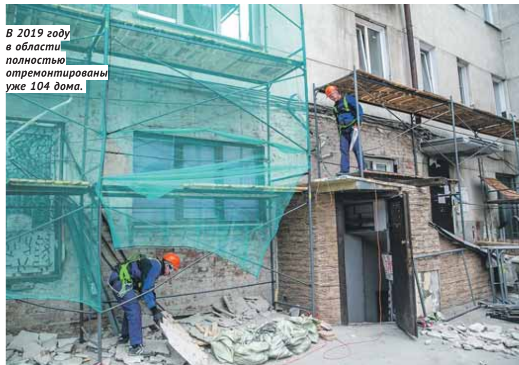
В 2019 году в области полностью отремонтированы уже 104 дома.

В целом региональная программа капремонта, рассчитанная на 2014–2043 годы, включает в себя 12 875 домов. На сегодня отремонтировано 1 974 дома — 15% от общего количества. Из запланированных 92 447 работ выполнено 5 792 — 6,3%. Работы проводились в 143 муниципальных образованиях региона из 289, где они намечены.