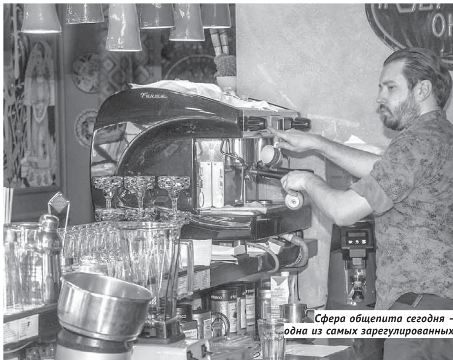
Сфера общепита сегодня — одна из самых зарегулированных.

Предлагается ввести новый подход к классификации норм — сейчас они отталкиваются от требований ведомств, в обновлённой редакции долж-