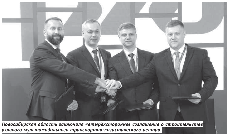
Новосибирская область заключила четырёхстороннее соглашение о строительстве узлового мультимодального транспортно-логистического центра.

Ещё одно соглашение — с группой компаний «Алютех». Оно предполагает строительство на территории Новосибирской области производственно-логи-