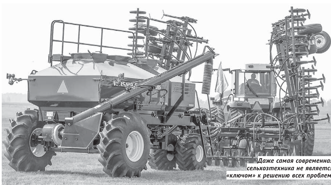
Даже самая современная сельхозтехника не является «ключом» к решению всех проблем.

Решением комитета региональному минсельхозу было поручено разработать проект концеп-