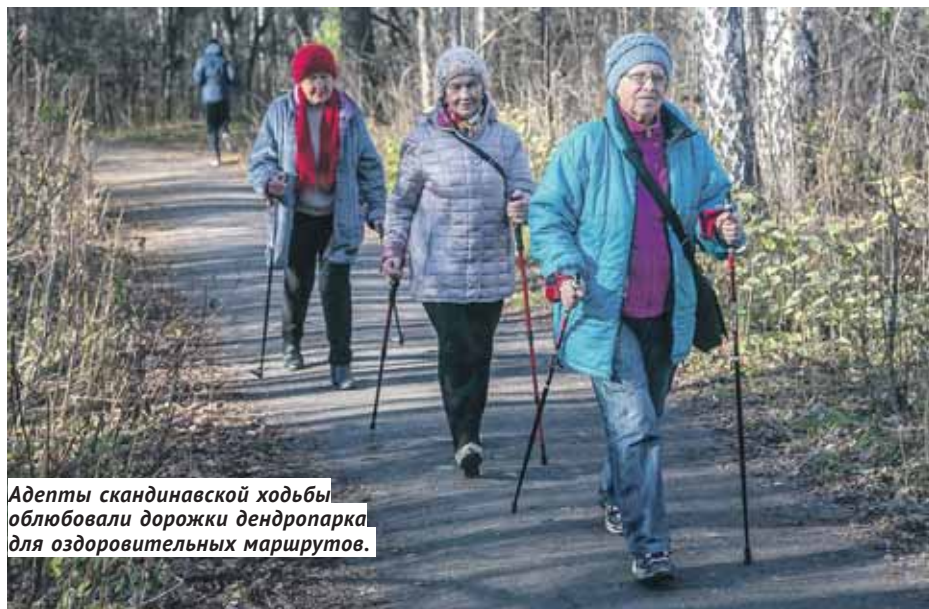
Адепты скандинавской ходьбы облюбовали дорожки дендропарка для оздоровительных маршрутов.