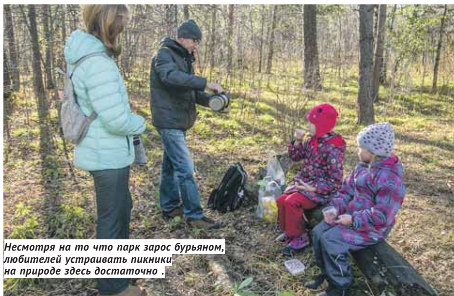
Несмотря на то что парк зарос бурьяном, любителей устраивать пикники на природе здесь достаточно.

тропинки упираются в забор зоопарка, скамеек и беседок не хватает, а дорожки не предназначены для экскурсий — они попросту опасны. «Всё заросло, в том числе и крапивой, а это явный признак деградации», — поясняет специалист.