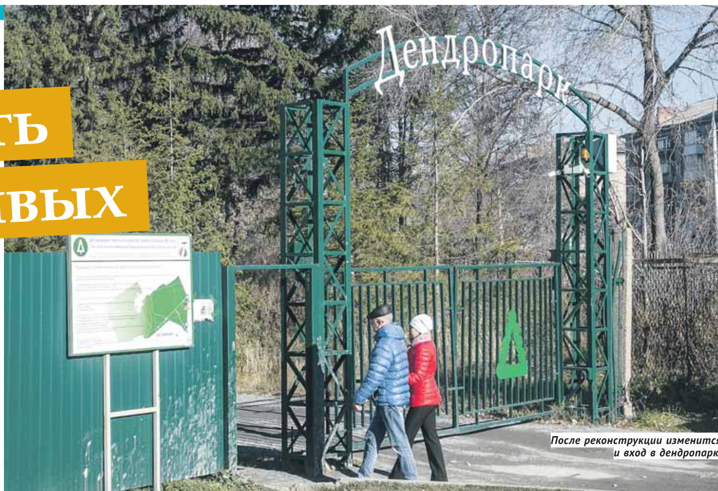
После реконструкции изменится и вход в дендропарк.