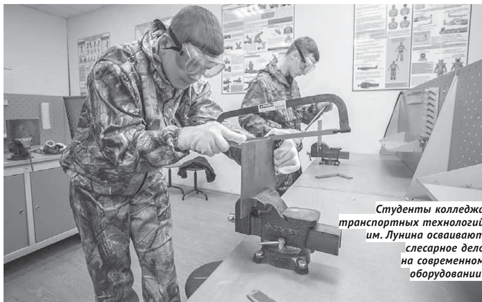
Студенты колледжа транспортных технологий им. Лунина осваивают слесарное дело на современном оборудовании.

ние депутатов. В итоге программа получила на 2018-й и 2019 годы дополнительные 23,3 миллиона рублей за счёт областного бюджета. Из этих средств свыше 15 миллионов направят на увеличение заработной платы работникам профессиональных образовательных организаций, организаций дополнительного профессионального образования и Центра культуры учащейся молодёжи в соответствии с государственным заданием — это требование должно быть выполнено по поручению Президента РФ об обеспечении МРОТ на уровне прожиточного минимума трудоспособного населения. Ещё 5,7 миллиона рублей потратят на укрепление и развитие материально-технической базы учреждений. Программу курировало региональное министерство труда и занятости, после его ликвидации эти функции переданы министерству образования НСО.