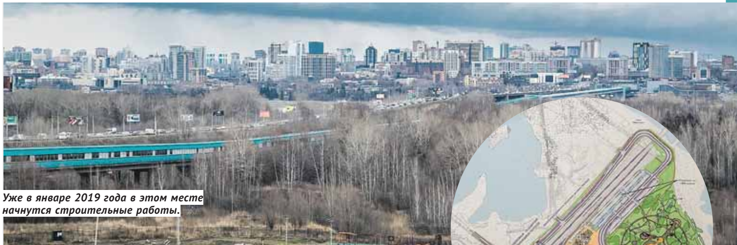
Уже в январе 2019 года в этом месте начнутся строительные работы.

Любое мировое спортивное событие — это не только сами матчи, но прежде всего болельщики. Как россияне из других регионов, так и иностранцы — тот же Третьяк не сомневается, что канадцы точно прилетят, не взирая на расстояния, чтобы болеть за свою молодёжь. И все 10 дней, которые будет проходить турнир, их нужно расселять, кормить, развлекать и оберегать.