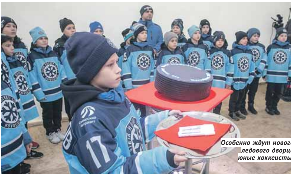
Особенно ждут нового ледового дворца юные хоккеисты.

6,7 млрд руб. общая стоимость нового ледового дворца. По словам Александра Жукова, в федеральном бюджете на 2019—2021 годы уже запланировано финансирование этого объекта в размере 3,5 млрд.