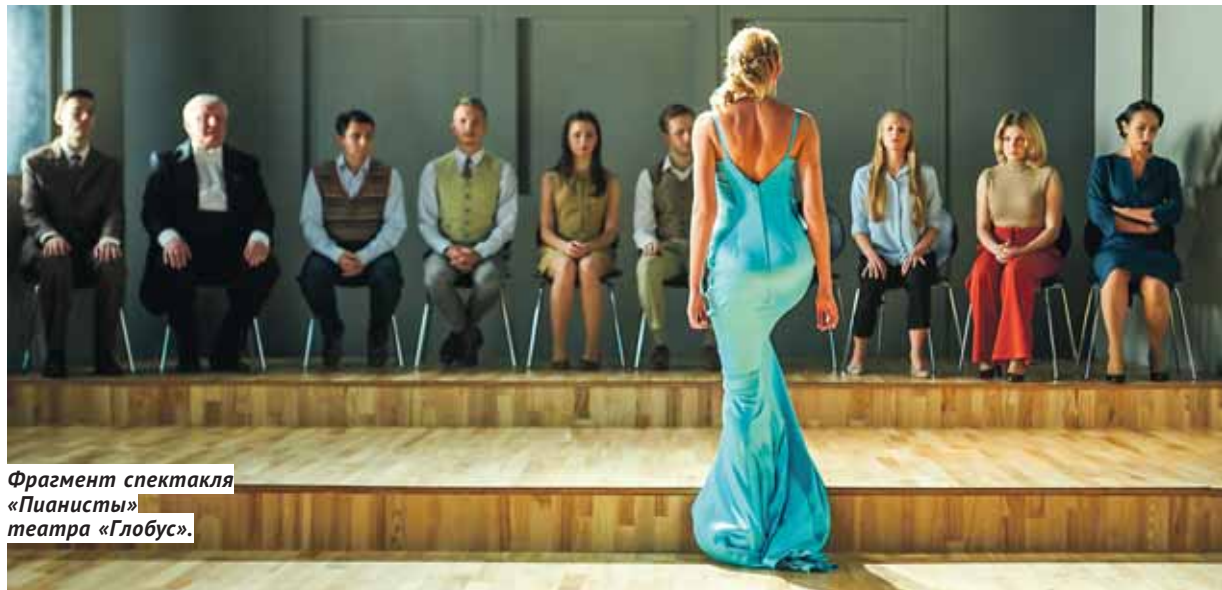
Фрагмент спектакля «Пианисты» театра «Глобус».

«Золотая Маска» объявила номинантов сезона 2017/2018 и сто спектаклей лонг-листа — практически все заявленные новосибирские постановки отмечены экспертами.