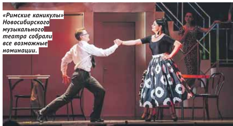
«Римские каникулы» Новосибирского музыкального театра собрали все возможные номинации.

Победителей определяют на Фестивале спектаклей-номинантов, который пройдёт в Москве в марте-апреле будущего года. В 2019-м Российская национальная театральная премия и фестиваль «Золотая Маска» отмечает 25-летие. Церемония вручения премии состоится 16 апреля на Исторической сцене Большого театра.