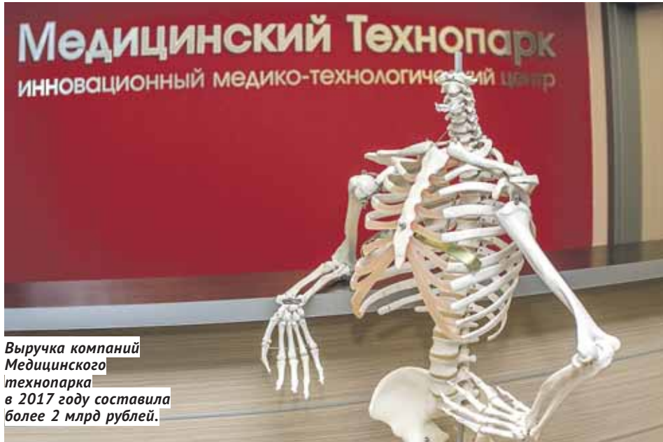
Выручка компаний Медицинского технопарка в 2017 году составила более 2 млрд рублей.

«Региональные чемпионы» станут составной частью флагманского проекта программы реиндустриализации «Умный регион». Его участниками могут стать компании, заработавшие в 2017 году не менее 50 млн рублей, имеющие за последние три года в среднем по году не менее 15% роста, выводящие на рынки новые продукты, доля которых даёт им не менее 25% выручки. В 2019 году предполагается отобрать 5 таких компаний, к 2025 году их число должно возрасти до 11.