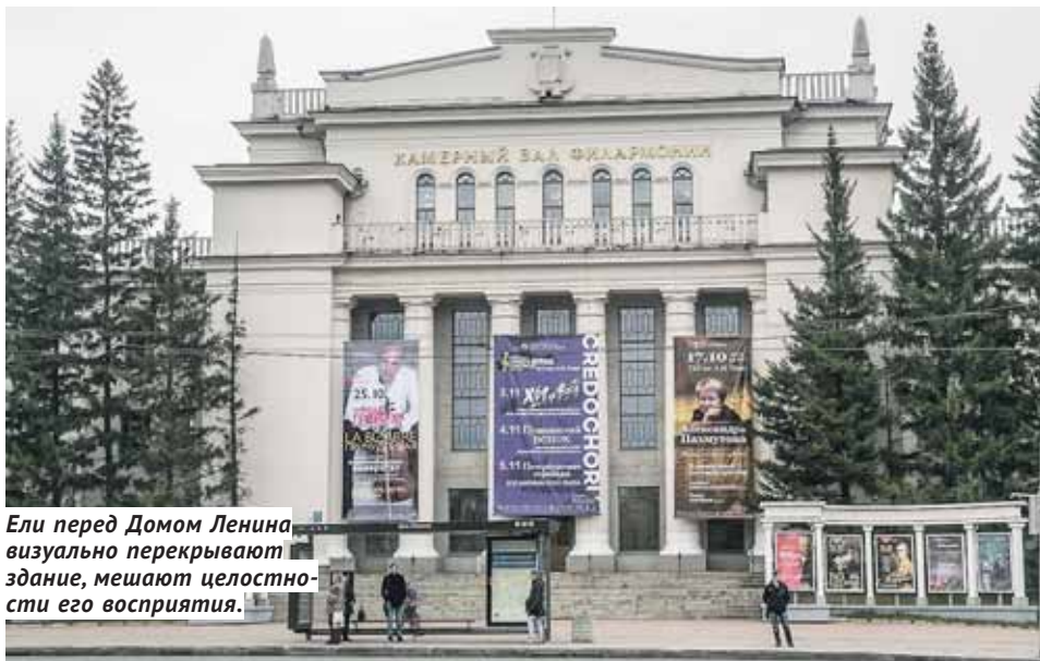
Ели перед Домом Ленина визуально перекрывают здание, мешают целостности его восприятия.