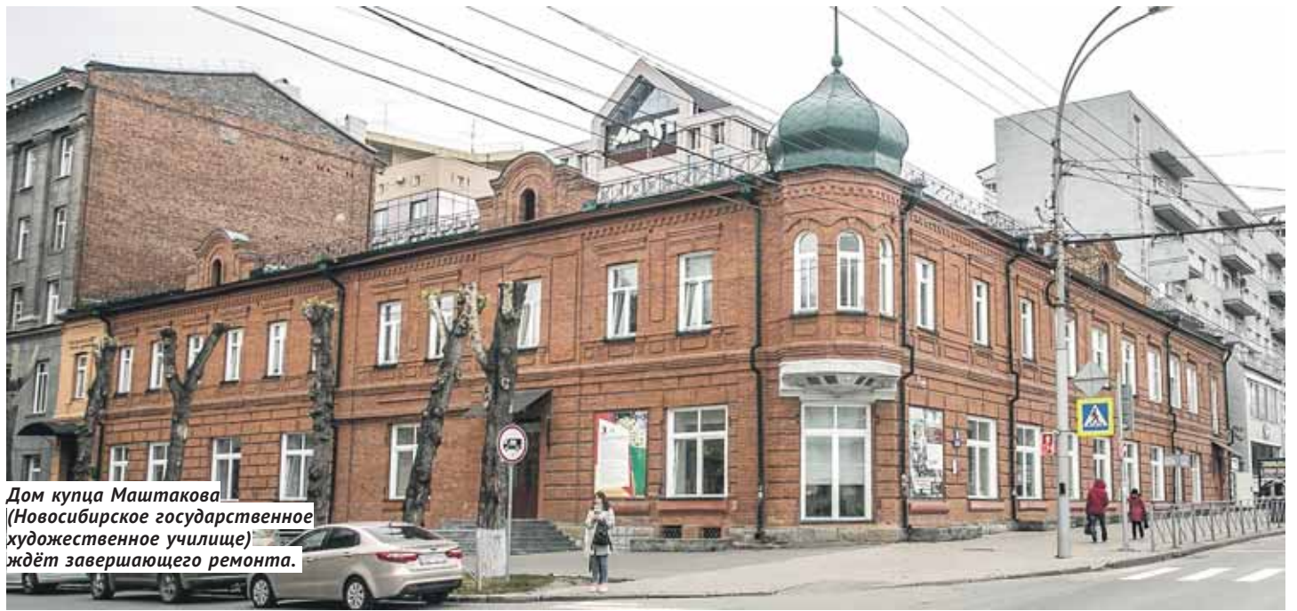
Дом купца Маштакова (Новосибирское государственное художественное училище) ждёт завершающего ремонта.