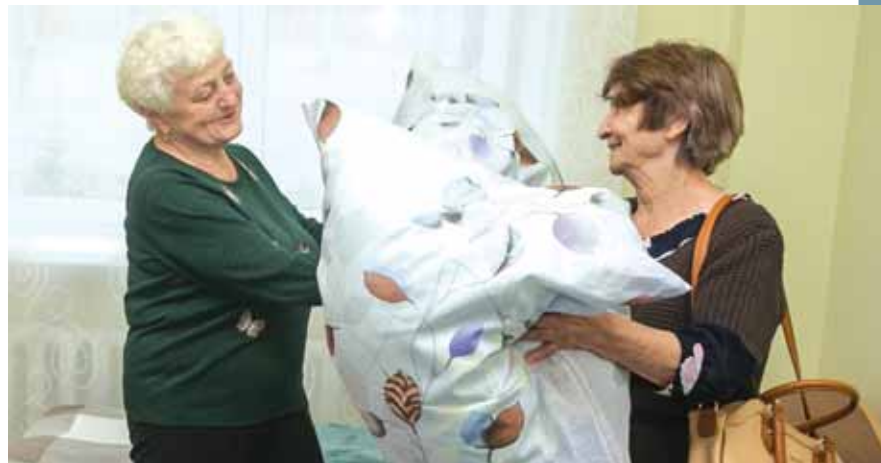
График работы: со 8:00 до 19:00, с понедельника по пятницу. Стоимость одного дня пребывания с учётом пятиразового питания — 715 рублей. Однако, как сказал министр, это лишь базовый тариф, и его цена может корректироваться, например, если пожилой человек относится к льготной категории граждан. В индивидуальном порядке рассматриваются и варианты круглосуточного пребывания.

По словам министра труда и соцразвития области Ярослава Фролова , специально для нового отделения в Доме ветеранов были выделены и отремонтированы помещения, оборудован отдельный вход, обеспечена доступная среда для маломобильных граждан. Здесь есть комнаты для сна и отдыха, столовая, а также помещения для проведения досуга. Отделение рассчитано на 10 мест.