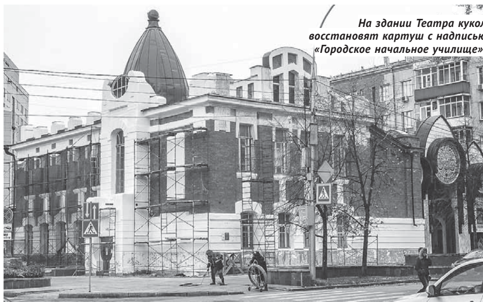
На здании Театра кукол восстанавливают картуш с надписью «Городское начальное училище».

ул. Краскома, 3, где находится культурно-досуговый центр. Для центральной части города большая проблема — отсутствие централизованной ливневой системы. Учтывая, что поднялся и культурный слой, и дорожное полотно, сейчас все эти купеческие здания XIX — начала XX века находятся фактически в ямах, вода точит кирпичную кладку фундамента, разрушает штукатурку. Поэтому проблема стоит очень остро. По словам Александра Кошелева, управление уже выходило с предложением к администрации города. Куйбышевцы сами должны инициировать разработку проектно-сметной документации по устройству ливнёвки в районе Соборной пло-