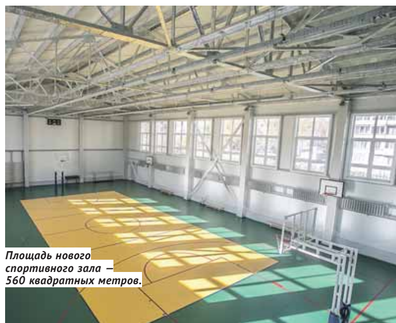
Площадь нового спортивного зала — 560 квадратных метров.