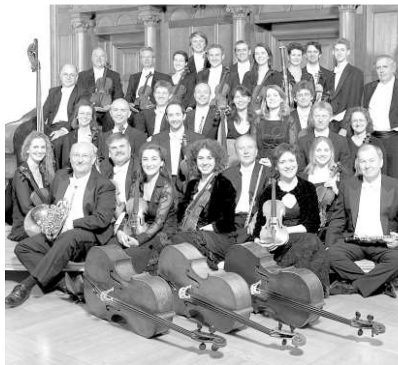
Английский камерный оркестр, в Новосибирск приедет совсем не «камерный» по составу.