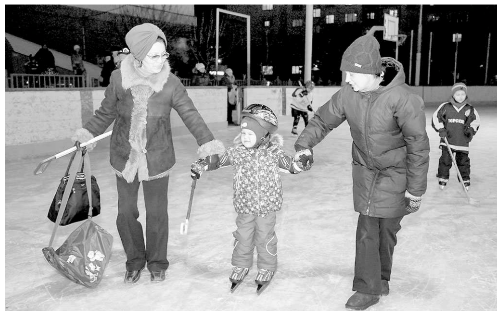
У новосибирцев должна быть возможность покататься на коньках рядом с домом.