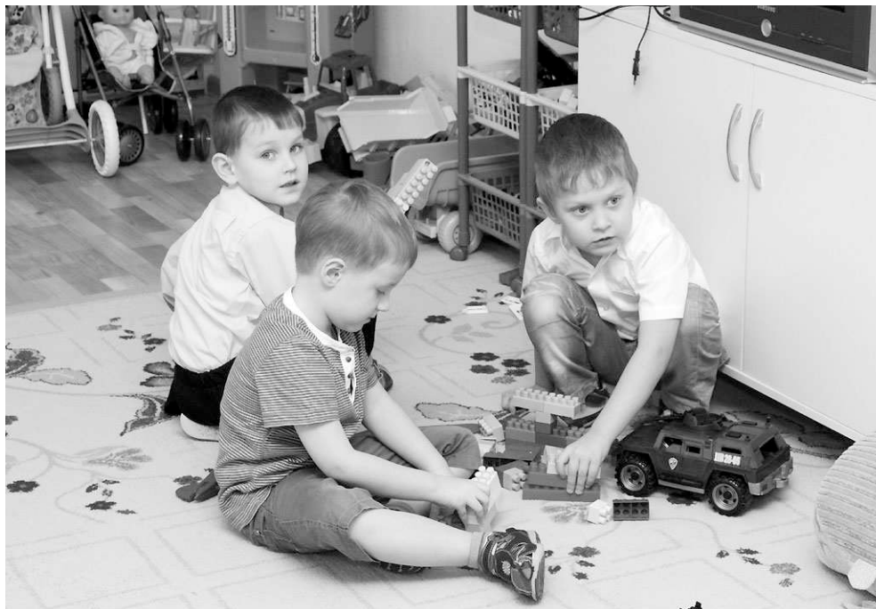
В новом корпусе детского сада № 7 много игрушек, света, воздуха и тепла.

Зампредседателя комитета заксобрания по транспортной, промышленной и информационной политике Борис Прилепский тоже оценивает показатели социально-экономического развития Бердска как «вполне удовлетворительные». Он напомнил, что на последней встрече с руководителями промышленных предприятий глава области Василий Юрченко вновь подчеркнул: промышленность области работает и даёт львиную часть доходов областного бюджета. «И роль трудовых коллективов Бердска в наращивании налогооблагаемой базы немаленькая, в том числе крупных предприятий «Сиббиофарм», БЭМЗ и многих компаний малого и среднего бизнеса, строитель-