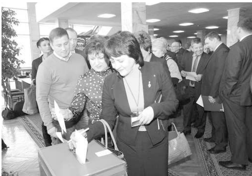
«Единая Россия» выбрала кандидата в мэры тайным голосованием.