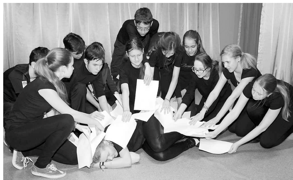
Воспитанники первой студии. Сценка «У меня в голове».

явленных воспитанников не наказывать их отлучением от творческих занятий: мол, пока не исправишь оценку по математике или русскому, в студию не пойдёшь.