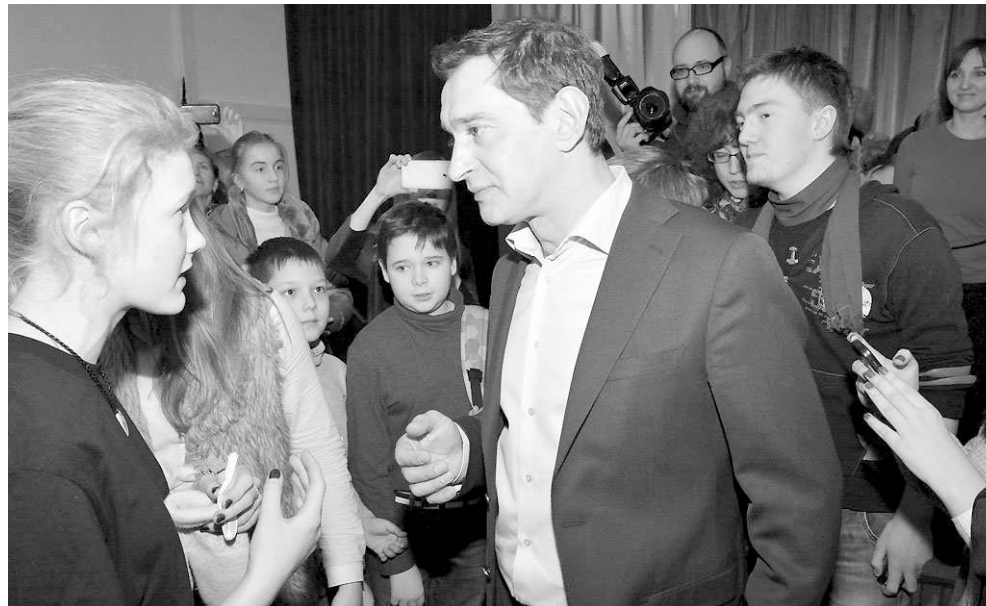
Профессиональные советы Константин Хабенский давал и после официального открытия студии.

В первой новосибирской школе Константина Хабенского уже обучилось 180 детей. Лучшие воспитанники студий из всех городов России летом встречаются на фестивале «Оперение», который каждый год меняет место проведения, а в этом году будет проходить в Казани. У самых ярких представителей «свежего» курса из 130 воспитанников в возрасте от семи до 17 лет тоже будет шанс туда попасть. Чтобы учиться в школе Константина Хабенского, они прошли кастинг — читали прозу или стихотворение, готовили танец, пантомиму, демонстрировали вокал и полёт фантазии. Но в дальнейшем никаких экзаменов и оценок у студийцев не будет. Критерий эффективности один: либо это хорошо и интересно, либо нет. Здесь не ставят задачу подготовить детей к поступлению в театральные вузы. Цель — через занятия творчеством помочь этим детям раскрыть их лучшие качества и стать гармоничными, успешными людьми. Даже в учёбе. Поэтому педагоги очень просят родителей ново-