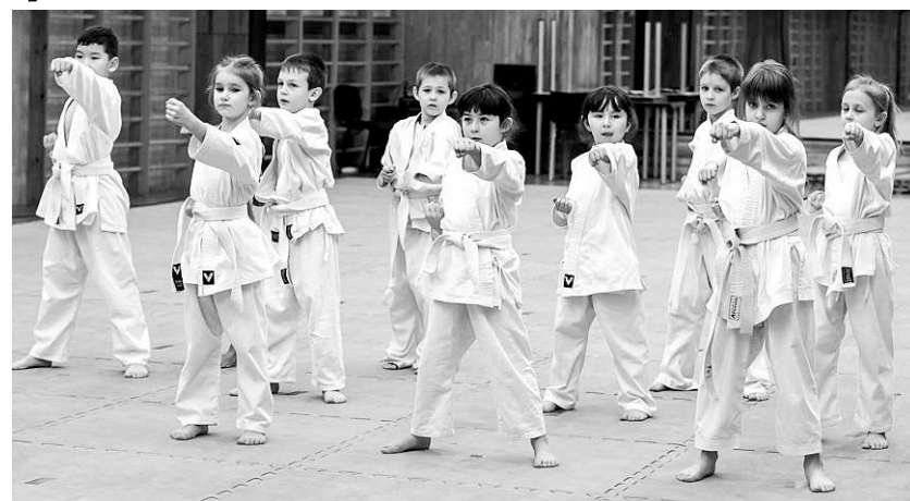
Спортивно-профессиональный клуб «Успех» отметил своё 25-летие.