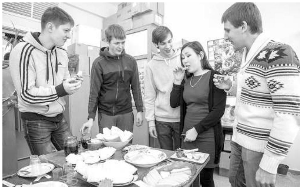
Дегустация в лаборатории интродукции пищевых растений — бенниказа и кивано.

Сотрудники института ездят с экспедициями по обширной территории Алтайско-Саянской горной страны, которая находится в центре Азии