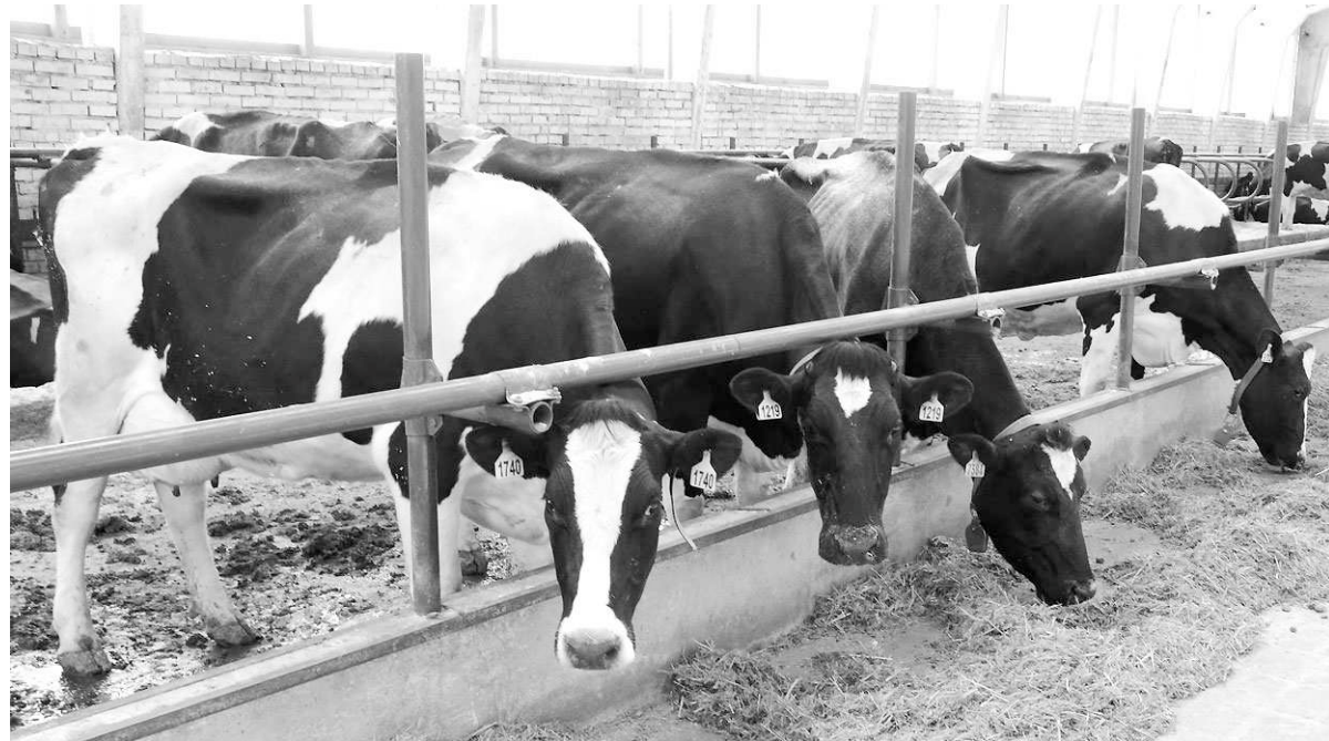
Грамотная утилизация биоотходов — один из важнейших аргументов в пользу производителя.

утилизатор был построен по немецкому аналогу и покрывал все потребности области по этой части. Сегодня же это коммерческое предприятие, которое работает только по договорам.