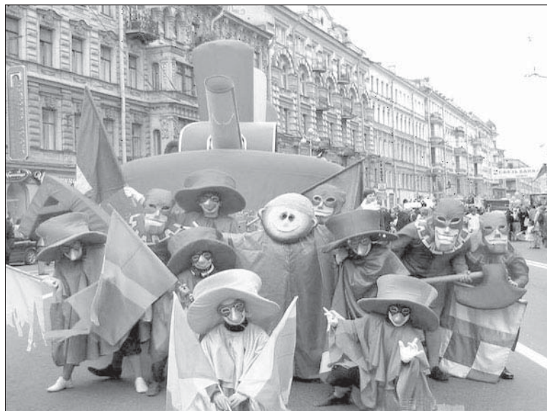
Театр 2-на Пэжо.