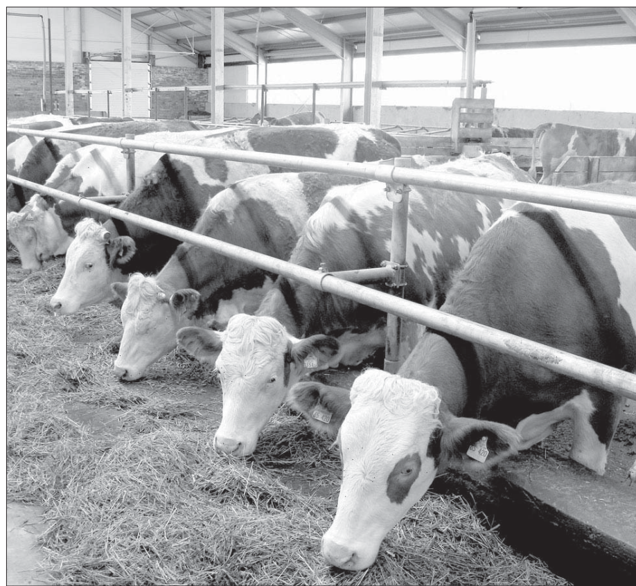
Как народ переживает за этих красавиц зимой!

В ООО «Сибирская нива», где земли шести бывших хозяйств Маслянинского района, известный в России немец Штефан Дюр создает молочный комплекс на 1200 животных, с годовым надоем на корову в 8—10 тысяч литров. Такие комплексы у него есть в Воронежской и Калужской областях. Сибирскую стройку осложнил кризис, и племенные телки и нетели из Австрии и Германии зимовали на улице. Недавно инвестор был в Новосибирской области и остался доволен: сберегли иностранок!