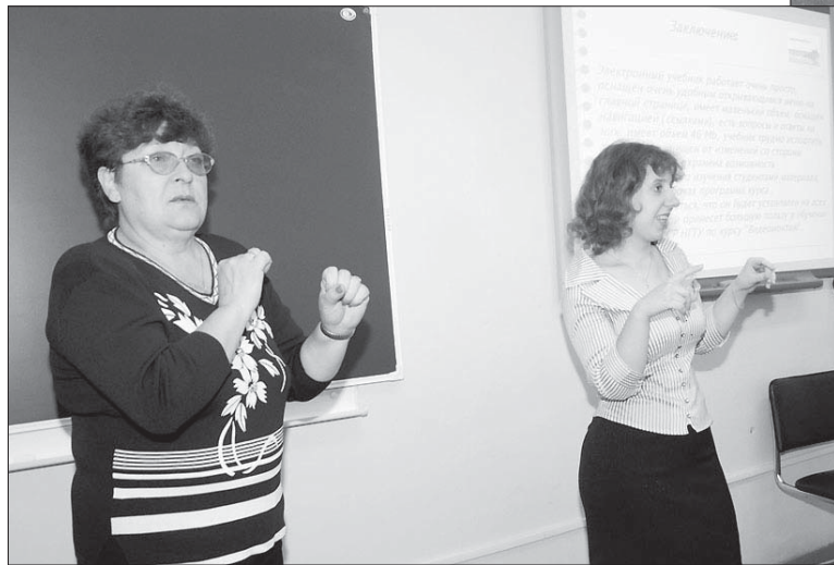
Защита дипломов в ИСР проходит с сурдопереводчиком.