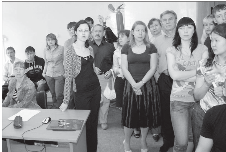
А завтра можно будет расслабиться и не волноваться...

обходимые ресурсы, медперсонал и преподавателей. Но школа должна быть архитектурно готова к приходу особого ребенка, педагоги владеют методиками обучения, составлены индивидуальные планы и задания для необычных детей. Педагогической команде позволено выстраивать образовательный процесс под ученика. Есть специальный штат учителей-воспитателей, из здоровых учеников набирается команда помощников, например, записывающих лекции для незрячих, заново объясняющих плохо усвоенный предмет. Таким образом, ребенок не рассматривается больше как инвалид, ограничения сглаживаются. Здоровые меняют отношение к больному человеку, вовлекая его в социум.