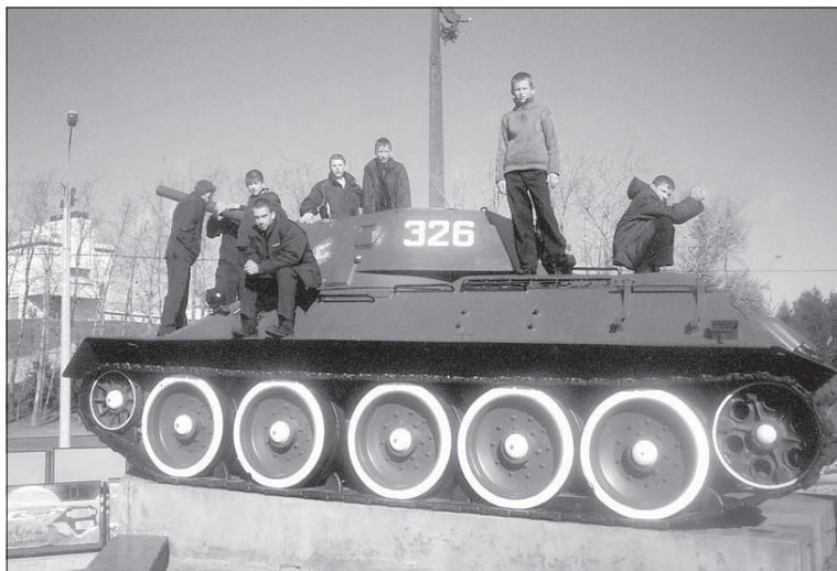
Москва. Музей Российской армии.