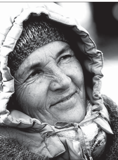
Павел Пляскин «Женица, продающая шаль» — номинация «Мир людей»