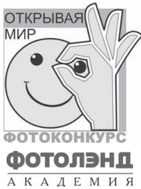
ОСТАЕТСЯ ВСЕГО НЕСКОЛЬКО МЕСЯЦЕВ, ЭТО НЕ ПОВОД ОТКАЗЫВАТЬСЯ ОТ УЧАСТИЯ. ДЕРЖАЙТЕ, НАМ ВАЖЕН ВАШ ВЗГЛЯД НА МИР, ВАШЕ ВИДЕНИЕ НАСТОЯЩЕГО, А НЕ ВАШ ВОЗРАСТ.

В редакцию поступают вопросы о возрасте участников. Конкурс наш молодежный, участвовать в нем могут люди от 18 до 30 лет. Но если вам пока 17, в этом году исполняется 18 и до заветной даты