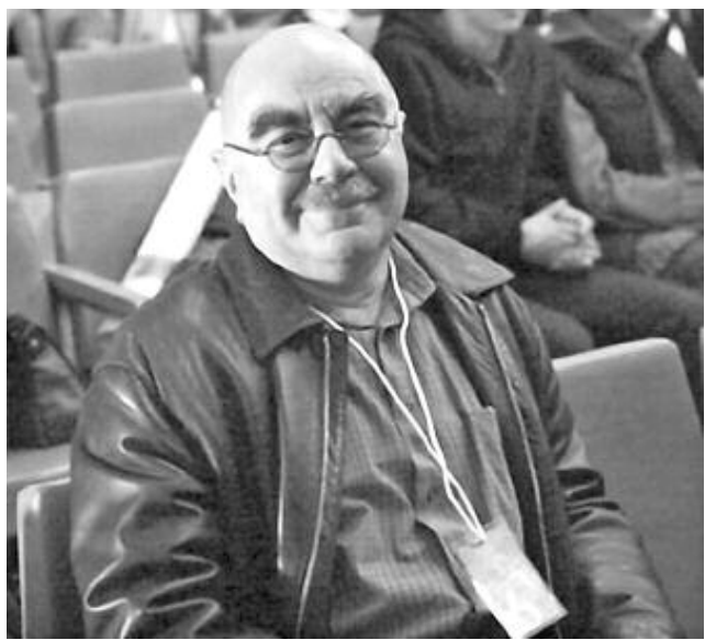
Президент гильдии монтажеров США Алан Хейм.