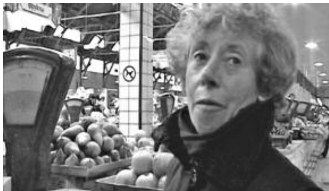
Кадр из фильма «Вне времени» Жанны Берту.

Остальные фильмы программы «Лучшее из лучших» пройдут в «Красном зале»