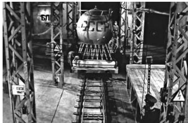
Кадр из фильма «Первые на Луне» режиссера Алексея Федорченко.

Найдется место в интернациональной «золотой коллекции» документального