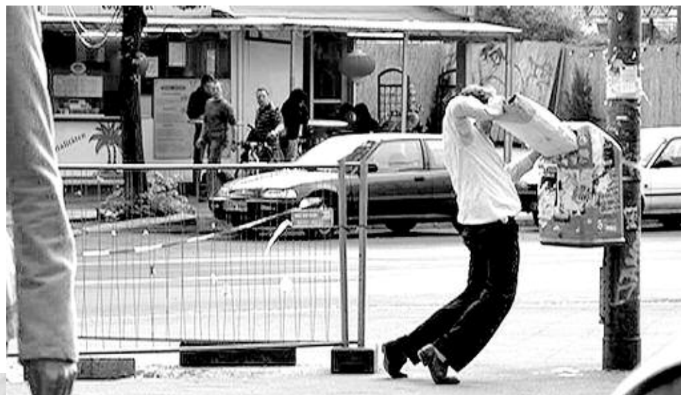
Кадр из фильма «Performing Life».