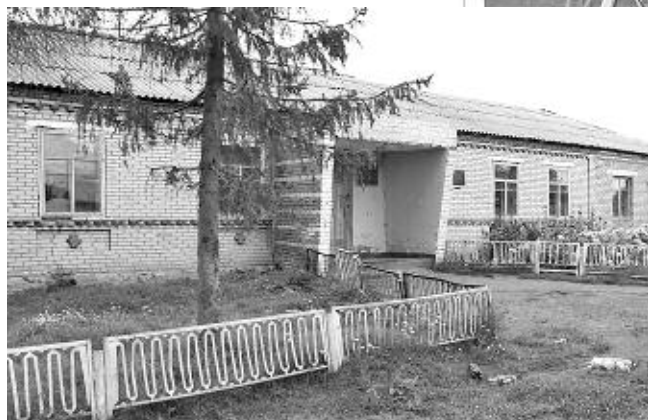
Старое здание школы.