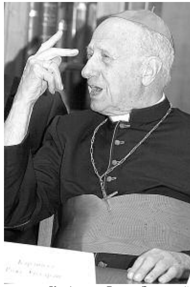
Кардинал Роже Эчегарай.

— Здесь живет великое множество народов и народностей, которые умудряются гармонично сосуществовать. Поэтому побывать в таком месте мне интересно не просто как человеку, но и как христианину, который по своей вере имеет глобальное видение мира. В Сибири другое понятие расстояний, не как у нас в Европе. Отсюда до Монголии рукой подать, недалеко Корея, Китай, в котором я был уже четыре раза. Как носитель мира я хотел бы спросить у вас, у людей,