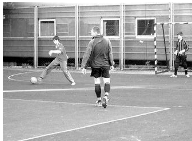
А эту прекрасную спортплощадку ТСО «Железнодорожный» уже запускает в эксплуатацию.