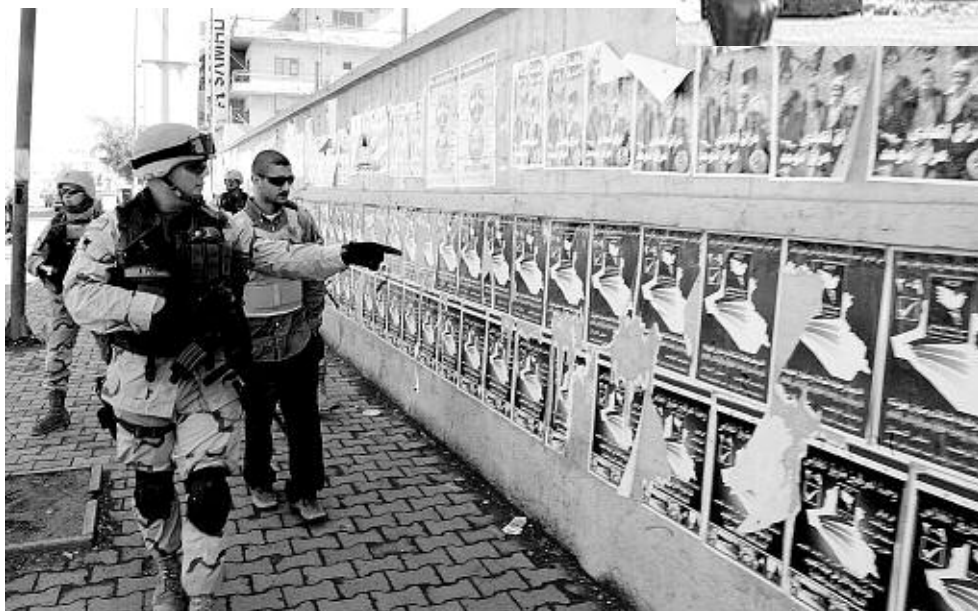
Кадр из фильма «Моя страна, моя страна».