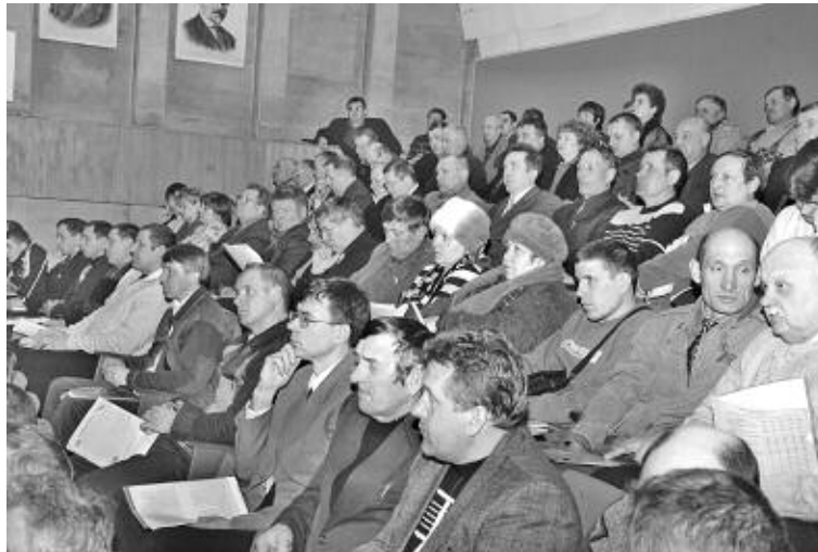
На последней областной конференции фермеров.