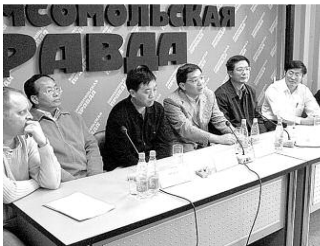
Участники форума на пресс-конференции.

Укреплять контакты с Сибирью Китаю необходимо. Наш регион — перспективный рынок сбыта. Китайско-новосибирский внешнеторговый оборот растет темпами, опережающими общероссийские показатели. Планируется, что к 2010 году он достигнет 17—18 млрд долларов. Новосибирск интересуется