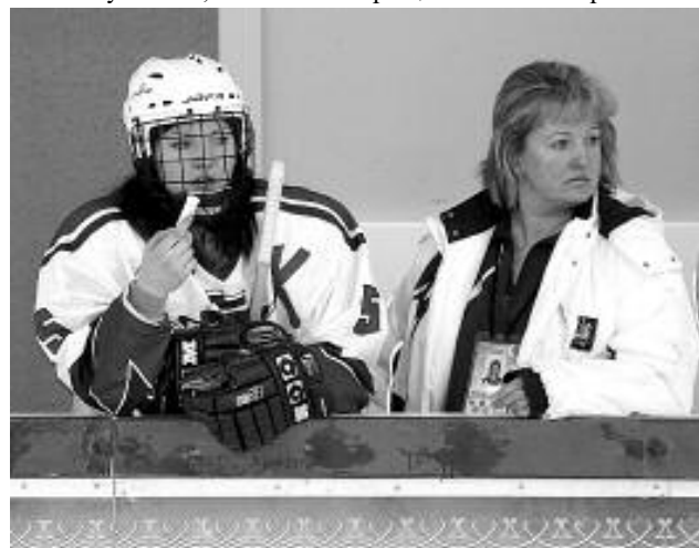
Пока тренер отвернулся...

щие премудрости кёрлинга. Кстати, после турнира весь комплект инвентаря (а это дорогостоящее оборудование, производится только в Шотландии и Канаде) останутся у нас. Вот покажутся наши мальчишки и девчонки эти шайбы с годик — тогда можно с Москвой потягаться... А желание и характер есть: наши ребята, например, обыграли сборную Приволжского феде-