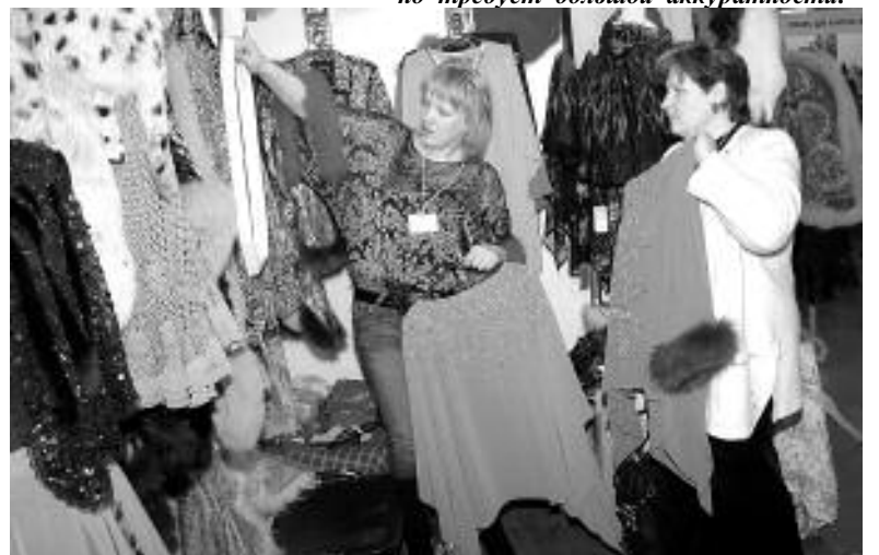
Отороченная мехом туника уберезет от капризов сибирской весны.