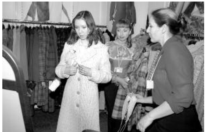
Белый — шикарный цвет, но требует большой аккуратности.

Теперь об аксессуарах. Еще один отголосок 80-х — широкие ремни, кожаные, плетеные, матовые или лакированные. Дизайнеры декорируют их шелковыми лентами и огромными расписными пряжками. Этой весной широкие ремни носят высоко на талии и перехватывают ими длинные свитера, рубашки или платя. Стремление к роскошному изобилию сказывается и на сумках. Вместительные сумки пестрят металлическими вставками и принтами из крокодиловой кожи. На лакированных сумках актуальны стразы. Особое внимание обратите на сумки необычной формы и нестандартного размера.