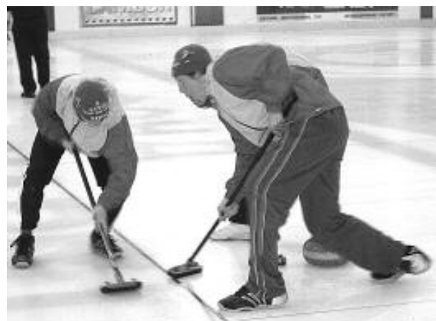
«После турнира пойдём в матросы...»

Двумя днями позже в борьбу вступили юноши. Их турнир разбит на две подгруппы, и одна из них