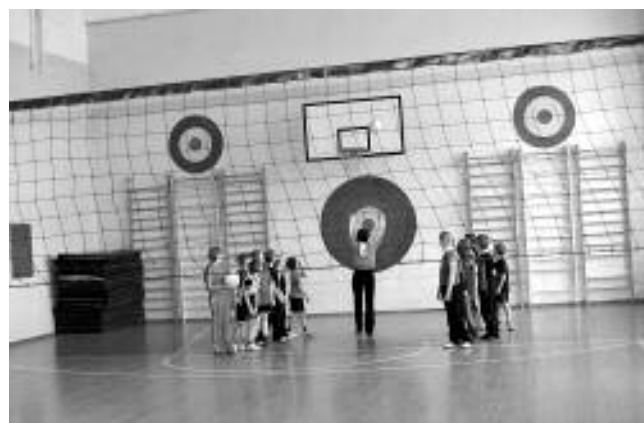
Сегодня в отстроенном с нуля зале проходят не только уроки и занятия в спортивных секциях, но даже значимые городские соревнования.

знают, то как применить их на практике — нет. Над этим мы работаем мало. Времени не хватает. Отсюда перегрузка. Если ребенок учится на «четыре» и «пять», значит, он сидит над учебниками дома не разгибая спины. А это ведет к проблемам со зрением и сколиозу. Поэтому первое, что нужно сделать, — изменить подход к содержанию образования. Оно должно соответствовать природе ребенка. Не может он столько усвоить! Второй момент — каждый ребенок по-своему талантлив. Нам надо найти это зернышко таланта — и его развивать. А