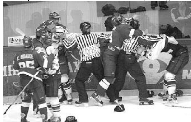
Страницу подготовил Василий СПИРИДОНОВ.

Не пропустите — такого спектакля вы еще не видели!