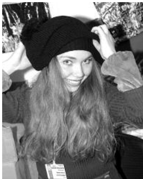
Модный головной убор соединяет в себе небрежность образа и качественный материал: мех, шерсть, фетр.

Чтобы вы ни надели, главным секретом вашей привлекательности останется хорошее расположение духа. Вспомните свои детские ощущения от посещения кондитерской. Пусть это настроение не покидает вас при любых обстоя-