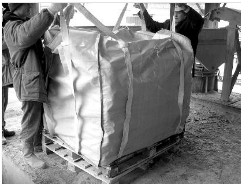
Слинг — новая упаковка для перевозки тарированного цемента в мешках по 50 кг (емкость две тонны).

Покупателю самому было бы интереснее весной заключить договор с поставщиком на определение какой-то цены и договориться о доставке. Отмечу, что «продавцы с доставкой» располагают более выгодной ценой, себестоимость услуги снижается. Если снабженец покупает товар и самостоятельно подключает автотранспорт, он платит больше, это подтверждают наши исследования. Обращается он к тем же автотранспортным предприятиям, которые задействовали свои мощности на рынке цемента. Но машины у них расписаны уже на год, задействован весь календарный период. И они уже знают, когда спрос повышается. Транспортировка — это тоже сезонный бизнес. По сути дела, транспортники летом формируют свои доходы. Тот же грузовик мало нанять, он еще должен доехать до Искитима и обратно. В дороге может случиться все, что угодно. Поэтому мы хотим, чтобы конечный потребитель не думал о доставке. Он может просто заказать цемент, а дальше уже наше дело. Нужно организовывать логистические преимущества. Это даже не ноу-хау, это не мной придумано. Просто есть понимание процесса, который нужно осуществлять.