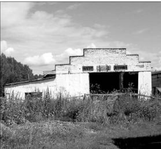
В пустых «хоромах» оборудуют овощехранилище.