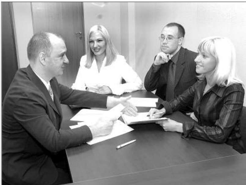
Нестандартные решения рождаются в спорах менеджеров.