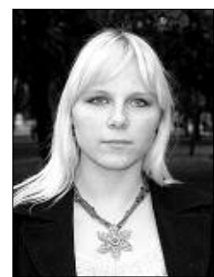
Опрос проводила Ирина ТИМОФЕЕВА.

— Мне кажется, для нас это скорее плохо, чем хорошо. Вот если бы наши туда вложили деньги — другое дело! А эти еще что-нибудь потребуют... Они же вкладывают деньги не просто так. Найти эти пять миллионов долларов и мы могли бы. Только кому это надо?