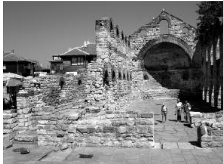
Развалины Несебра выглядят живописно.

парируем мы. «Да нашей-то тем более!» — смеются они над своей сборной. И в этот момент мы как никогда радуемся такому родству. Правда, хозяйка, в отличие от нас, дружно болеет за Украину.