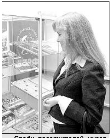
Среди посетителей музея немало молодежи.