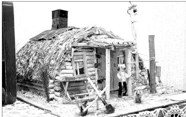
Макет землянки образца 30-х годов.