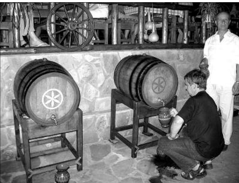
Вино здесь пьют бокалами, кувшинами и бочками.