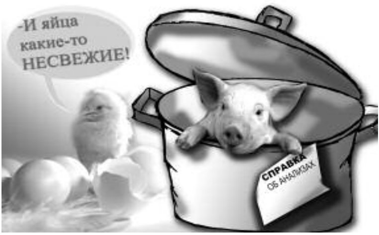
Подготовила Инна ГОЛОВАЧЕВА. Коллажи Натальи ЖУРАВЛЕВОЙ.