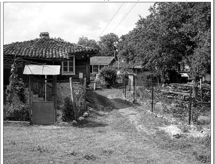
Болгарская деревня: не парадный вход.