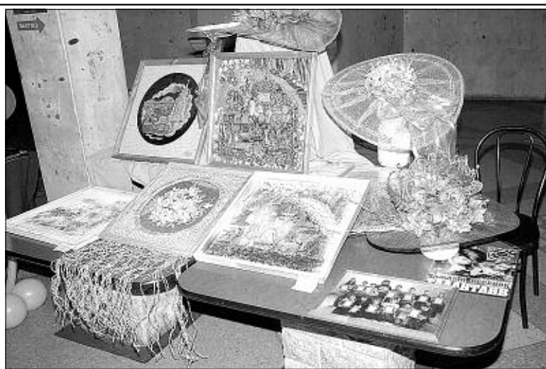
Выставка воспитанников творческой лаборатории «Ивушка».