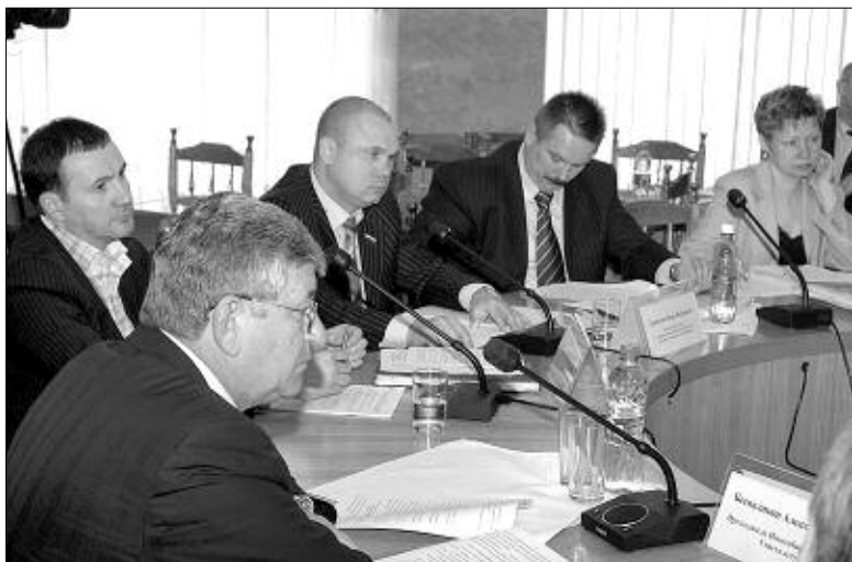
Идет заседание «круглого стола».

Елена КВАСНИКОВА.