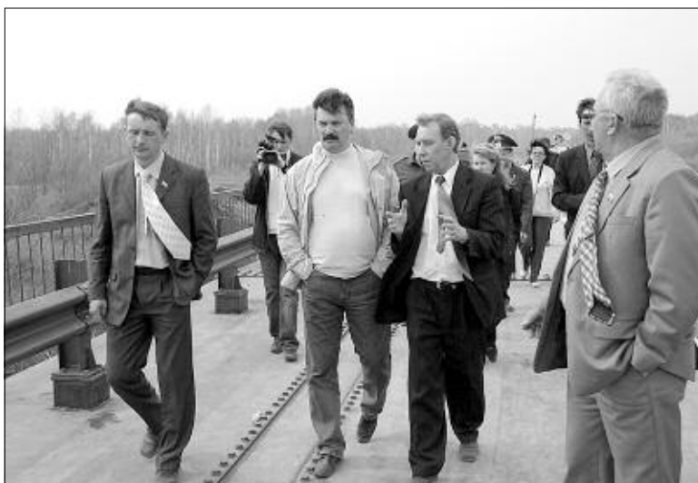
Проезжим этот мост станет к августу.

С погодой в Северном районе нам повезло. По дороге в Бергуль продавленные колесами нефтевозов колеи (некоторые глубиной почти по колесо) подсохли, осыпались по кра-