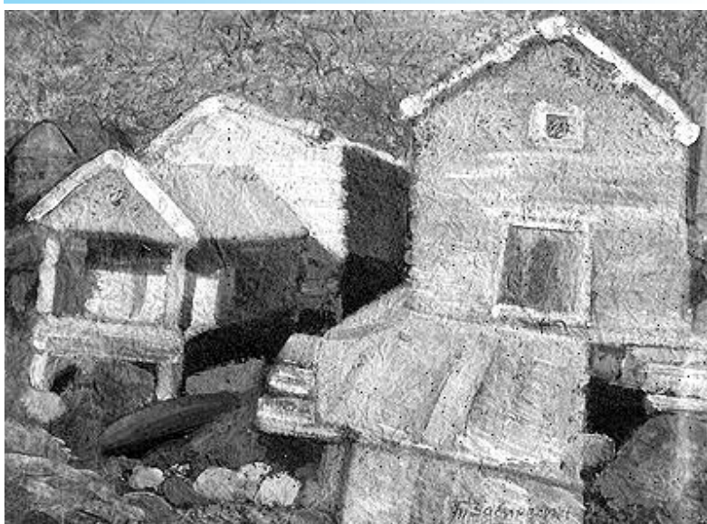
Борис Забихин. «Русская Лапландия». Бумага, темпера.

В Новосибирском художественном музее (Красный проспект, 5, тел. 223-53-31). Постоянные: Иконы пяти веков. Русская живопись XVIII—XX веков. Западноевропейское искусство XVIII—XIX веков. Николай РЕРИХ. Искусство XX века. Выставка «Игрушка в произведениях живописи».