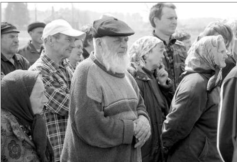
Жители Бергуля на встречу с депутатами настроились по-боевому.

В поселке у нефтяников, где после поездки в Бергуль, побывали