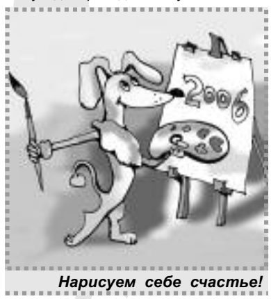
Нарисуем себе счастье!