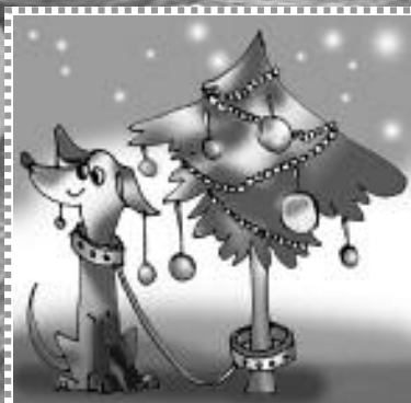
Сторожевые праздники и будни.