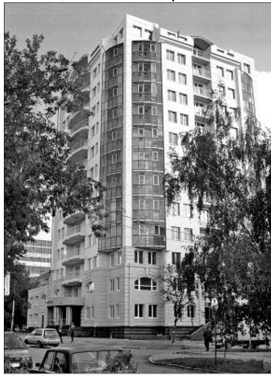
12-этажное жилое здание по ул. Урицкого. Заказчик ЗАО «Труд». Проект 1999 г.