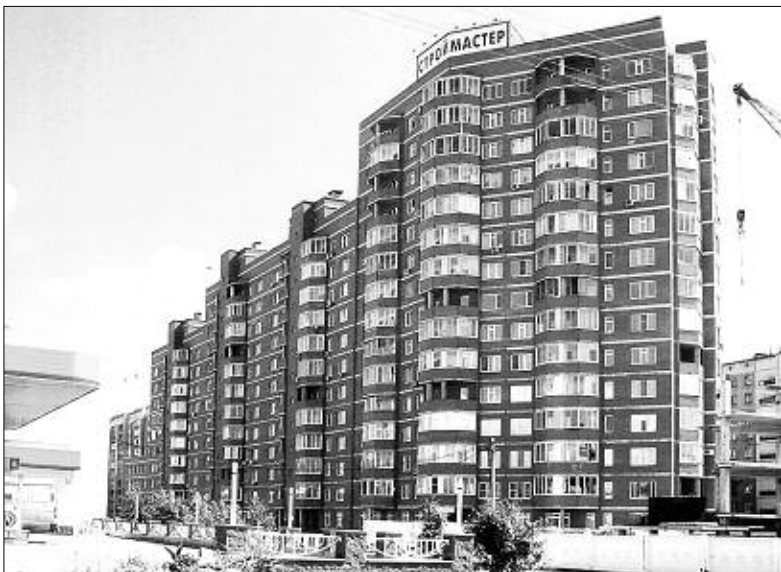
15-этажное жилое здание переменной этажности. Заказчик СК «Строймастер». Проект 2000 г.

го резерва. Аналогичные с бердским Ледовым дворцом арки, но уже пролетом 70 метров, изготовлены нашей компанией для губернского спортивного центра в г. Кемерово. Совместно с фирмой «Интерпроект» мы участвуем в строительстве 16-этажного жилого дома сложной конфигурации — это за зданием «Новосибирсквнешторгбанка». Тоже оригинальный, необычный объект.