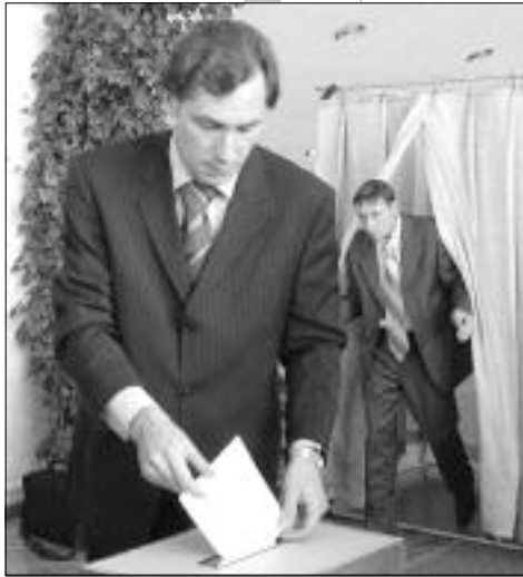
Олимпийские чемпионы на марше! Станислав Поздняков и Евгений Подгорный в момент голосования.