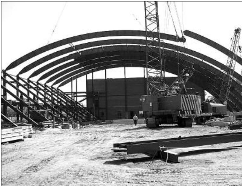
Будущий Ледовый дворец в г. Бердске.

— Мы закончили проектирование и приступили к изготовлению металлокаркаса двух 24-этажных зданий для ЗАО «Труд» около гостиницы «Сибирь» в Новосибирске. Только представьте, какие это будут высоты. Спроектированы, изготовлены и смонтированы арки пролетом 55 метров для Ледового дворца спорта в г. Бердске. Бердчане очень ждут этот дворец: здесь будут все условия для хоккеистов и фигуристов, появятся возможности для создания в Бердске школы олимпийско-