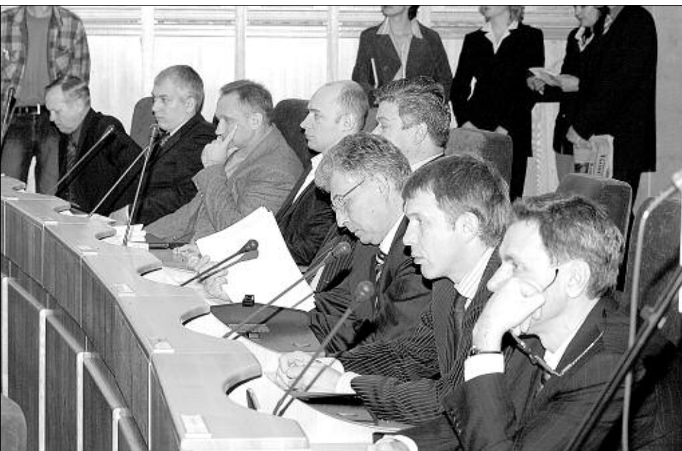
В большом сессионном зале.