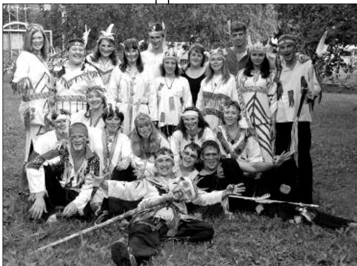
На фестивале детских оздоровительных лагерей.

На мероприятие съехались представители 40 лагерей, а это более 500 человек. Началось все торжественной линейкой на монументе Славы — по уже сложившейся традиции, многие мероприятия в этом году посвящены 60-летию Победы — и концертом в филармонии, продолжилась в ДОЛ «Юбилейный», где собравшихся ожидали научно-практическая конференция «Ценностная ориентация детского отдыха» по пяти секциям и десять творческих мастер-классов. Но ребята не только работали: «Вожатская кругосветка» напомнила о десяти прошедших фестивалях, а праздничная программа на стадионе и программа «Как здорово, что все мы здесь сегодня собрались» позволили проявить себя в танцах и песнях. Подводились и итоги летнего сезона, после чего по «арочной площадке» из шаров, по «свечевому пути» все участники прошли на берег реки, где их ожидал символический, похожий на большую цифру 10, плот. Представитель каждого лагеря опустил в воду венок со свечой, а коллективы дружно загадывали желания — нетрудно догадаться, что большинство из них касалось будущих, наверняка таких же красивых и ярких фестивалей.