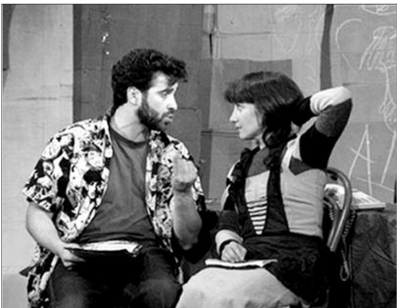
Театр «АРТИШОК» (Алматы). «Черствые именины» — 12.09 в 19.00 в КЗФ.

Алматинскому театру хоть на два часа, но это сделать удалось.