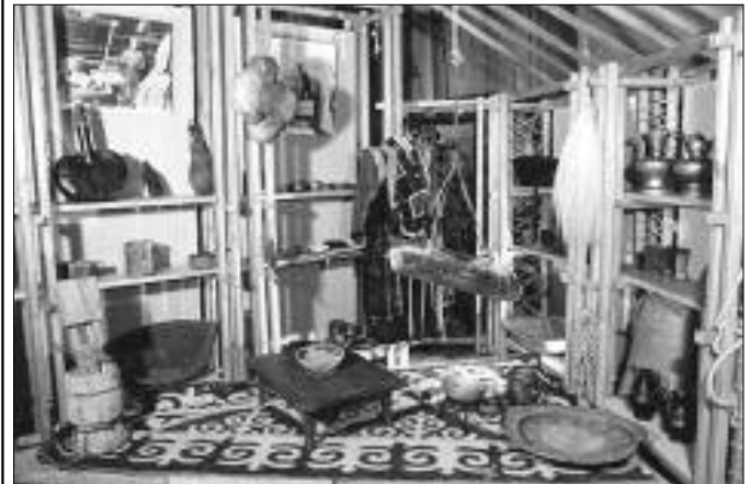
Краеведческий музей. Экспозиция «Быт коренных народов Сибири».

В Новосибирском художественном музее (Красный проспект, 5, тел. 223-53-31) работают выставки: Иконы XV—XIX веков. Русская живопись XVIII — начала XIX века. Западноевропейское искусство XVII—XIX веков. Н. К. РЕРИХ. Декоративно-прикладное искусство России XX века. Народное искусство — художественные промыслы России. Искусство XX века (живопись, скульптура). Сибирские народные иконы XIX—XX веков из собрания музея. «Сибирское искусство 1900 — начала 1920-х годов в коллекциях музеев Красноярска, Новосибирска, Томска» (до 18 сентября). Игровая студия и выставка русской игрушки (из коллекции и новых поступлений «Сибирского вернисажа»). Выставка произведений В. И. Сурикова. На ней представлены 30 живописных и графических работ великого мастера, хранящихся в Красноярском художественном музее (до 18 сентября). Выставочные залы НХМ (ул. Свердлова, 10): Фотовыставка «Москва—Берлин: полвека в фотографиях» (до 4 сентября). Выставка «Про живопись» (до 11 сентября). Новая выставка Санкт-Петербургского музея восковых фигур «НЕВЕДОМОЕ: Мумия возвращается! Тайны подземелий — от инквизиции до гильотины» (до 4 сентября). Галерея Новосибирского Союза художников России (ул. Свердлова, 13). Экспозиция изобразительного искусства, посвященная памяти выдающегося русского живописца, одного из основоположников абстрактного искусства Василия Васильевича КАНДИНСКОГО (1866—1944).