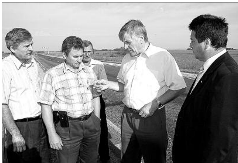
Обсуждается проблема ремонта школы в селе Кабинетном Чулымского района.