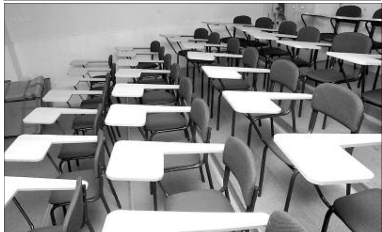
Музыкальный класс, оборудованный стульями с пюпитрами.