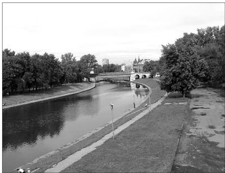
Все дышит стариной.

Самый дальний известный предок Тургенева — татарский мурза