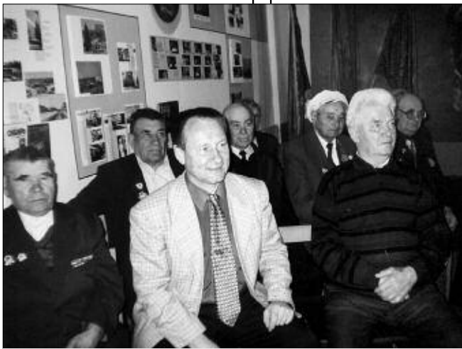
В музее на встрече с ветеранами.

Когда бы вы ни зашли в музей, обязательно увидите посетителей. А экспозиции постоянно пополняются новыми реликвиями. Двери музея всегда открыты. Ведь музей — это не склад, а очаг.