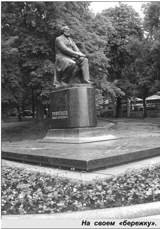
На своем «бережку».

Чутко отзывается на наши шаги старинный паркет, тяжело раздвигаются массивные двери, гулким эхом проносится по залам неторопливая вязь рассказа экскурсовода Елены Векуа. В тургеневском музее — музейная тишь. За 10 рублей можно познакомиться с уникальными экспонатами самостоятельно, за 70 — с экскурсоводом. Проверено не однажды: никакая «книжная» биография не даст настоящего соприкосновения с личностью великого человека.