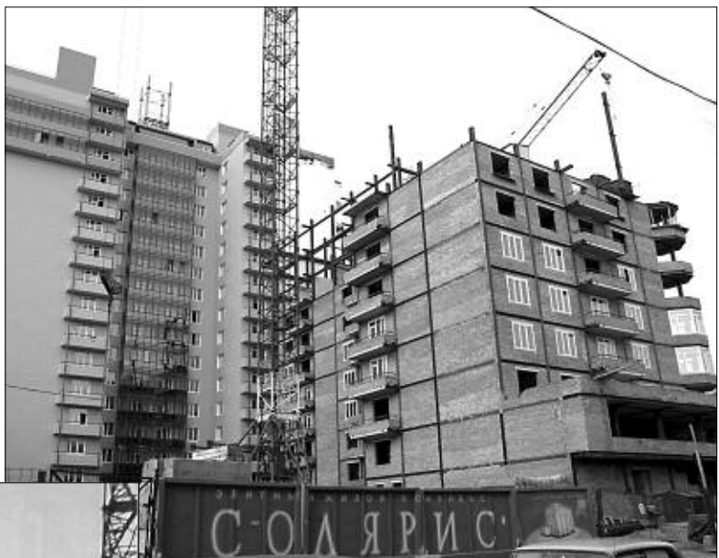
Жилой дом «Солярис».