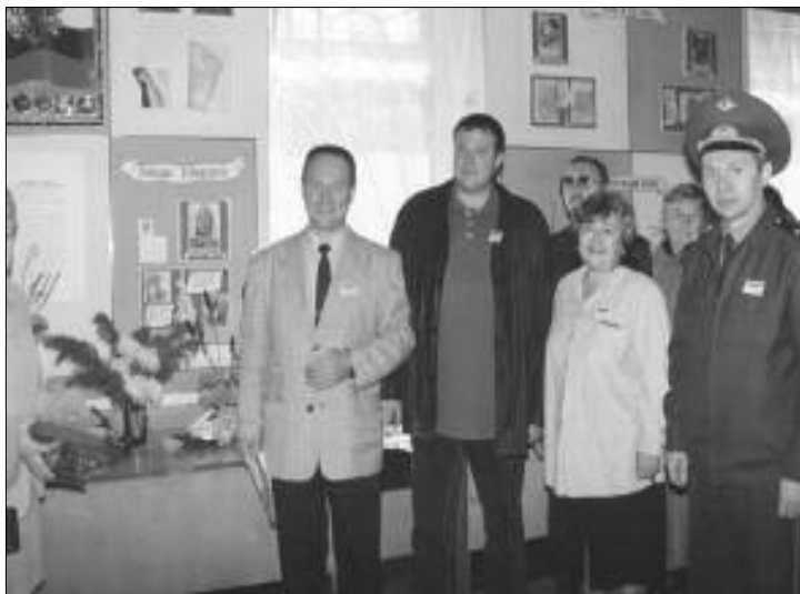
Музей военного городка — центр патриотического воспитания молодежи.