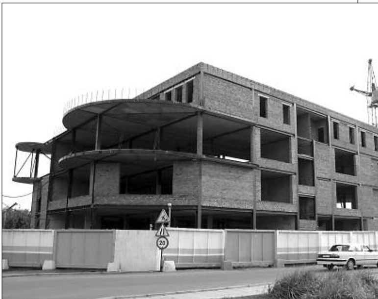
Первый бизнес-центр класса «А» в Новосибирске.