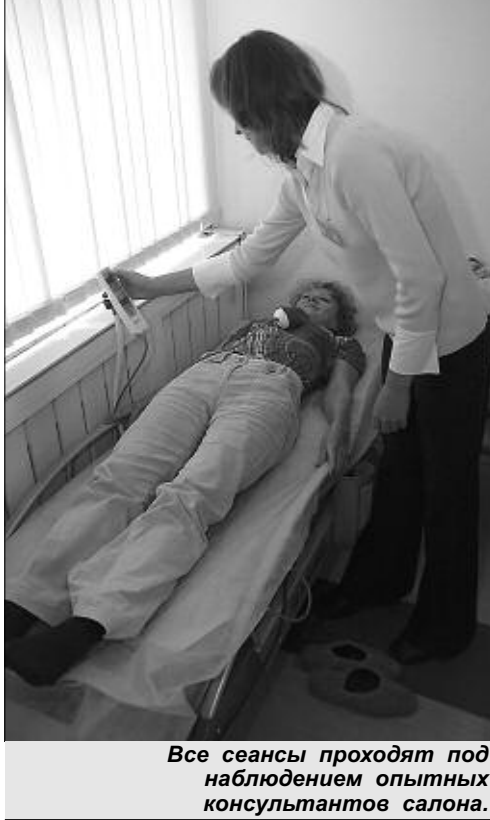
Все сеансы проходят под наблюдением опытных консультантов салона.

ное переутомление, коррекция осанки, контроль общего веса тела... — Есть, наверное, и противопоказания?