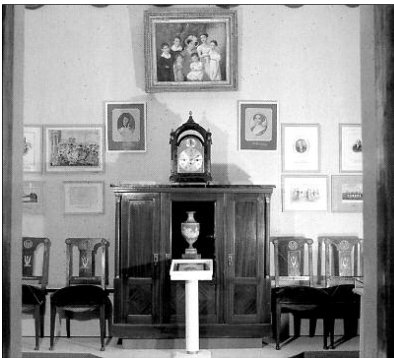
В тише музея.

«Попасть в след» можно только на месте пребывания гения.