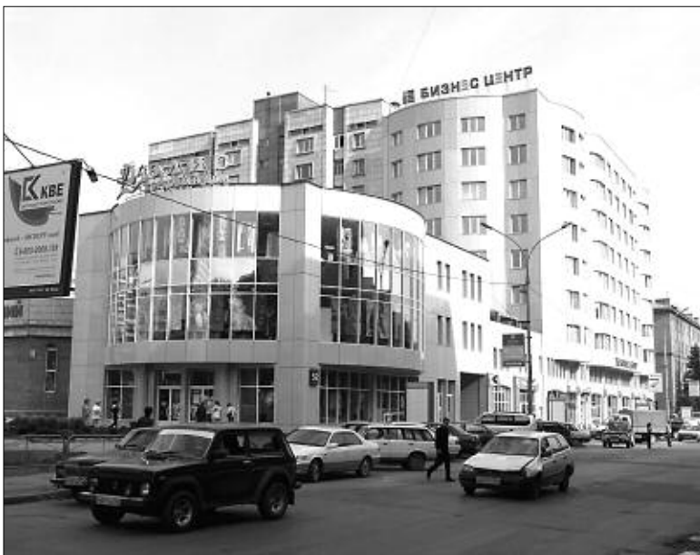
Торгово-административное здание корпорации «Трансервис».

«Стальпрома» Вадима Костина, его очень беспокоит недостаточный профессионализм многих участников рынка. Спрос на сооружение металлических каркасов в городе в последние годы значительно вырос, но притока квалифицированных кадров — к примеру, проектировщиков или монтажников — в том же объеме не наблюдается. То есть строительный спрос пока явно опережает предложение. В результате страдает качество работ, выполняемых многими фирмами: ведь нужно помнить о том, что современные городские новостройки — это, как правило, 15—18-этажные здания, возвести которые без нарушений под силу только опытным компаниям.