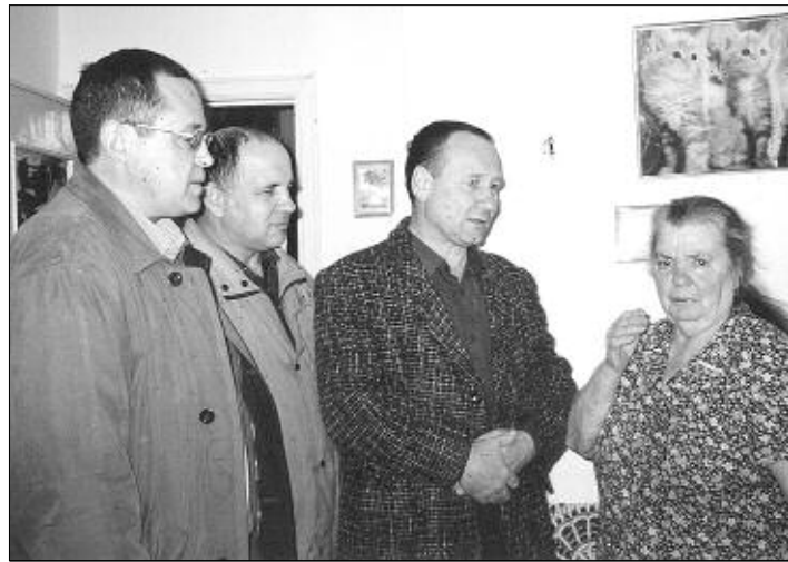
Депутат в гостях у вдовы ветерана.

Возвращаясь к принятому закону, надо отметить еще один момент, касающийся престижа армии и отношения к службе молодых людей. Мы в законе ввели понятие образовательного сертификата, который сможет получить любой отслуживший срочную службу и имеющий положительную характеристику молодой человек. Областной бюджет будет оплачивать его обучение в вузе при условии прохождения по конкурсу. Остальным предоставляется возможность за счет областного бюджета приобрести рабочую специальность или пройти курсы профессиональной переподготовки. Я не хочу сказать, что это — глобальное решение глобальной проблемы. Это только попытка помочь тому парню, который не сачканул, не спрятался, не сбежал, а честно