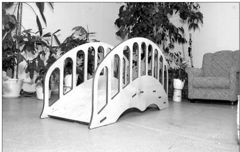
Мини-горка для малышек.

Константин ДОБРОХОТОВ.