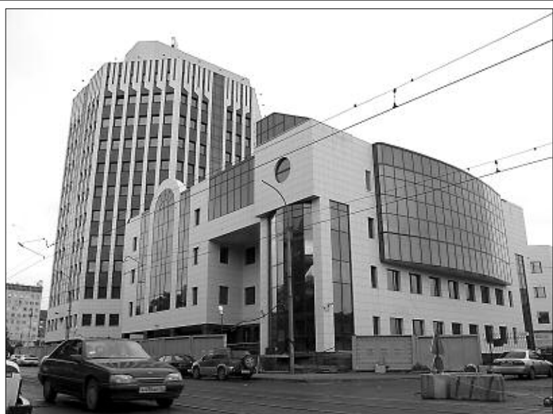
Новое здание Сбербанка.

Металлокаркас, как было уже сказано, обеспечивает целый ряд преимуществ перед другими строительными технологиями, хотя и требует при работе с ним высочайшей квалификации и объединения усилий всех участников строительства. И статус холдинга — объединения нескольких разноплановых предприятий строительной сферы — позволяет «Стальпрому» эти требования безукоризненно соблю-