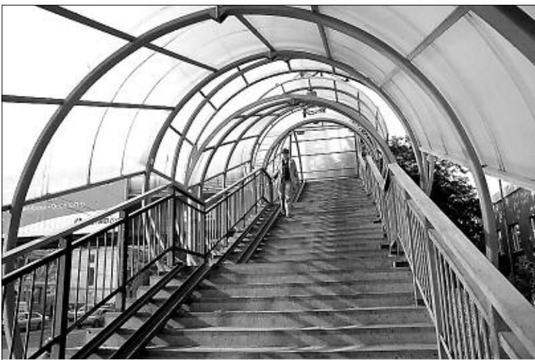
Пешеходный переход на площади Энергетиков.