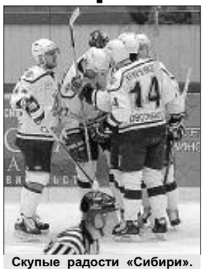
Скупые радости «Сибири».

В Турцию запланировано шесть контрольных матчей. (Материал о награждении команды по итогам прошлого сезона читайте на стр. 22).