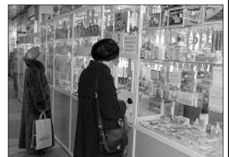
Публикуем перечень лекарственных средств, предназначенных для прописывания и отпуска по льготным и бесплатным рецептам за счет средств областного бюджета.