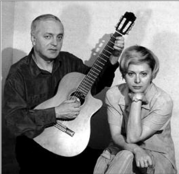
Татьяна и Сергей Никитины.