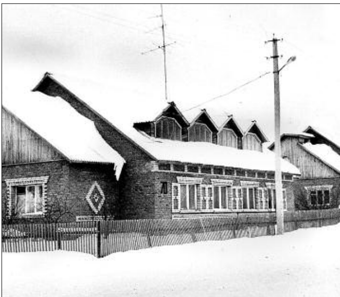
Улица в селе Верх-Ирмень.