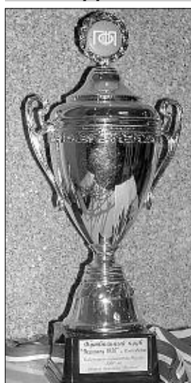
Вот он, заветный кубок.