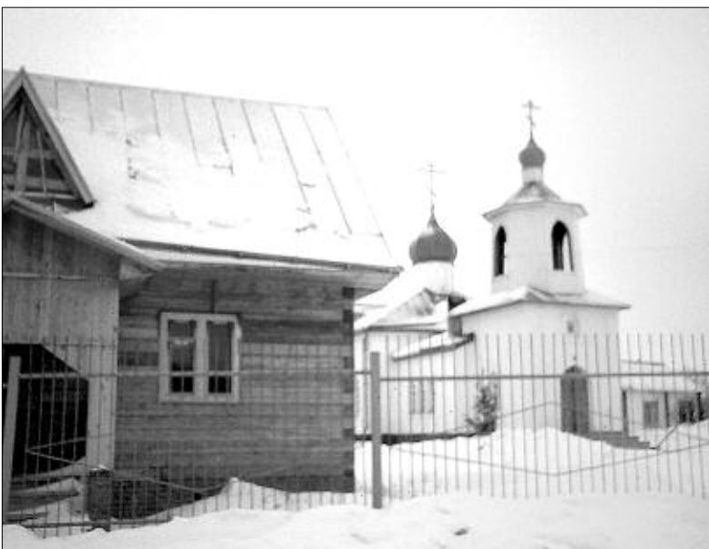
Женский монастырь в селе Малая Ирменка.