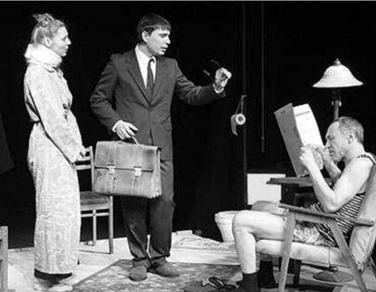
Спектакль «Детектор лжи».

«СТАРЫЙ ДОМ» ул. Большевикская, 45. Тел. 66-26-08. 14.01 «ОКУДЖАВА». 15.01 «КАМЕРА ОБСКУРА». 16.01 Премьера «АРТИСТ МИМАНСА». 18.01 «ВИКТОРИЯ». 19.01 «ЗАПИСКИ НЕТРЕЗВОГО ЧЕЛОВЕКА». 20.01 «СТАКАН ВОДЬ». 21.01 «ДОН ЖУАН».