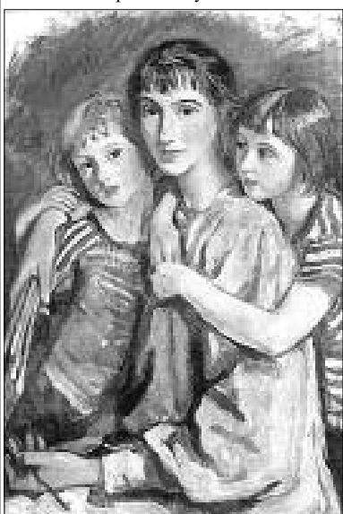
Автопортрет с дочерьми. 1921.