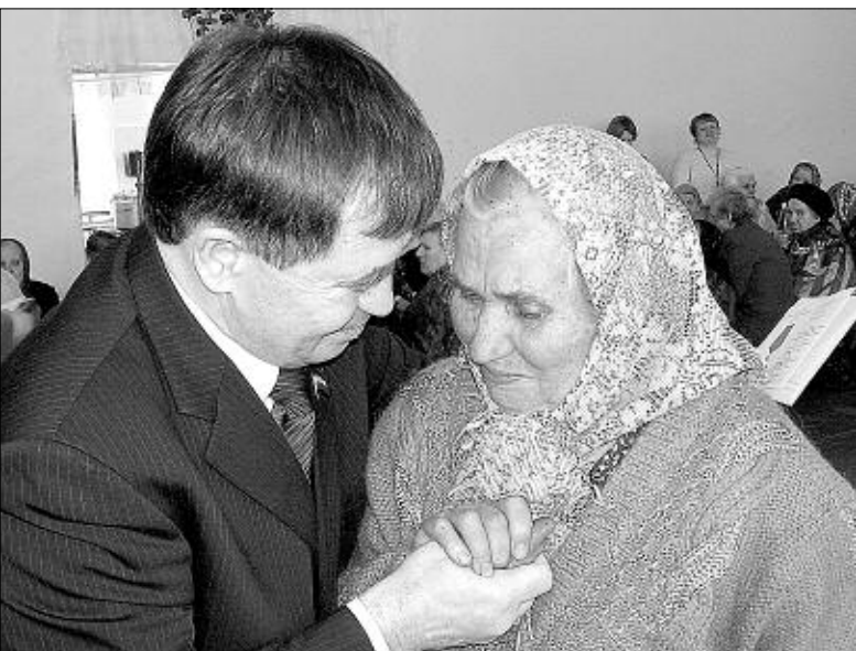
«Мы перед вами в долгу».