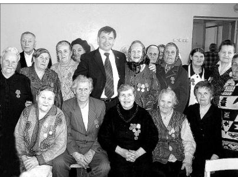
На женских плечах выстоял тыл.

ем праздники! Со ста граммами фронтовых, походной солдатской кашей, концертами, вместе поем любимые песни военных лет — «Землянку», «Синий платочек». И все трезвые, веселые — и сколько радости! На всех наших праздниках народ просто кишит!