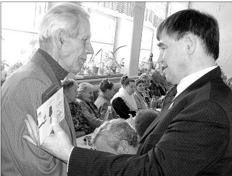
«За Победу вы заплатили сполна!»

— Я всегда считал за честь (мое любимое выражение: честь имею!) поздравлять, чествовать ветеранов войны — они это уважение заслужили, потому что благодаря им мы сейчас живем и здравствуем. И пятнадцать лет в фирме «Сибирь», и восемь лет депутатства — мы все время в этот день вместе. А какие мы устраиваем