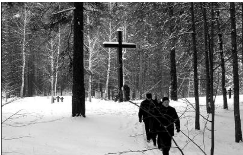
На Первомайском кладбище.

«Установлены фамилии, воинские звания, кто где похоронен, — говорит доктор исторических наук, зав. сектором истории социально-экономиче-