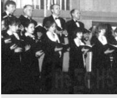
Кузбасский камерный хор.

31.11, КЗФ — 18.30 (тел. 22-15-11). Ассоциация концертных организаций Сибири.