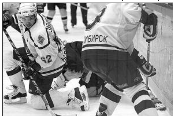
«Сибирь» поднимается с колен?