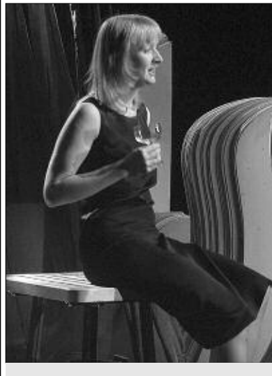
Спектакль «Анна Кристи».

Театр «ГЛОБУС» ул. Каменская, 1. Тел.: 23-88-41, 23-66-84.