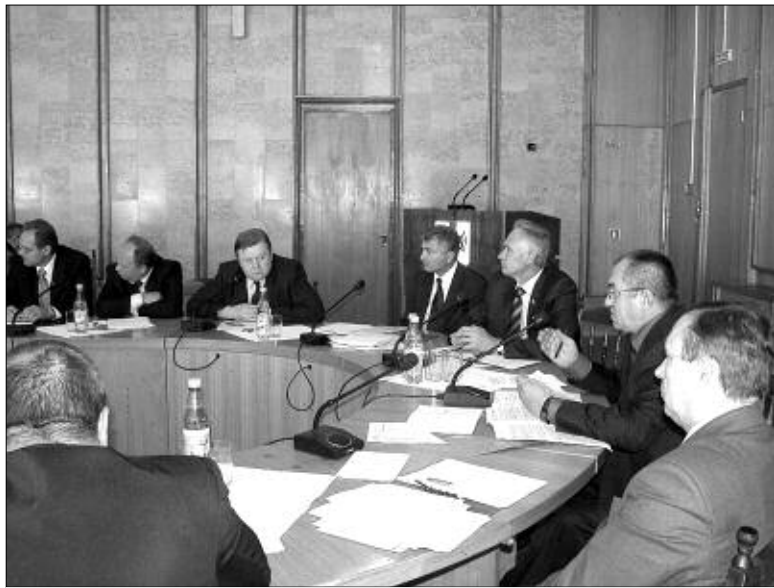
На заседании комитета.

Второй год подряд администрация и областной Совет депутатов провозглашают важнейшим направлением развития губернии — строительство жилья. Уже очевидно, что развертывание жилищного строительства может послужить серьез-