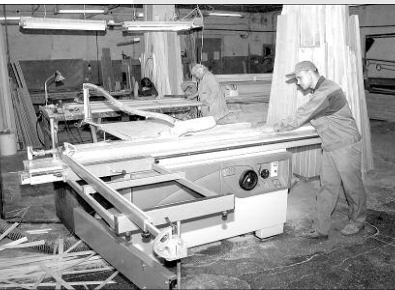
В производственном цехе.

«Бердские двери» оказались практически единственным производителем шпонированных дверей в нашем регионе, все остальное, что продается в этом классе, завозится с Урала или из европейской части страны. Если же сравнивать с импортными эталонами, то вот простой пример. Подобные по качеству итальянские двери у нас в городе продаются по цене 30 тысяч рублей и выше. Цены на такую же продукцию у «Бердских дверей» — 6 тысяч рублей. Как говорится, почувствуйте разницу.