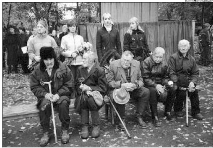
Ветераны провожают в последний путь своего земляка.