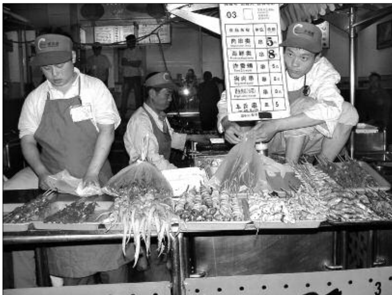
«Обжорный» ряд в Шанхае.

Дальше по оси — пять мраморных мостиков, переброшенных через Золотую реку, ведущие к Воротам Высшей Гармонии. Боюсь, мне не удастся передать и малой толики всего великолепия Пурпурного города, но его изящество звучит уже в самих названиях павильонов (читай — дворцов) — Павильон Высшей Гармонии, Павильон Совершенной Гармонии, Павильон Сохранения Гармонии, Павильон Соприкосновения Неба и Земли, Павильон Небесной Чистоты, Павильон Зимнего Отдохновения, Павильон Изысканного Изыщества, Павильон Вечной Весны, Павильон Отдыхающей Старос-