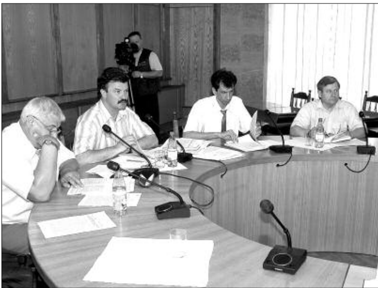
На заседании комитета.