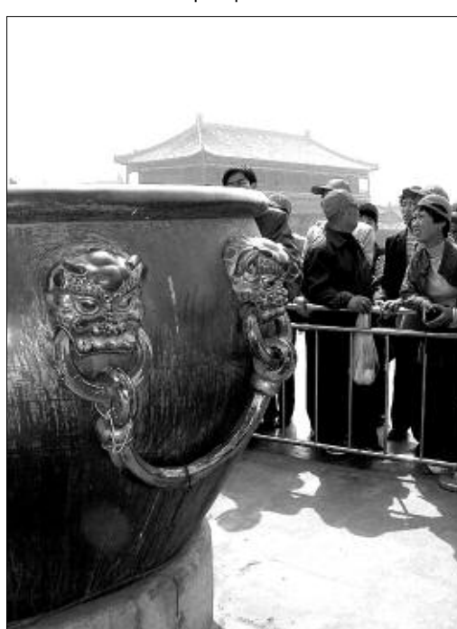
Бронзовые чаны Гугуна.

ший брат, а кто-то — младший. Вопрос о том, кто есть кто, подразумевал умаление одной из сторон. (В конце концов, есть еще и сестры). По одной из версий, наши отношения в итоге расстроились и в результате этого, мягко говоря, недоразумения. Так что сегодня принято говорить не о братских, а о дружественных связях. Официально же, по «Договору о добрососедстве, дружбе и сотрудничестве между КНР и РФ», подписанному Владимиром Путиным и Цзян Цзэминем 16 июля 2001 года, Россия и Китай — стратегические партнеры.