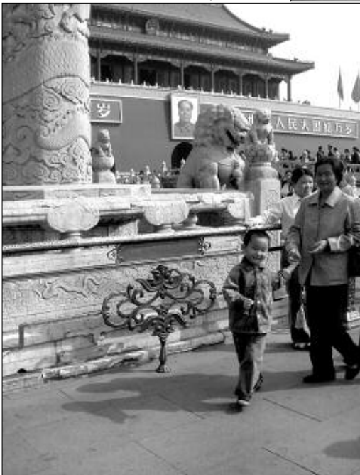
У Ворот Небесного Спокойствия.

Если войти в запретный город с южной стороны — через ворота Тяньаньмэнь «Ворота Небесного Спокойствия», то вам непременно