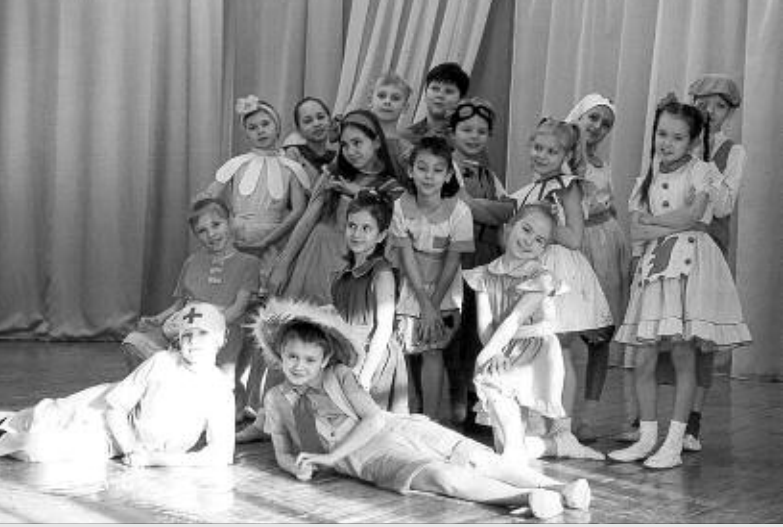
Театр-студия «Смайл» представляет «Приключения Незнайки и его друзей».

21—23.05 «УБОЙНАЯ ПАРОЧКА». 21—27.05 «РАССВЕТ МЕРТВЕЦОВ». 24—30.05 «ВАН ХЕЛЬСИНГ». 24—30.05 «СКУБИ ДУ»-2. 28—30.05 «В ЛОВУШКЕ ВРЕМЕНИ». ДК железнодорожников ул. Челюскинцев, 11. Тел. 29-25-49. 21—26.05 «АГЕНТ КОДИ БЭНКС»-2. 21—26.05 «БАГРОВЫЕ РЕКИ»-2. ДК «СТРОИТЕЛЬ» ул. Селезнева, 46. Тел. 77-40-13. 21—23.05 «УЛЫБКА МОНЫ ЛИЗЬ». 21—26.05 «В ЛОВУШКЕ ВРЕМЕНИ». 21—30.05 «ЛЕГЕНДА О РЫЦАРЕ». 21—30.05 «АМНЕЗИЯ». 21—30.05 «ВАН ХЕЛЬСИНГ». 28—30.05 «ЗАТОЙЧИ». ДК «АКАДЕМИЯ» ул. Ильича, 4. Тел. 34-36-70. 21—23.05 «УБОЙНАЯ ПАРОЧКА». 21—23.05 «ВАН ХЕЛЬСИНГ». 28—30.05 «ИГРЫ МОТЫЛЬКОВ». 28—30.05 «В ЛОВУШКЕ ВРЕМЕНИ». Кинотеатр «КИНОМА» ул. Кайская, 4. Тел. 23-36-38. «Разноликое кино» 21—23.05 «АГЕНТ КОДИ БЭНКС»-2. 24—30.05 «НЕСЛУЖЕБНОЕ ЗАДАНИЕ». «Иллэзион» 22.05 «НЕ ТРОНЬ ДОБЫЧУ». 29.05 Шедевры армянского кино «НАЧАЛО» (1967). «МЫ» (1969). «ВРЕМЕНА ГОДА» (1975). Японская анимация 22.05 «ЛЮБОВЬ И ХИНА». 23.05 «ГРАВИТАЦИЯ OAV». 29.05 «ИКС-TV». Часть 1-я. 30.05 «ИКС-TV». Часть 2-я. Клуб «Кино для продвинутых» 21.05 «МОЛОДОЙ АДАМ». 23.05 «ГРЕГОРИ МУЛИН ПРОТИВ ЧЕЛОВЕЧЕСТВА». 23.05 «НИКОМУ НЕ ГОВОРИ». 28.05 «НАСТОЯЩАЯ ДЕВОЧКА». 30.05 «ПОСЛЕ РАБОТЫ». 30.05 «РОЗОВЫЙ НАРЦИСС».