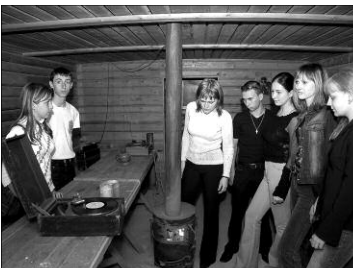
«Бьется в тесной печурке огонь...».