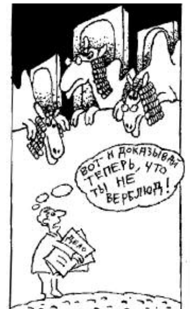
Рис. Александра ШАБАНОВА.

ставляется жалоба на английском или французском языке. Подавая жалобу в Европейский суд по правам человека, лучше всего обратиться к юристу, знающему международное право.