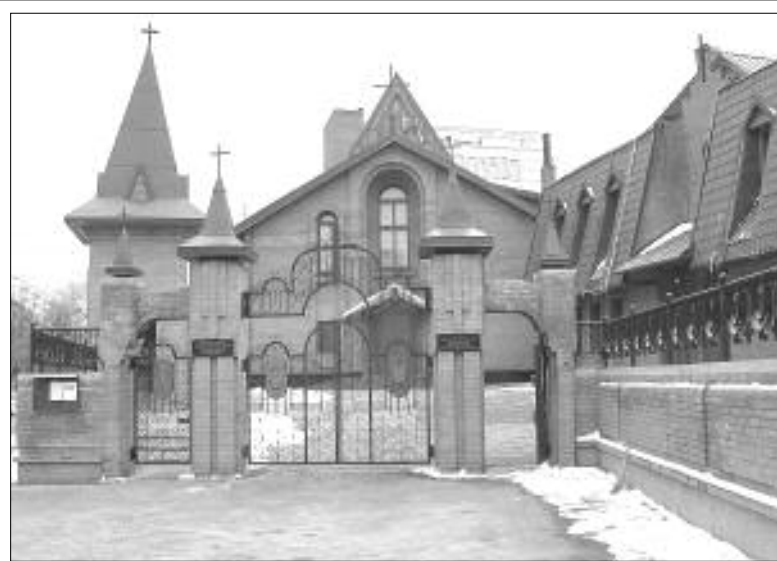
Католический костел обогревает котельная «Сферы-Трейд».