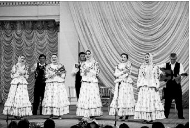
Фольклорный ансамбль «Рождество».