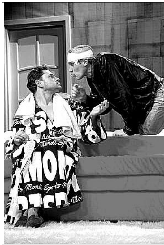
Сцена из спектакля «Ночной таксист».

ДОМ АКТЕРА ул. Серебренниковская, 35. Тел. 22-69-38. 3.05 Премьера. «ЦИРК «ШАР-ДАМ»» (цирк-представление с ростовыми куклами, в 12.00). 4.05 «А ДАВАЙТЕ ПОЖЕНИМСЯ!». 5.05 «МУЖЧИНА И ЖЕНЩИНА». 9.05 «ЖЕНЩИНА В ПОДАРОК». Начало в 19.00, в субботу и воскресенье в 18.00. «АРТИСТИЧЕСКОЕ СОЗВЕЗДИЕ» ДК им. Дзержинского, ул. Коммунистическая, 58. Тел. 16-76-92. 3.05 Премьера. «ПЛАЧУ ВПЕРЕД». Начало в 19.00. Театр «НА КРАСНОМ» Красный проспект, 63. Тел. 21-19-08. 3.05 «БЕС... САМЕМУЧЧО» (в 19.00). Областной театр кукол ул. Ленина, 22. Тел. 10-24-83. 1.05 «ПУТЕШЕСТВИЕ В ЧУКОККАЛУ» (в 11.00, 13.00). 2.05 «ВОЛШЕБНАЯ ЛАМПА АЛАДДИНА» (в 11.00, 14.00). 8.05 «ТРИ ПОРОСЕНКА, ДВА ОХОТНИКА И ОДИН ВОЛК» (в 11.00, 13.00). 9.05 «СЛОНЕНОК» (в 11.00, 13.00).