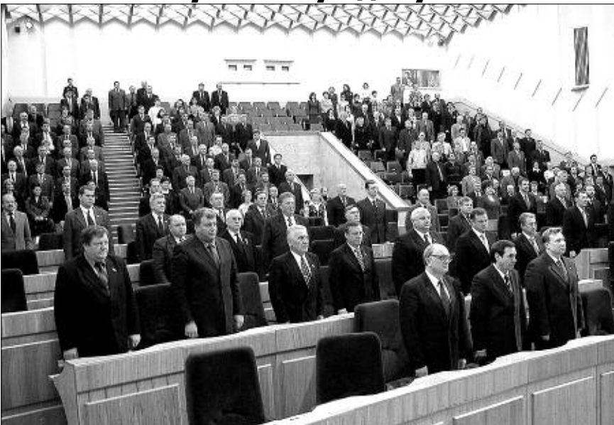
Открытие торжественного собрания. Звучит Гимн России.

Светлана СУЧКОВА.