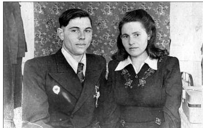
50 лет назад...