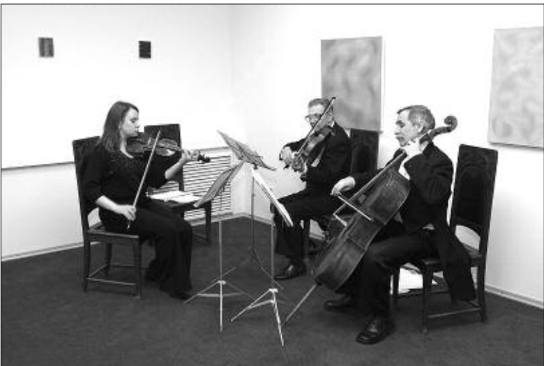
Музыканты группы «Юбилей-квартет».