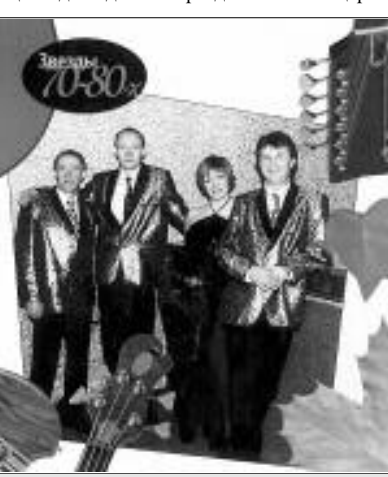
Ансамбль «Поющие сердца».