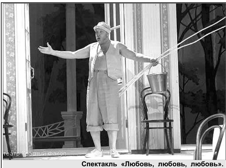
Спектакль «Любовь, любовь, любовь».