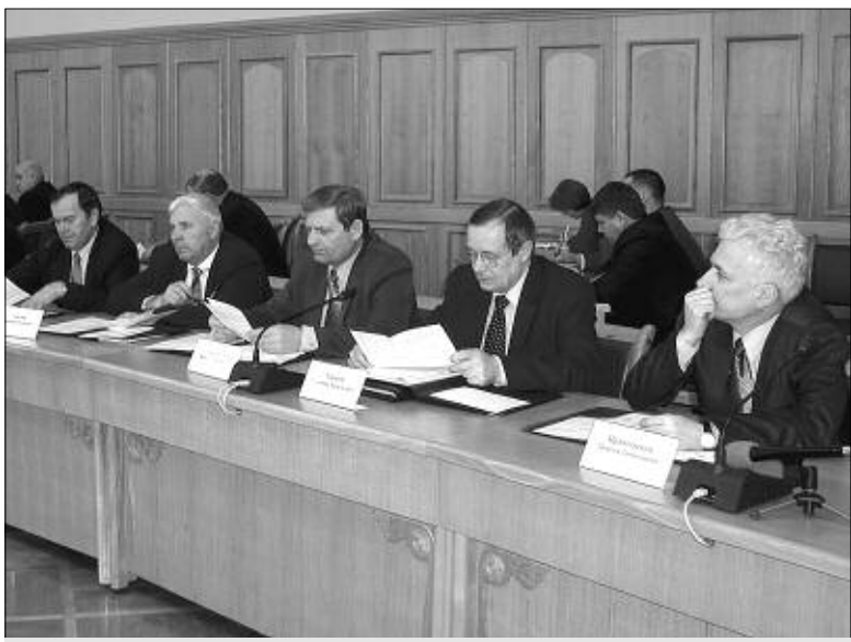
Идет заседание президиума обл администрации.