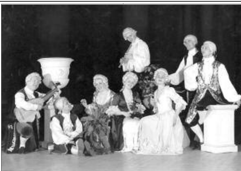
Ансамбль ранней музыки «Insula Magica».