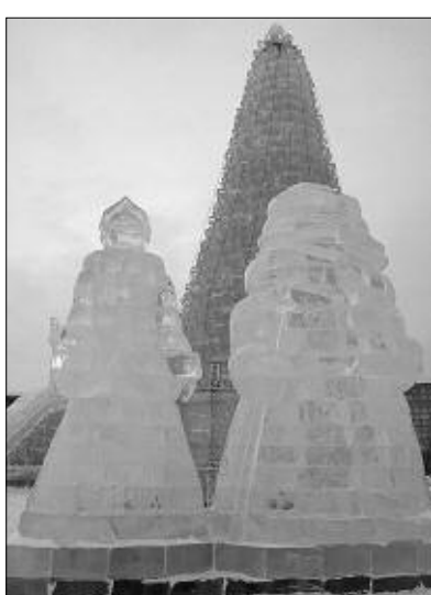
Ледовый городок на набережной.

Бассейн СКА ул. Воинская, 21. Тел. 60-01-66.