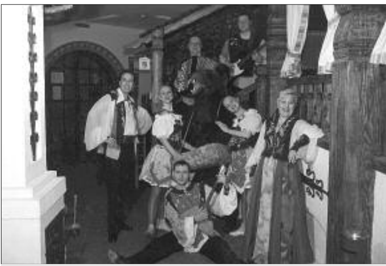
Ансамбль песни и танца «Сибирская тройка».