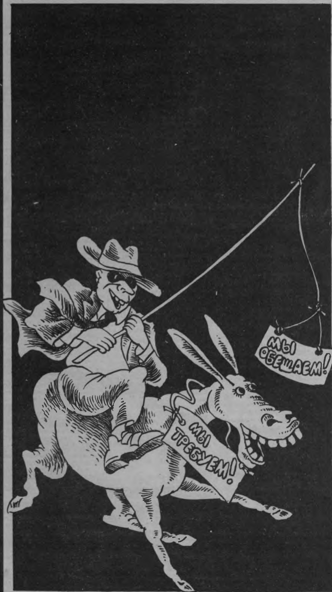
Рисунок АЛЕКСАНДРА ШАБАНОВА

На фото С. Андреева станция «Гагаринская».