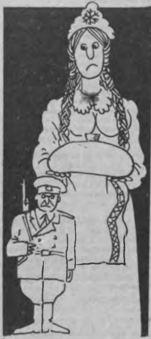
Рисунок А. Шабанова