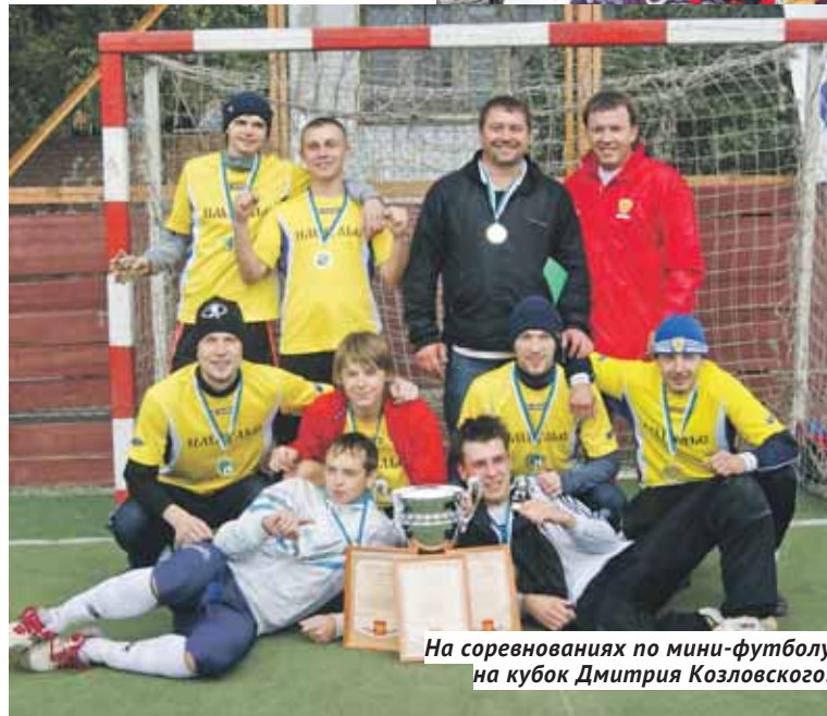
На соревнованиях по мини-футболу на кубок Дмитрия Козловского.

тая Слобода или Балластный карьер — живёт своей интересной и насыщенной жизнью, и праздники у каждого микрорайона тоже есть свои. Это прекрасная возможность отдохнуть от работы, провести время с близкими, зарядиться положительными эмоциями.