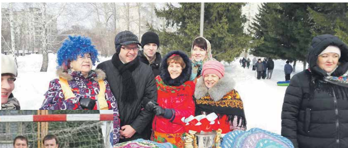
Масленица в Троицком сквере.

Не каждый областной центр России может похвастаться такой многолюдностью. Неудивительно, что каждый из микрорайонов Ленинского — будь то Западный или Троллейный, Чис-