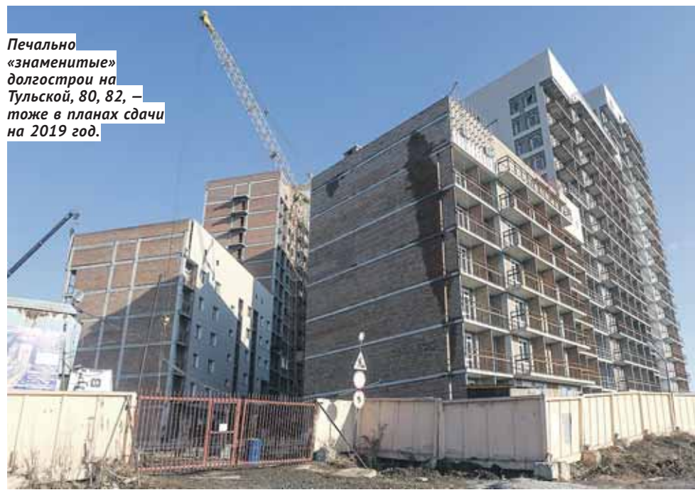
Печально «знаменитые» долгострои на Тульской, 80, 82, — тоже в планах сдачи на 2019 год.

6) Необеспечение обязательств застройщика по ДДУ поручительством банка или страхованием гражданской ответственности застройщика за неисполнение или ненадлежащее исполнение обязательств по передаче жилого помещения участнику долевого строительства по договору в порядке, установленном ФЗ. Либо осуществление выплаты по ДДУ, обеспеченному поручительством банка или страхованием гражданской ответственности застройщика, не может быть ввиду введения одной из процедур, применяемых в деле о банкротстве и (или) ликвидации соответствующей кредитной или страховой организаций.