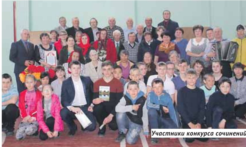
Участники конкурса сочинений.

Школа в селе Ирбизино Карасукского района — такая же многонациональная, как и само село.