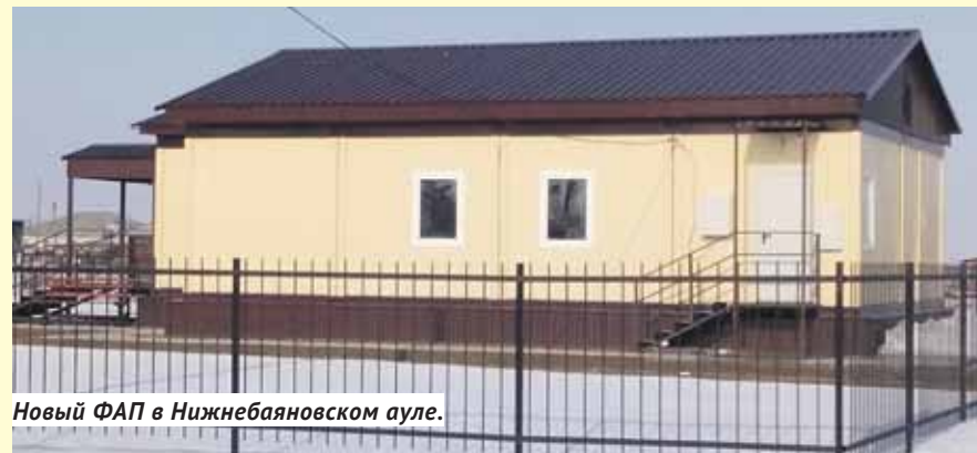
Новый ФАП в Нижнебаяновском ауле.