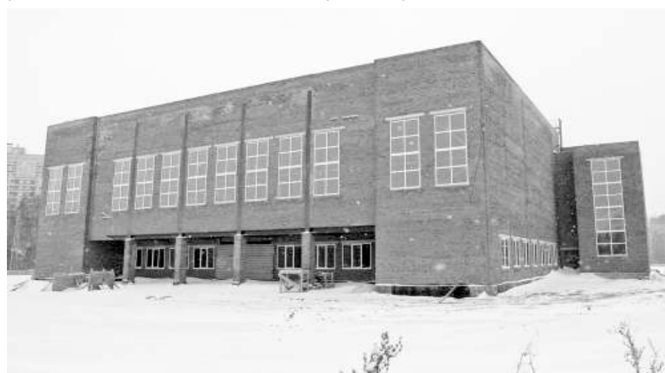
Региональный центр по фехтованию на ул. Тюленина должны сдать в конце 2015 года.