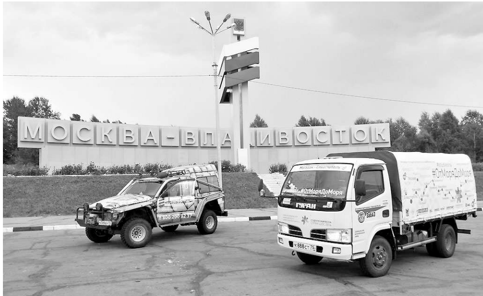
Автопробег от моря до моря.

— У меня очень сложная, «разнонаправленная» семья, в ней, например, одна половина раскулачивала другую. Но на Великую Отечественную из семьи ушло восемь мужиков, вернулось двое. Условный алтарь Отечества обильно полит их потом и кровью, они за эту страну воевали, они её строили, раз они сумели прожить такую жизнь, то и я могу что-то сделать. Я же когда-то умру, их там увижу, хочу, чтобы мне не стыдно было им в глаза смотреть.