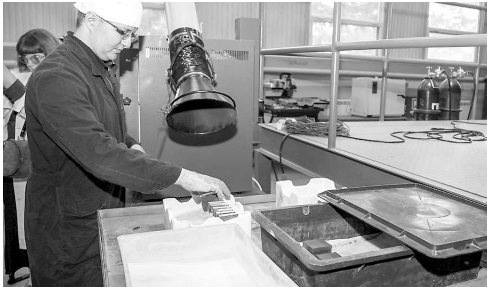
Выпуск продукции из новых видов нанокерамики — одно из направлений реиндустриализации. Подобные изделия уже успешно производят на «НЭВЗ-Керамикс».