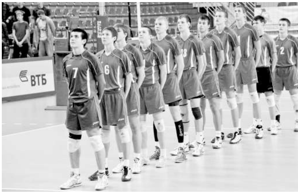
Звёздочки юного «Локомотива» к бою готовы!

В прошлом году за медали боролись сборные Монголии, Китая, Казахстана и Украины, а количество участников уже давно перешагнуло отметку в две тысячи человек. Даже за сравнительно короткий срок «Локоволей» даёт «продукцию» высшей пробы. Например, команда 1996—1997 годов рождения, победившая в первом турнире, в 2013-м выиграла первенство России в своём возрасте. Шестеро участников этой команды стали чемпионами мира в составе юношеской сборной России, а восемнадца-