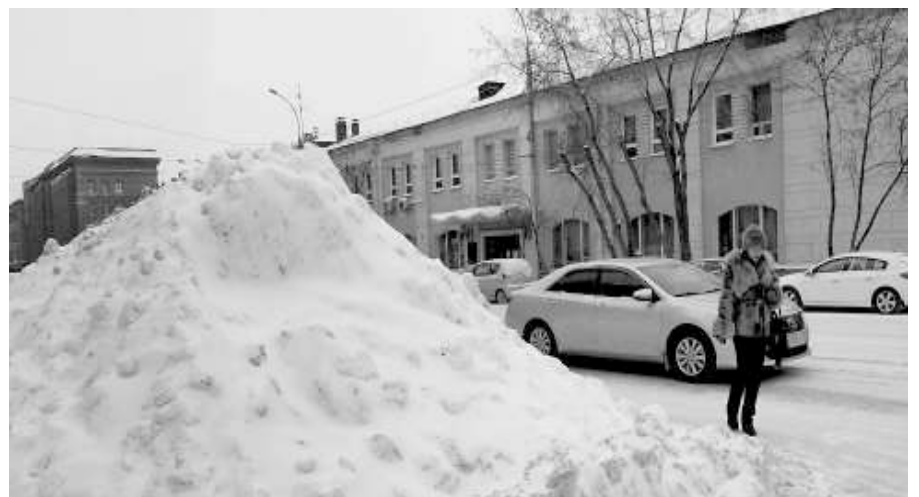
Если вы увидели в своём дворе такую кучу неубранного снега — жалуйтесь!

С помощью приложения можно не только отправлять сообщения о нарушениях, но и подавать сигнал SOS в случае, когда вам будет грозить опасность и понадобится помощь.