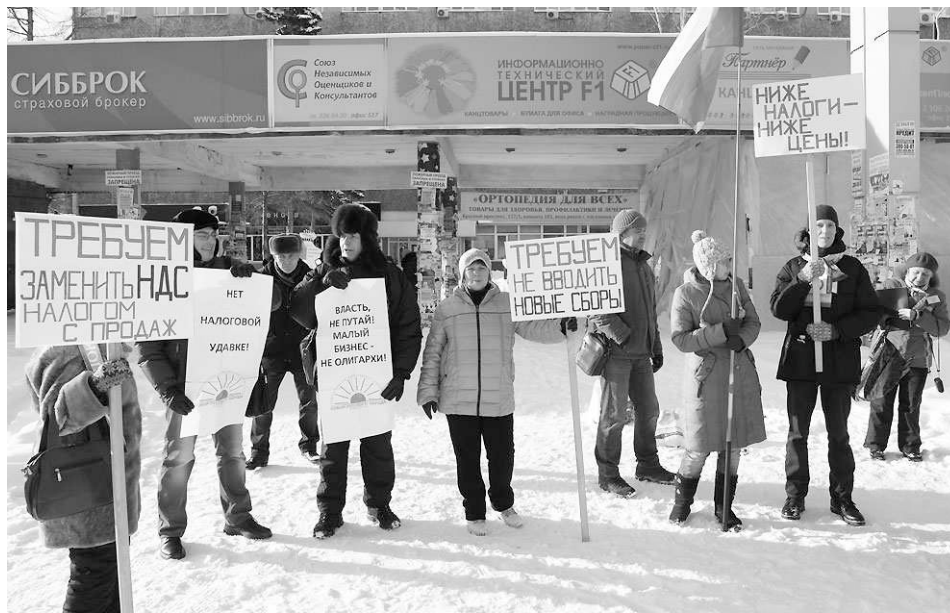
Около 20 новосибирских предпринимателей организовали пикет против введения «торгового сбора» в минувшие выходные.

«Нам не помощь нужна, нам нужно, чтобы нам не мешали». Эта реплика из зала, прозвучавшая на форуме малого и среднего предпринимательства «Сделано в Новосибирске», отражает общее мнение представителей малого и среднего бизнеса региона.