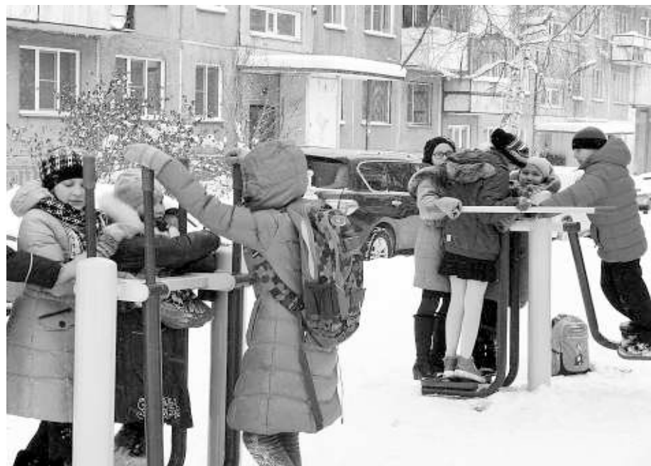
Занятия на свежем воздухе полезны в любом возрасте.

Уважаемая редакция «Ведомостей»! К вам обращаются жители дома № 194/3 по улице Б. Богаткова. Хотим через вашу газету выразить благодарность нашему депутату Законодательного собрания НСО Валерию Павловичу Ильенко .