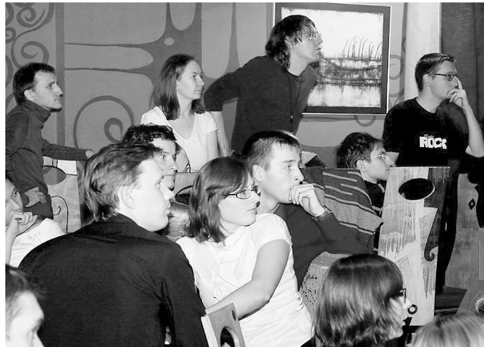
Видеовопрос: игроки, внимание на экран!

Квиз (от английского quiz ) — это предварительный экзамен, проверочный опрос. Автора игры зовут Шон Хеннеси, в неё играют за бокалом пива посетители европейских и американских пабов.