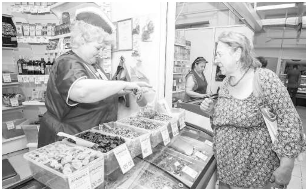
По прогнозам колебания цен по запрещённым продуктам из дальнего зарубежья будут наблюдаться в течение двух месяцев.

В мини-маркетах, во внутриквартальных магазинах экономкласса наполнение продуктовых стеллажей практически неизменно, импортных товаров здесь не более одного процента. А вот в ряде федеральных сетевых торговых