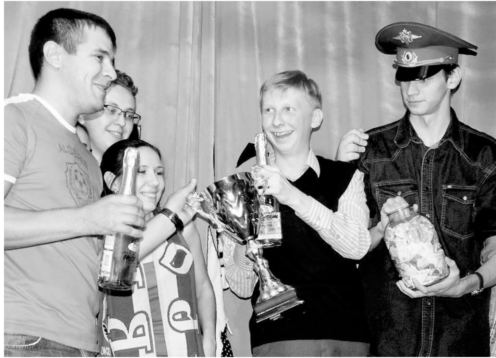
Первое место в одной из состязаний поделили команды «Моржата» и «Гладиолус».

Призовой фонд складывается из взносов участников — 250—300 рублей, эти средства идут на призовые и оплату ведущего, ещё часть денег откладывается на приз за победу в «золо-