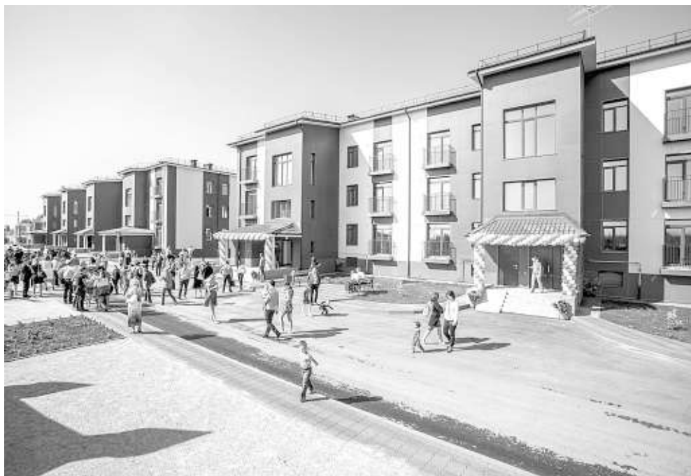
Сегодня в Новомарусино построили 10 домов, всего же их будет более 100.

Первая очередь посёлка включает 10 домов. Все дома имеют железобетонное основание, фундамент возведён на сваях длиной 15 метров. Дома первой очереди — трёхэтажные, высота потолков в квартирах — три метра. Материалом стен служит лёгкий газобетон. Строители организовали на площадке собственное производство бетона, что позволяет получать основной строительный материал практически по себестоимости, соответственно, снижается стоимость конечного продукта.