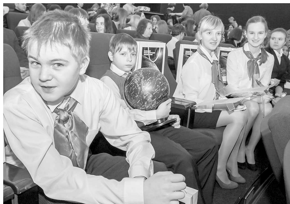
В Новосибирский планетарий ходят на образовательные экскурсии целыми классами.

В центре десятки различных объединений: образцовый коллектив «Студия танца “Звезды Галактики”», студии эстрадного вокала, спортивного танца, декоративно-прикладного творчества, радиотехнического конструирования робототехники, «Мир компьютера», ансамбль авторской песни, театр. Более двух десятков лет