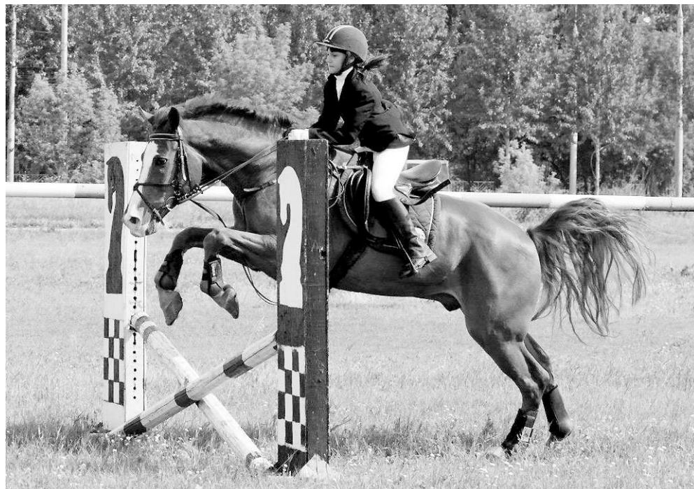
Новосибирский ипподром приглашает на подготовительные курсы школьников с 9 лет.

Конным спортом бесплатно школьники могут заниматься в Центре спортивной подготовки