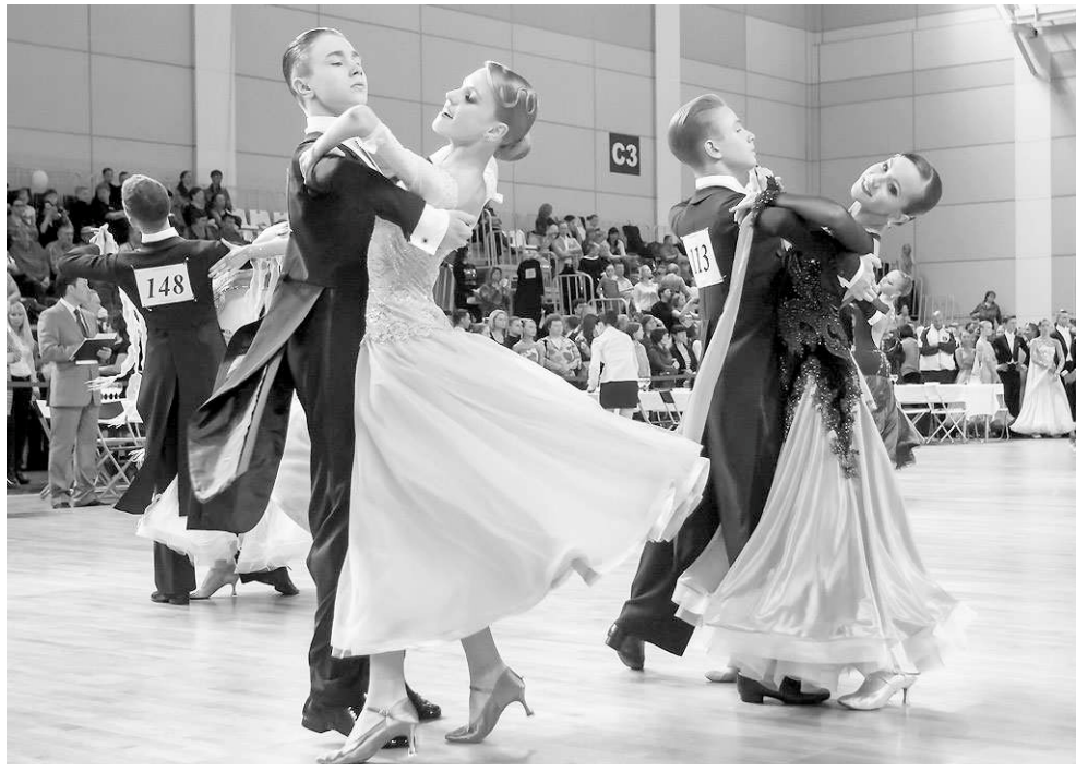
Бальные танцы — одно из популярных увлечений юных новосибирцев.

Однако даже по «платным» направлениям чаще всего можно найти бесплатную альтернативу. Например, в муниципальных учреждениях дополнительного образования. Крупные детские центры в основном «многопрофильные» — они работают по нескольким направлениям, приглашая детей петь, танцевать, заниматься спортом, техническим и художественным творчеством. Например, во Дворце творчества детей и учащейся молодежи «Юниор» (ул. Кирова, 44/1, тел. 217-86-87) работает более ста секций, студий, творческих мастерских и других детских объединений, в которых ежегодно занимается более четырёх ты-