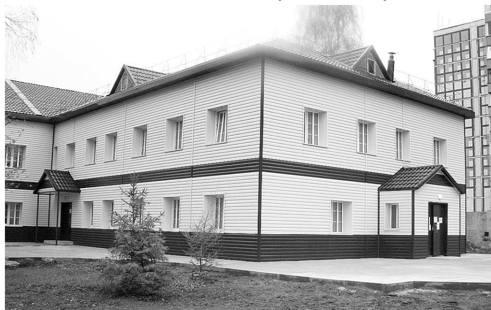
Выполнение фасада здания НОКВД по ул. Объединения.

Сегодня компания «Полёт» выполняет один из крупных заказов для Управления судебного департамента в Новосибирской области и очень