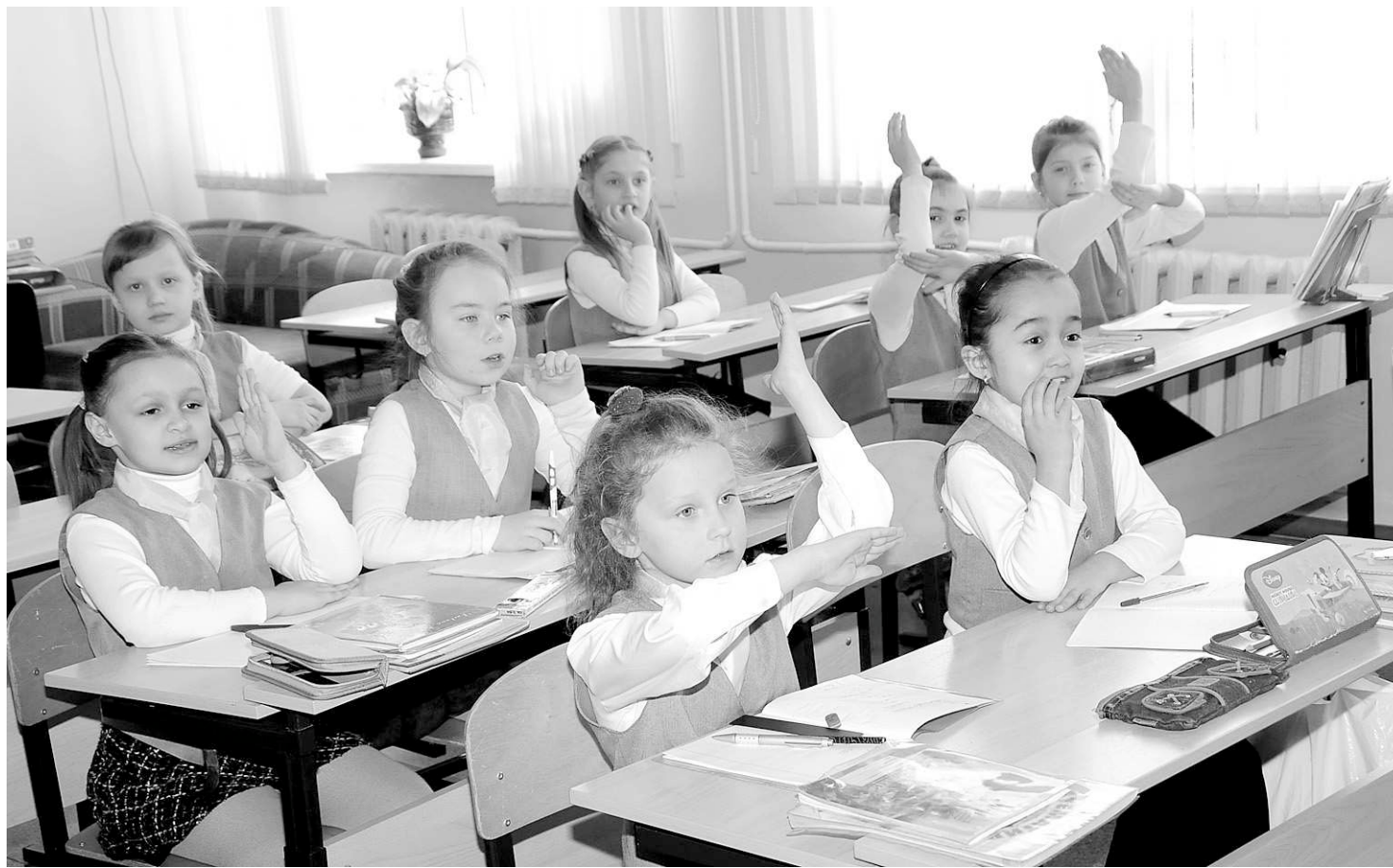
Если ребёнку в семье не говорят о различии добра и зла, то он вряд ли научится этому в школе.

В Новосибирской области при изучении учебного курса «Основы религиозных культур и светской этики» более половины родителей четвероклассников отдают предпочтение модулю «Основы светской этики».