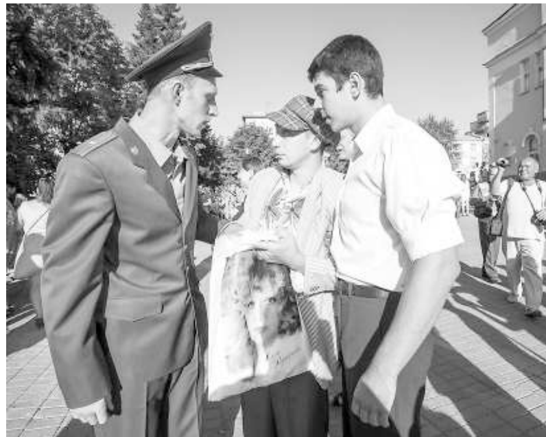
Молодые актёры «Красного факела» легко вжились в образы советских граждан — законопослушных и не очень.

но. Но афиша на фронтоне театрального здания и непосвящённым объясняла суть происходящего.