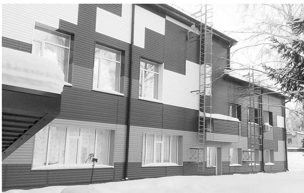
Областной центр социальной помощи семье и детям «Морской залив» после ремонтных работ.

значимый для города объект — возведение здания Ленинского районного суда. Контракт, рассчитанный на три года, предполагает строительство на месте бывшего пустыря нового здания для ведения судопроизводства, отвечающего самым современным требованиям. Глава компании не без гордости показывает фотографии, на которых запечатлены все этапы работы: пустырь, расчистка территории от деревьев, котлован, сваи, постепенное преобразование строительной площадки.