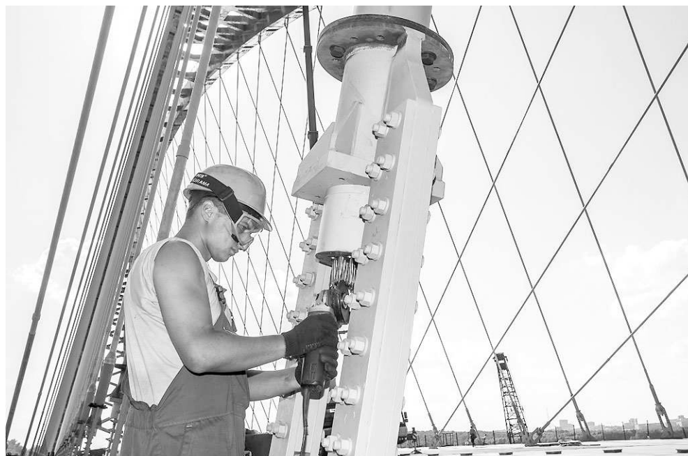
Новый мост через Обь будет одним из самых красивых в России.

Врио губернатора Новосибирской области Владимир Городецкий, в свою очередь, подчеркнул, что реализовать такой проект стало возможным благодаря взаимопониманию на