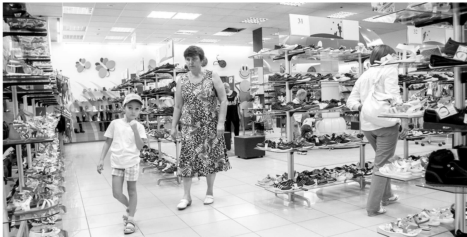
Главный аргумент сторонников нового налога — пополнение испытывающих дефицит региональных бюджетов.

Однако налог с продаж вводился на короткий, в три года, срок как временная, посткри-