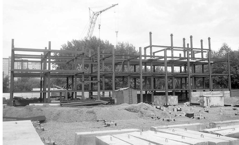
Через два года на этом месте будет современное здание Ленинского районного суда.

кровельные, высотные работы, а также общестроительные работы, реконструкцию и капремонт зданий.