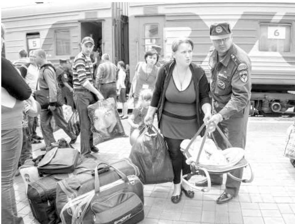
176 жителей Луганской области прибыли вчера в Новосибирск.