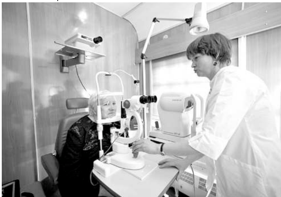
В этом году врачи корабля-церкви и автопоезда должны принять более 10 тысяч человек.

Представители новосибирской митрополии РПЦ, врачи, социальные работники, деятели культуры в очередной раз отправляются с духовно-просветительской миссией в отдалённые уголки Новосибирской области.