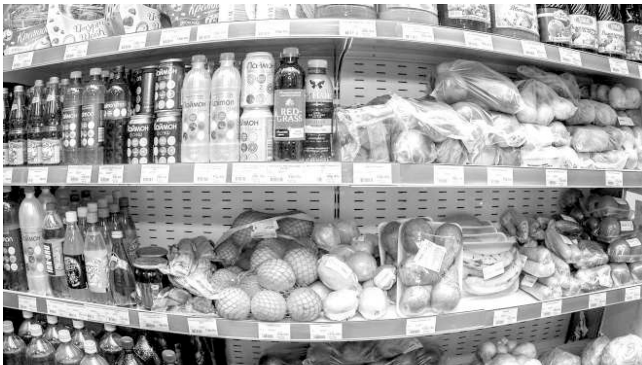
Ассортимент продуктов питания на прилавках магазинов должен измениться в пользу отечественного производителя.