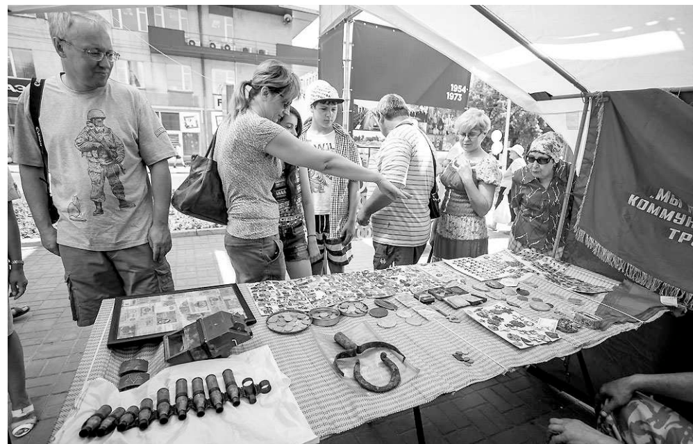
В День города новосибирцы находили время и для того, чтобы рассмотреть старинные значки и монеты.

«В Новосибирске коллекционеров меньше, чем в крупных городах на западе страны, зато они все — люди подготовленные, профессиональные, хорошо разбирающиеся в антиквариате».