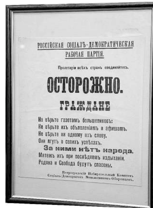
Плакат к выборам в Учредительное собрание 1917 года.

«Антиквариат в Новосибирск завозили три волны: в 1934 году жители Ленинграда, выселенные из родного города после убийства Кирова; в 1945 году военные везли трофейные вещи; в 1957 году свои коллекции привезли учёные-основатели Академгородка... Сейчас русские вещи в России стоят дороже, чем на Западе, поэтому их уже не вывозят, наоборот, везут обратно на родину».