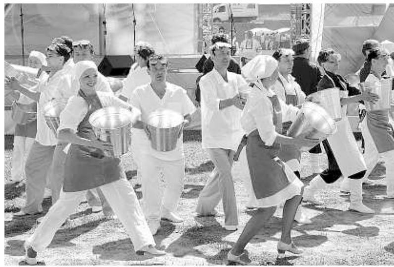
День животноводов открыли выступления творческих коллективов.

Кстати, на государственную поддержку животноводства Новосибирской области в 2013 году было направлено 1,9 млрд рублей, за шесть месяцев текущего года — 1 млрд рублей, в том числе 686 млн за счёт средств областного бюджета. В конце июля состоится Совет агропромышленного комплекса, где будет проанализирована эффективность этих мер.