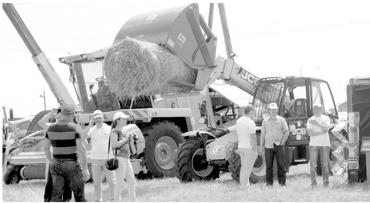
На господдержку животноводства НСО направлено за шесть месяцев текущего года около 1 млрд рублей.

На экскурсии по ярмарке врио главы региона познакомился и с новыми технологиями, применяемыми в животноводстве. Представители компании «МолСиб», которая, к слову, установила первый доильный зал именно в «Ирмени» в 2006 году, рассказали о системе DelPro, которая обеспечивает автоматическую регистрацию надоев. Информация от ка-