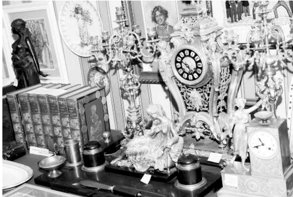
В «Сибирской горнице» много редких интересных вещей.

Последняя волна — это учёные, создававшие Академгородок, они были в основном люди не бедные — привезли сюда коллекции