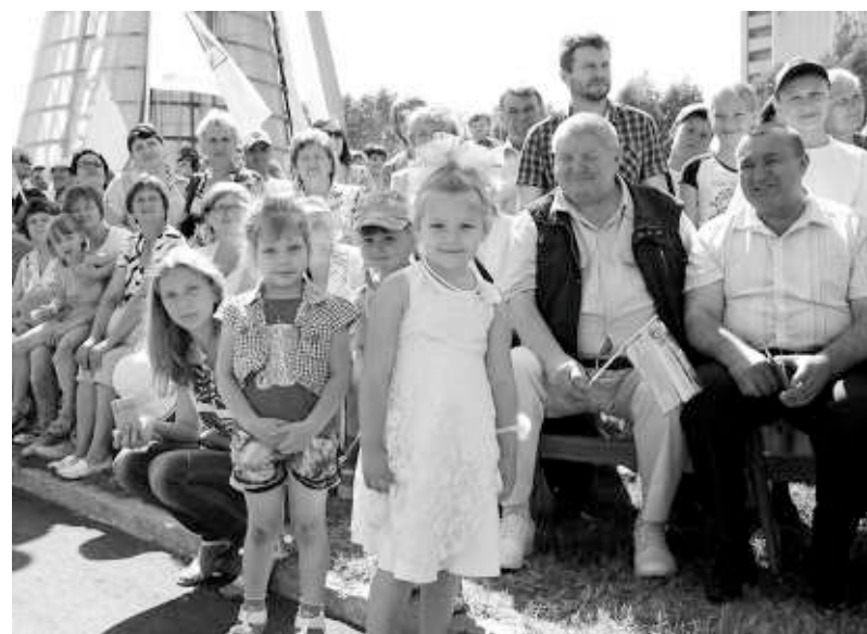
День рождения — один на всех!

ным ресурсам города, сельский труд здесь приобретает интенсивный, «промышленный» характер. На стыке с городской инфраструктурой в экономике района всё более усиливается роль и собственно промышленного производства. Возникли крупные, динамично развивающиеся предприятия, а в последние годы создаются наукоёмкие компании.