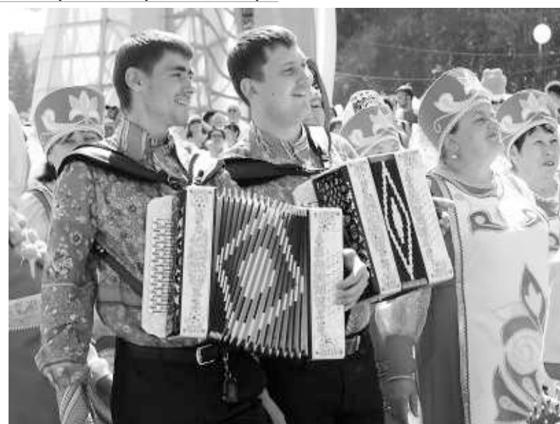
Какой же праздник без баяна!