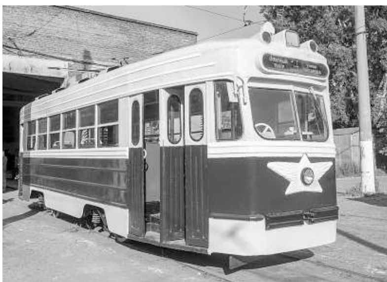
Это трамвай в день города будет курсировать по маршруту «Оперный театр» — «Улица Писарева».

Интересно, что первая попытка создать троллейбусное движение в Новосибирске относится к 1943 году! Был намечен маршрут: «Вокзал — завод им. Чкалова». Причина — наличие в городе... троллейбусов. В самом начале войны в Куйбышев (Самара) были свезены машины, эвакуированные из городов, захваченных врагом. Позже их разослали по удалённым от фронта городам, где предполагалось открытие троллейбусного движения. 10 машин досталось Новосибирску.