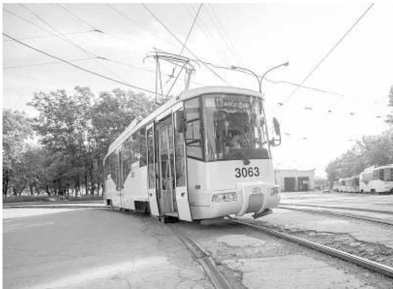
Современные новосибирские трамваи.

Дослужился он до директора Дзержинского депо, работал с полной