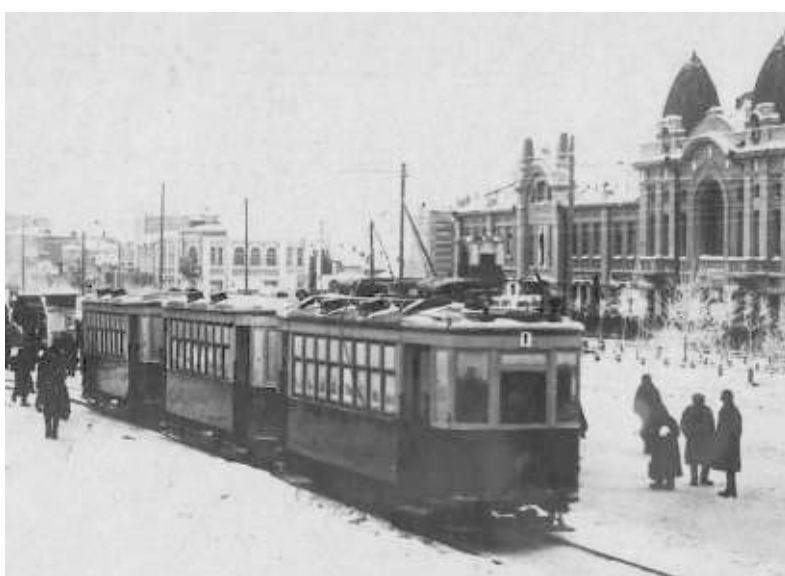
Трамвай в 1935 году.

Трамвай на фронт, конечно, не отправишь, а вот вспомогательную тягловую силу отправлять, как, например, коней Венере и Апрель, которых перед фронтом «использовали на лёгких работах, чтоб вести упитанность до хорошей», гласит документ от 28 июля 1941 года. Это значит, что у транспортников добавилось ручного труда, а ведь работу мужчин в военное время взяли на себя женщины. Появилась у трамвая и новая функция: он стал в полном смысле грузовым транспортом, подвозившим к заводам материалы и комплектующие, а оттуда забирал военную продукцию.