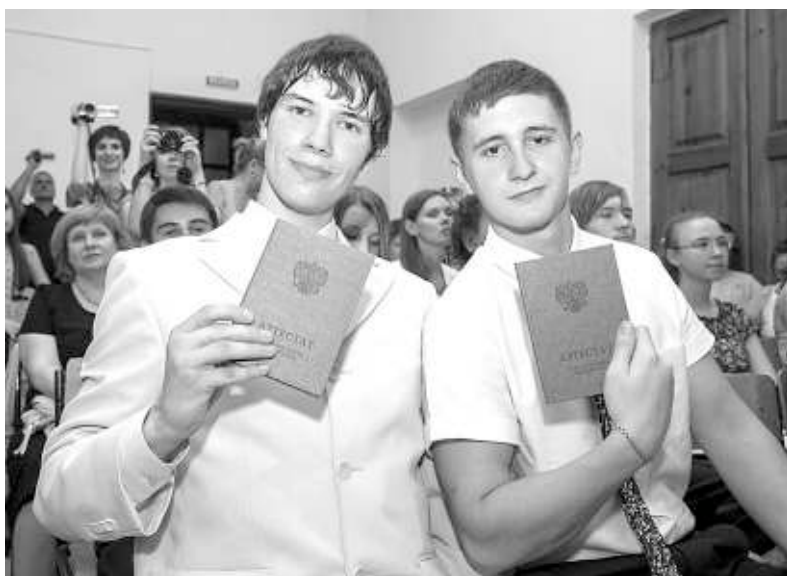
Итог одиннадцати школьных лет — заветные корочки.

В целом результаты ЕГЭ оказались несколько ниже, чем в прошлом году, хотя средние баллы по обязательным — математике и русскому языку — остались на прежнем уровне: 62 и 46 соответственно. А вот по большинству необязательных предметов средний балл оказался ниже прошлогоднего. Так, по физике он снизился с 56 до 46, по химии — с 67 до 56, по обществознанию — с 57 до 51. Минимальный порог по русскому языку не преодолел 21 выпускник (0,45 процента), по математике — 537 (4 процента). В прошлом году эти цифры были существенно выше: 82 и 1705 соответственно. В итоге не получили школьный аттестат 216 выпускников школ, что составляет один процент от общего числа. В 2013-м неудачников было в три раза больше.